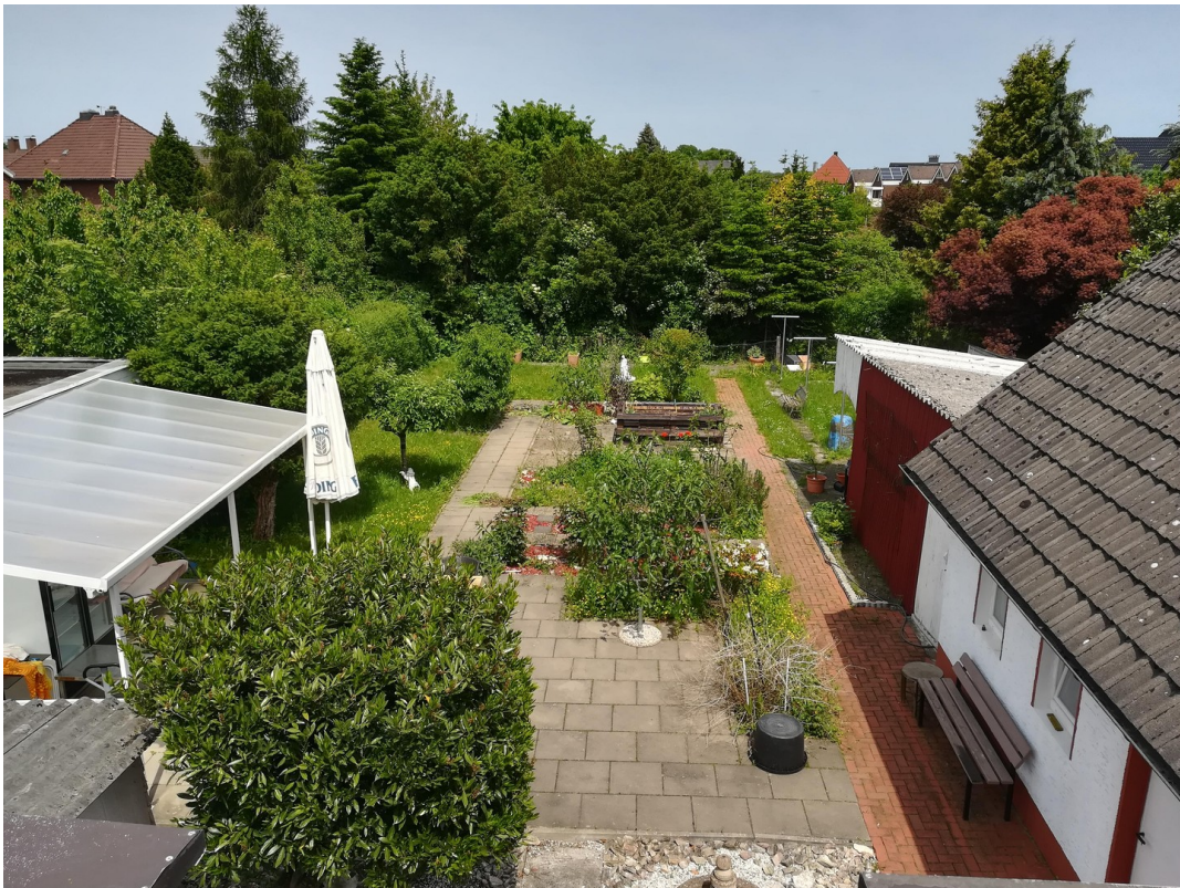
Aussicht vom 1.OG