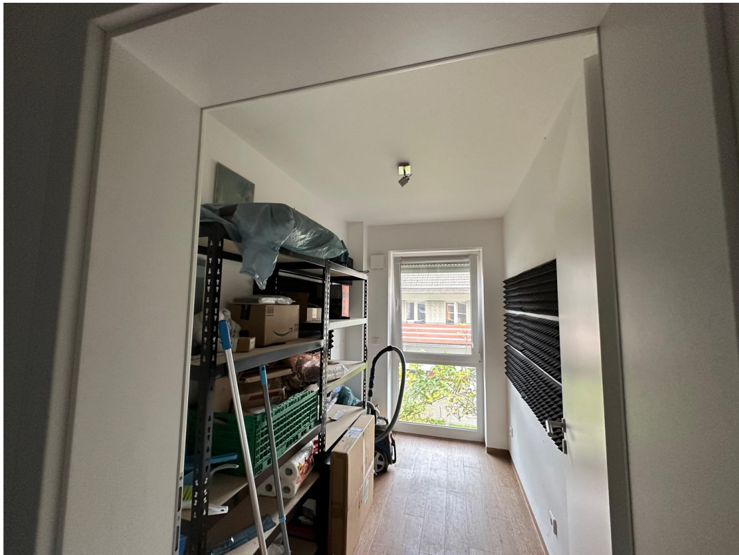
Halbes Zimmer als Abstellraum