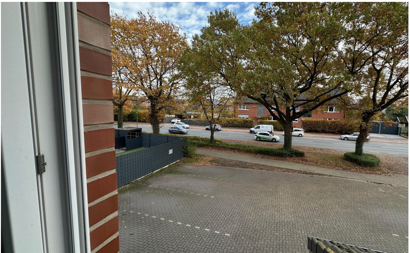
Blick aus Küche auf Parkfläche