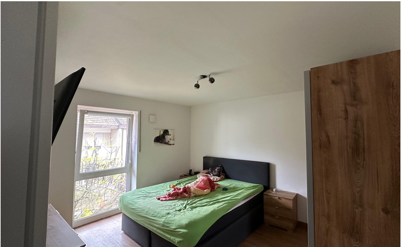
Schlafen von Eingangsbereich z