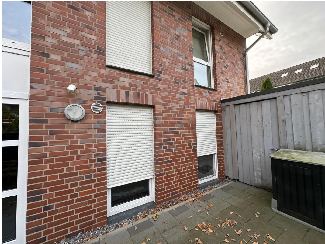
Eingangsbereich rechts mit Fah