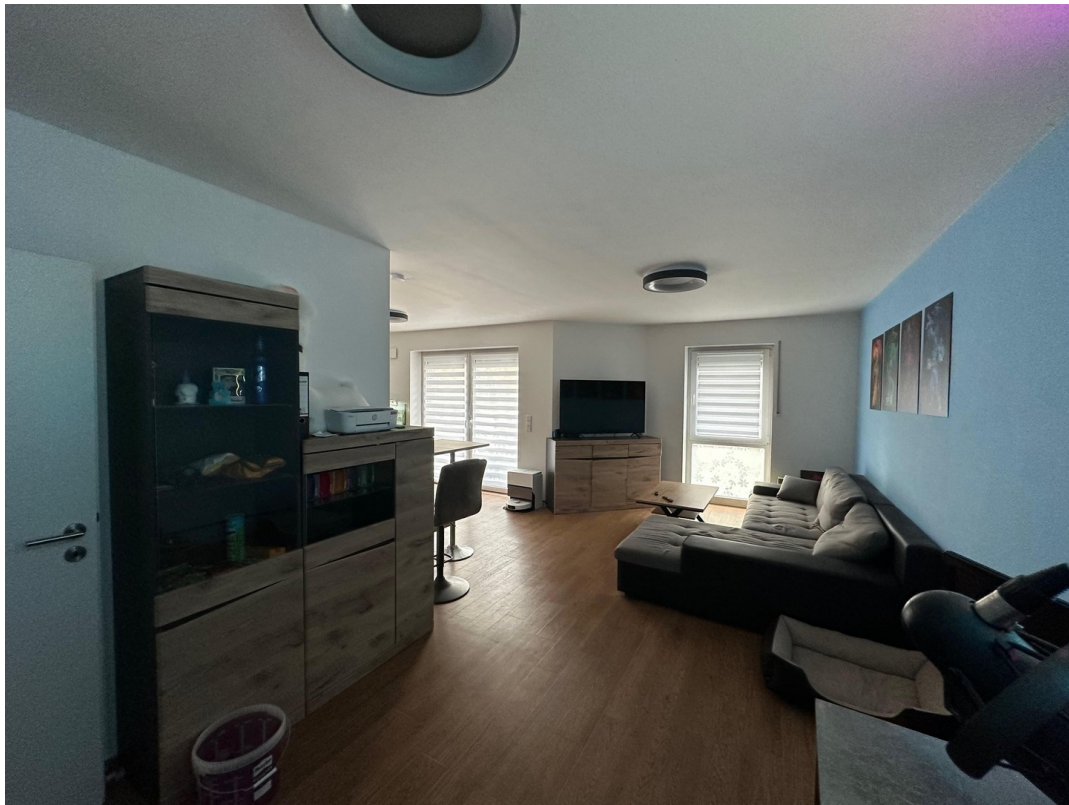
Wohnen von Ecke zu WE4 und Die