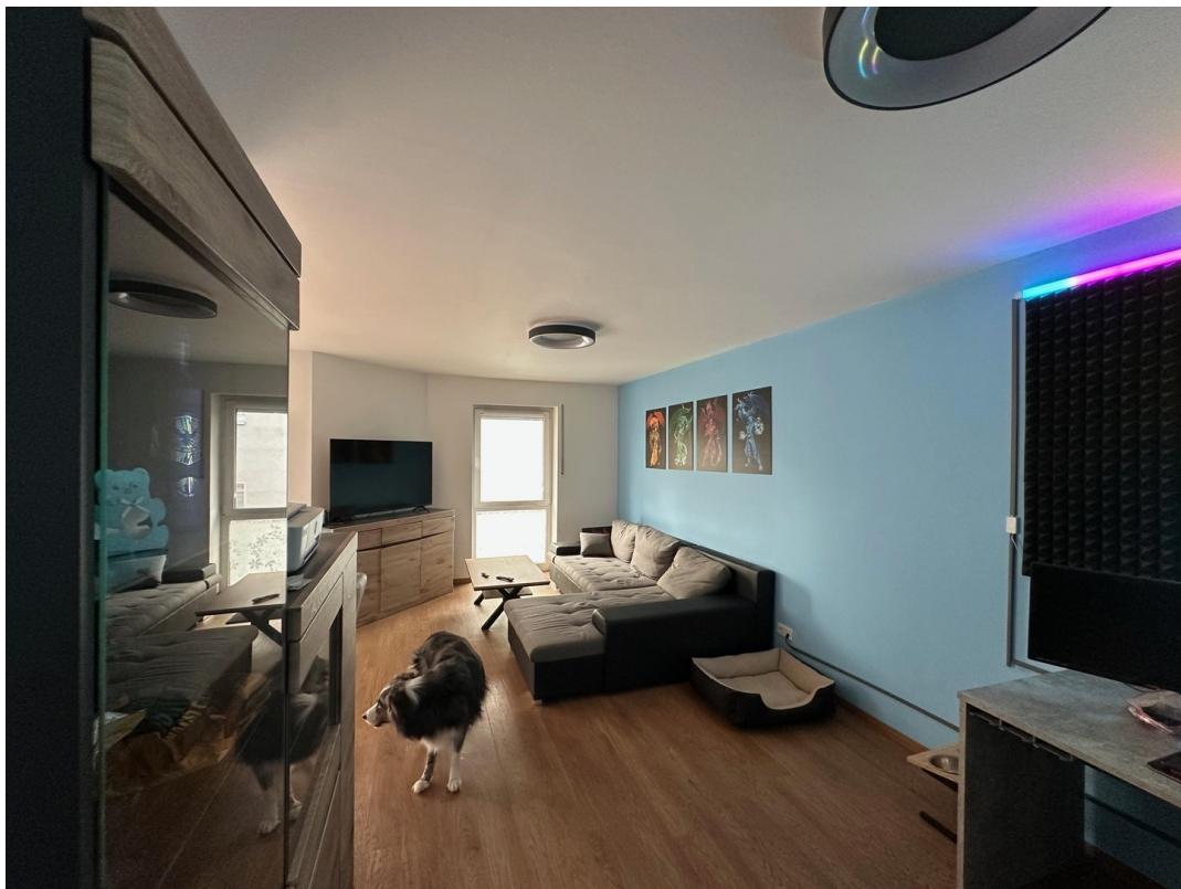
Wohnen vom Eingangsbereich aus