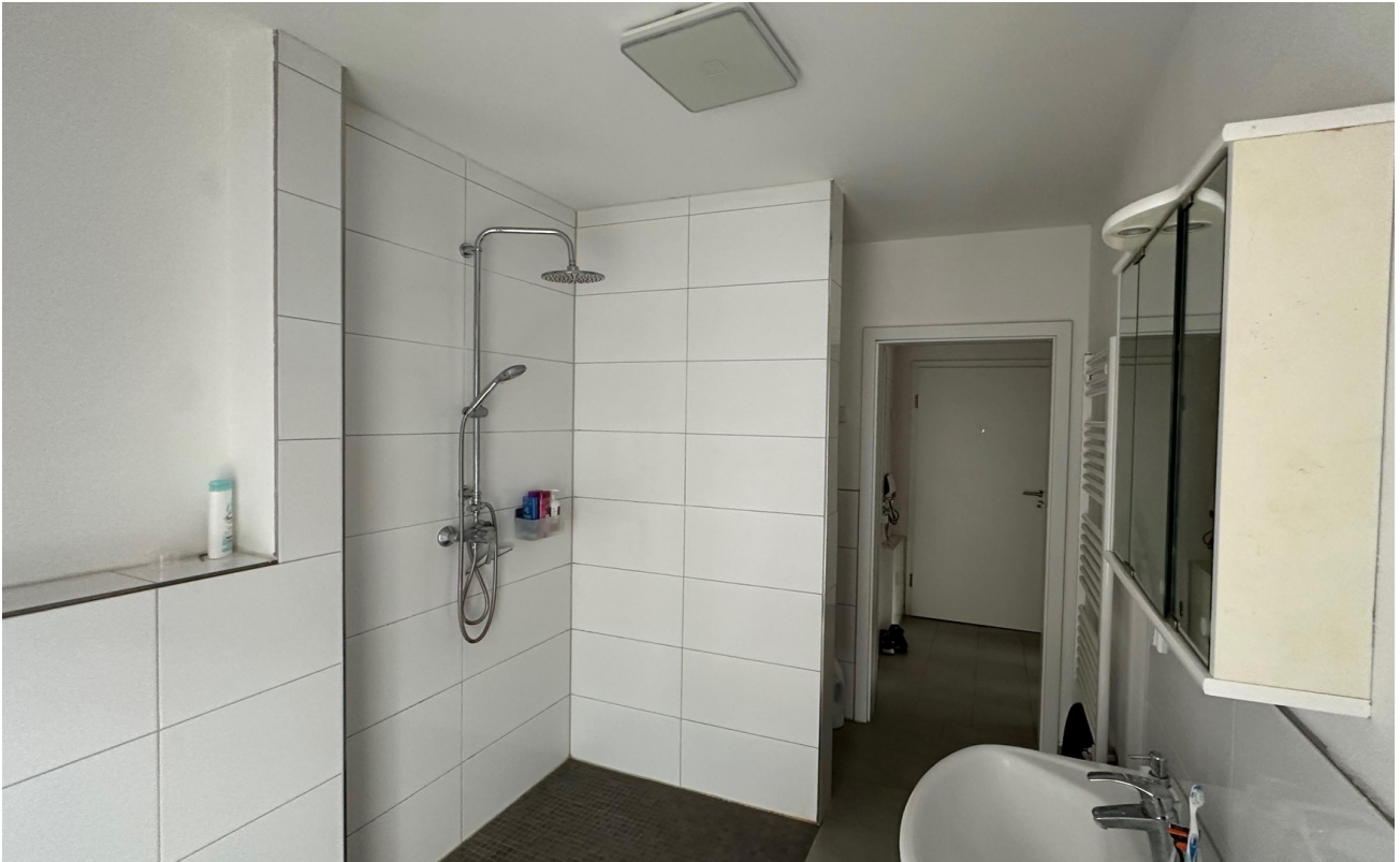
Duschbad zu Diele, Platz für W