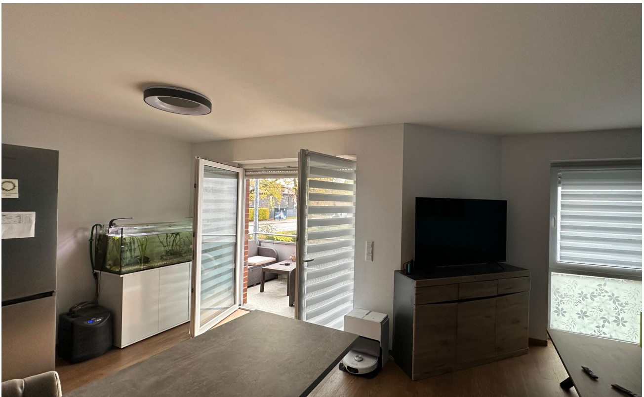
Wohnen vom Mitte aus nach link