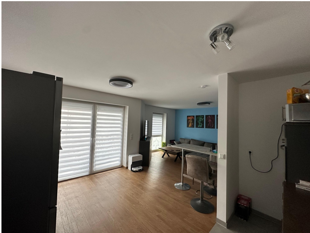
Kochen zu Wohnbereichen