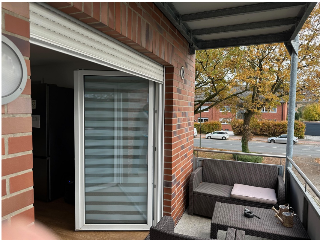
Balkon zu Stellplätzen und DS