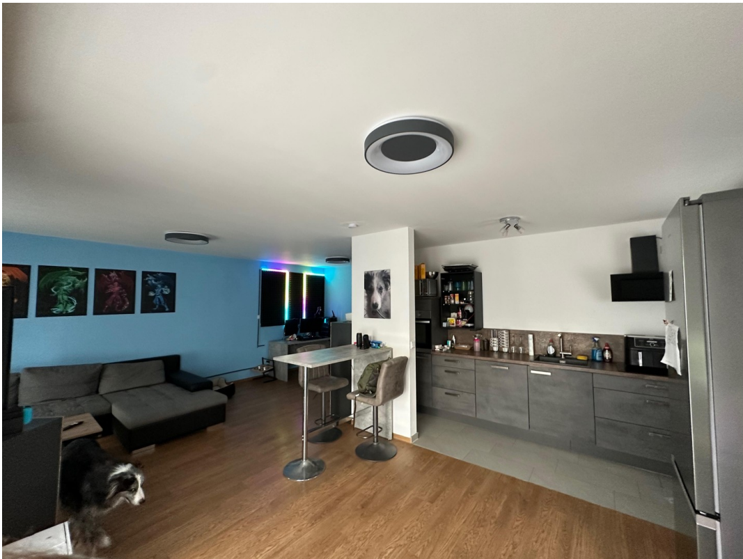
Wohnen vor Balkon zu Kochen un