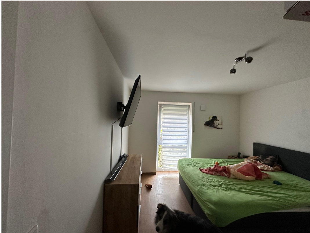
Schlafen von Eingangsbereich z