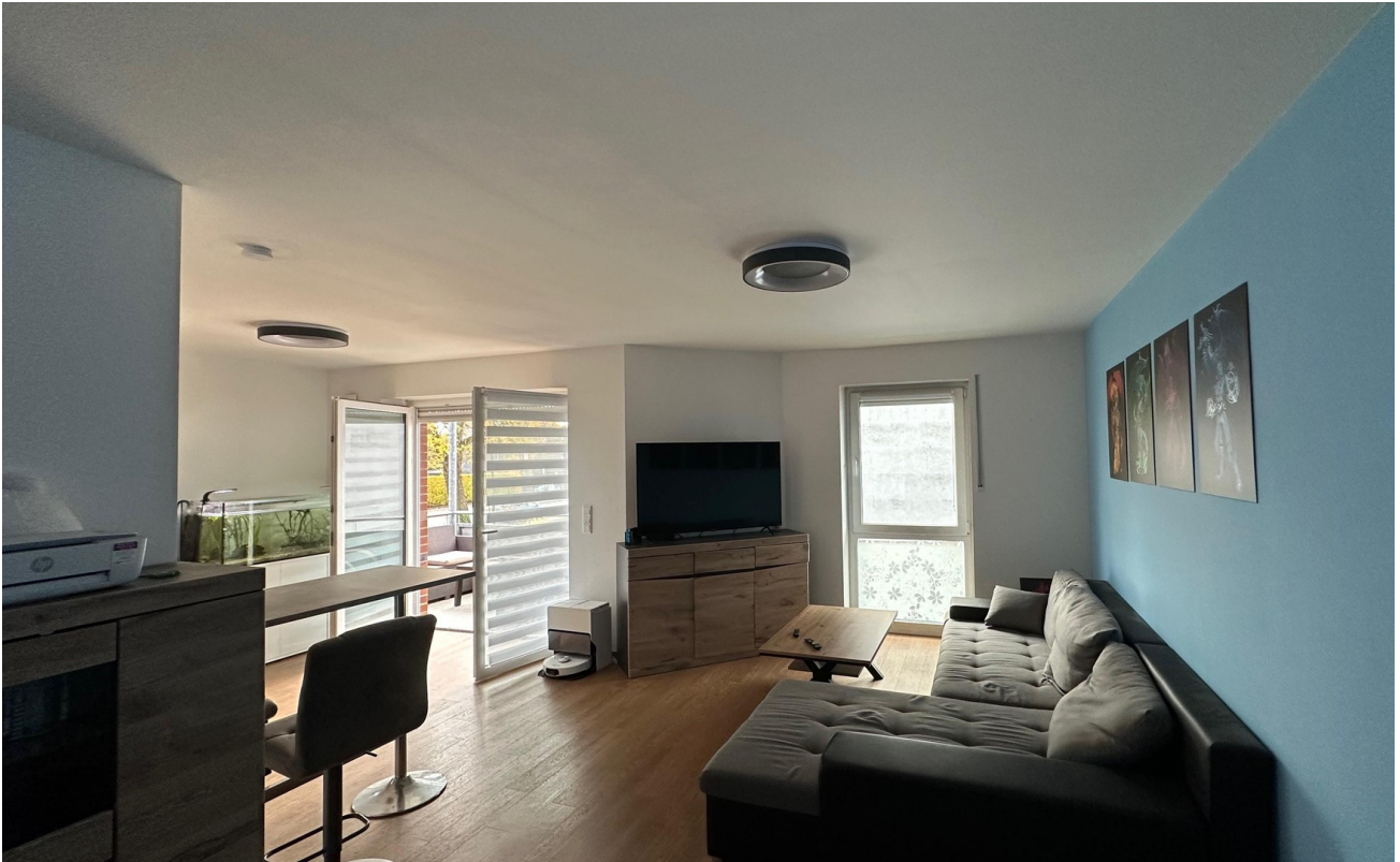
Wohnen vom Eingangsbereich aus