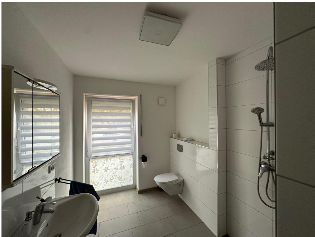
Duschbad von Zimmereingangstür