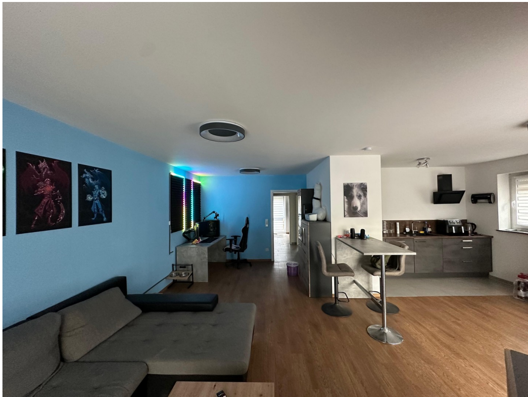
Wohnen Ecke zu WE4 zu Kochen u