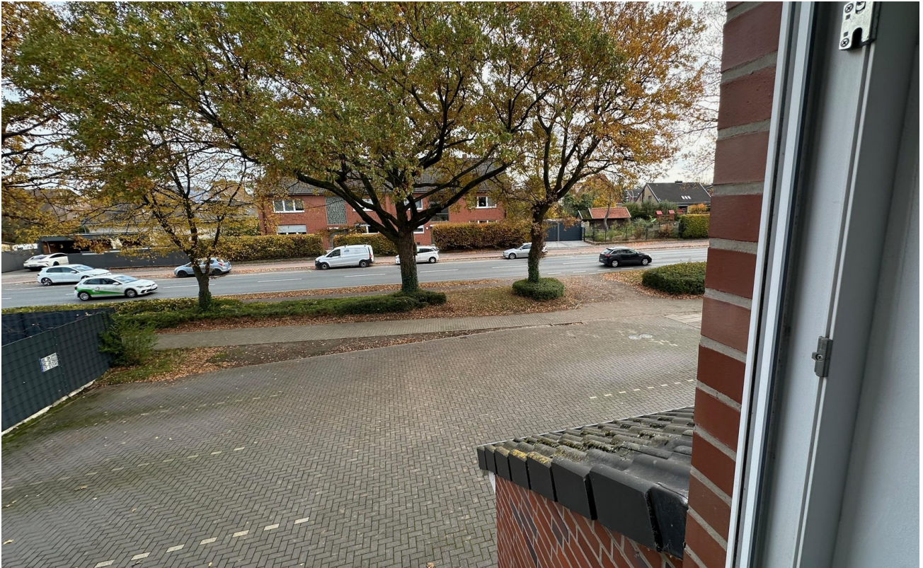
Blick aus Küche auf Parkfläche