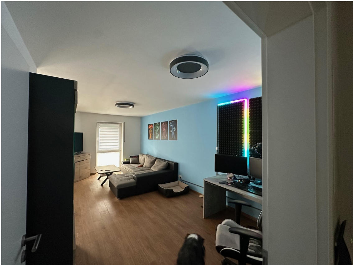
Wohnen von Zimmertür zu bodent