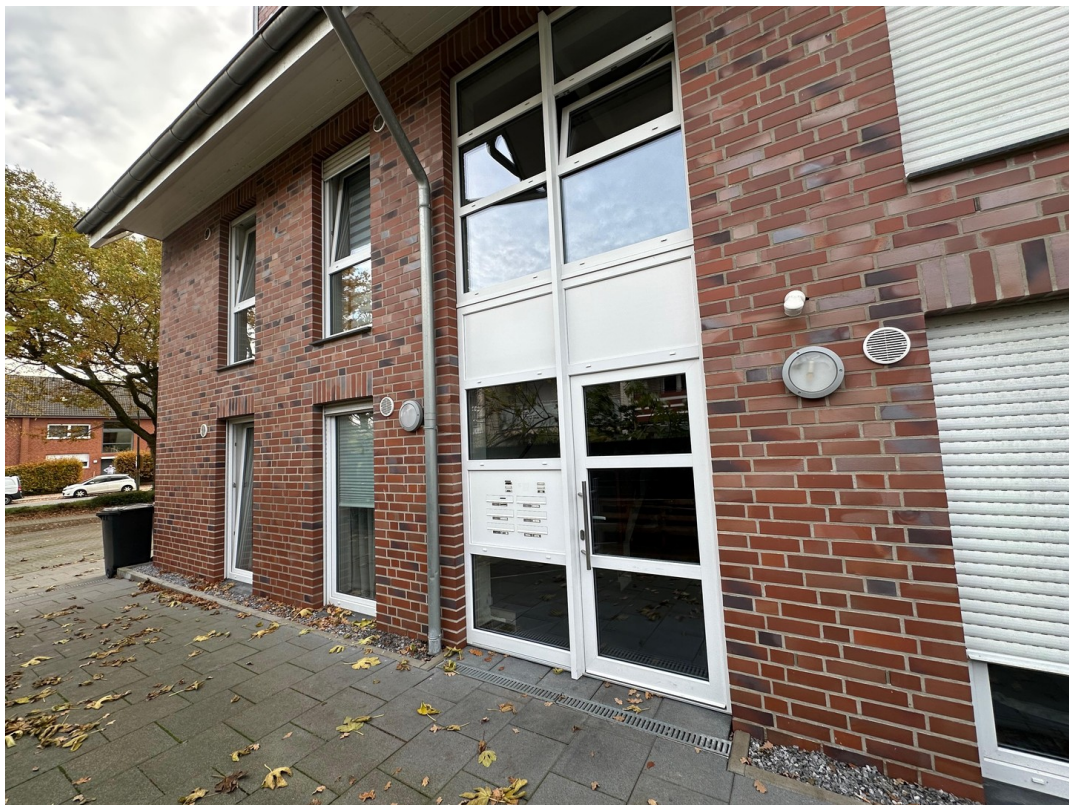
Eingangsbereich, Wohnung oben