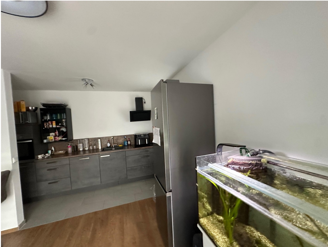
Wohnen vor Balkon zu Kochen ge