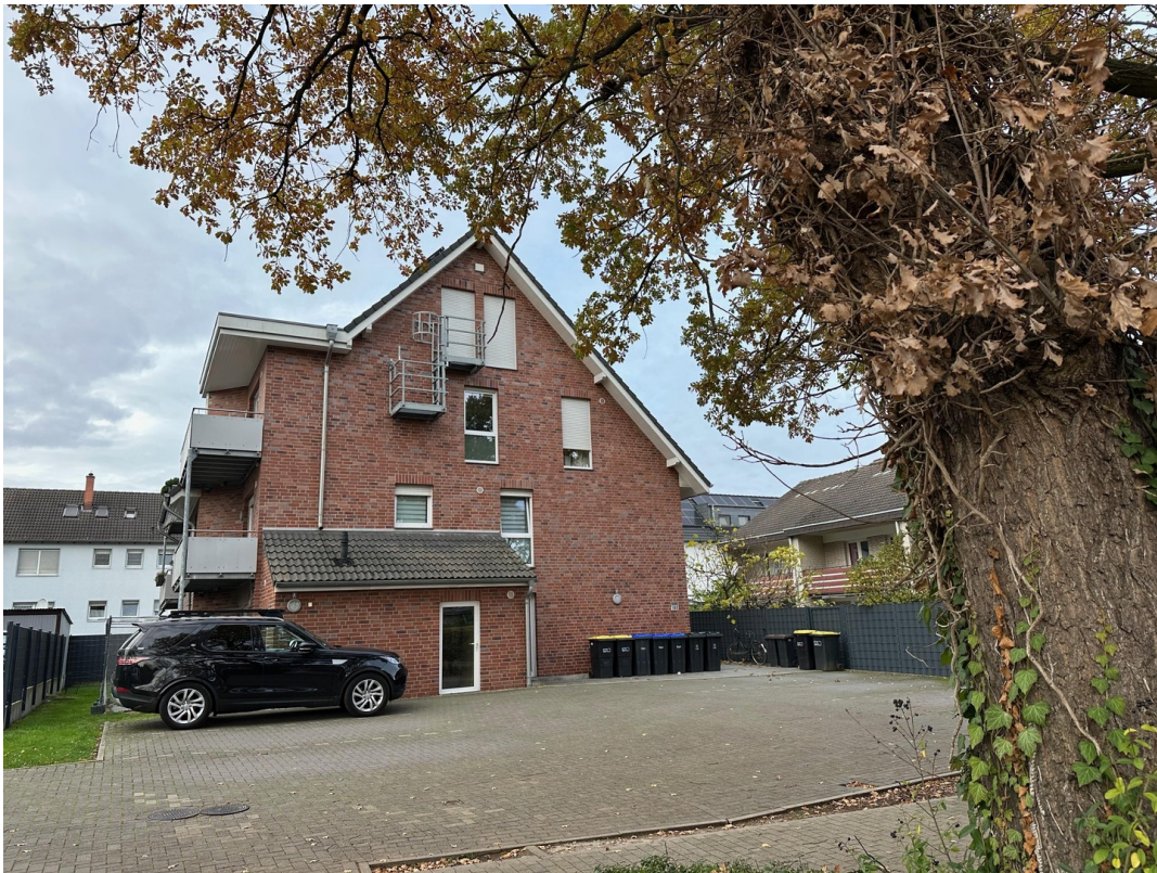
Haus und Stellplätze ab Einfahr