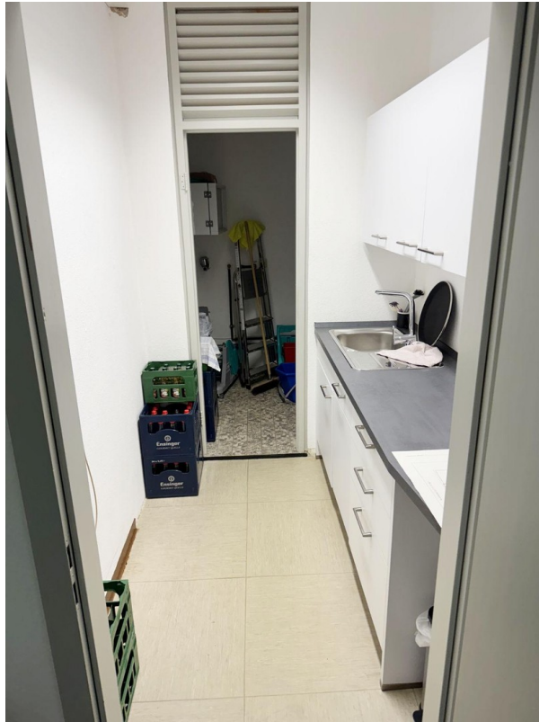
Küche + Abstell / Technik