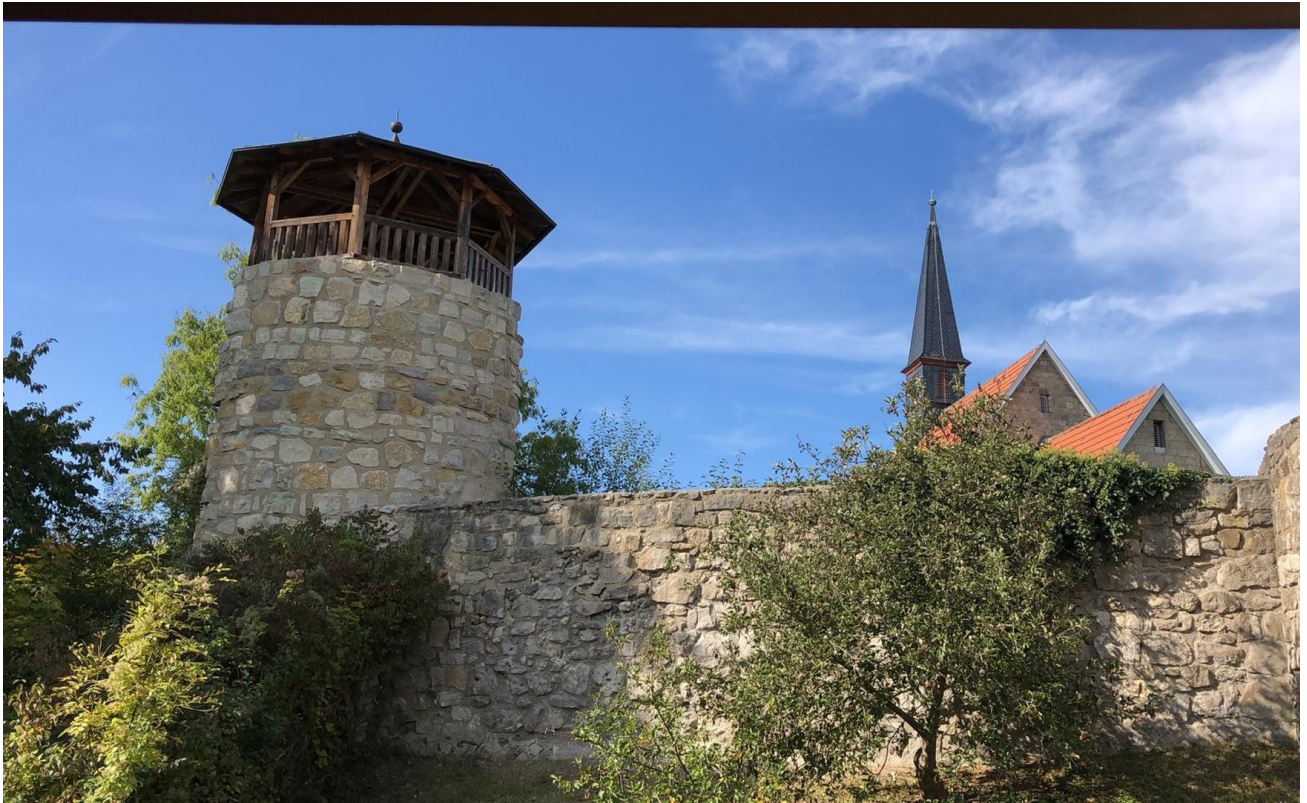
Stadtmauerblick von Garten