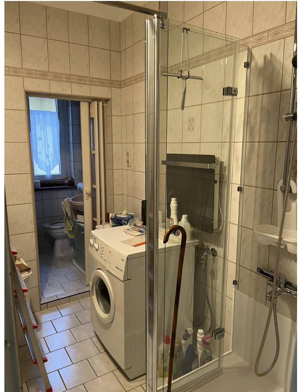
Bad EG m. Dusche und Badewanne