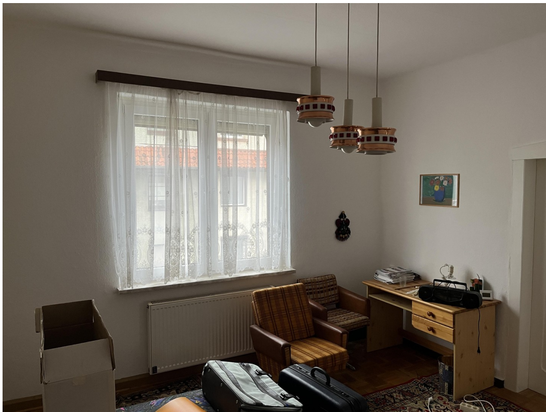
Kinderzimmer im Obergeschoss