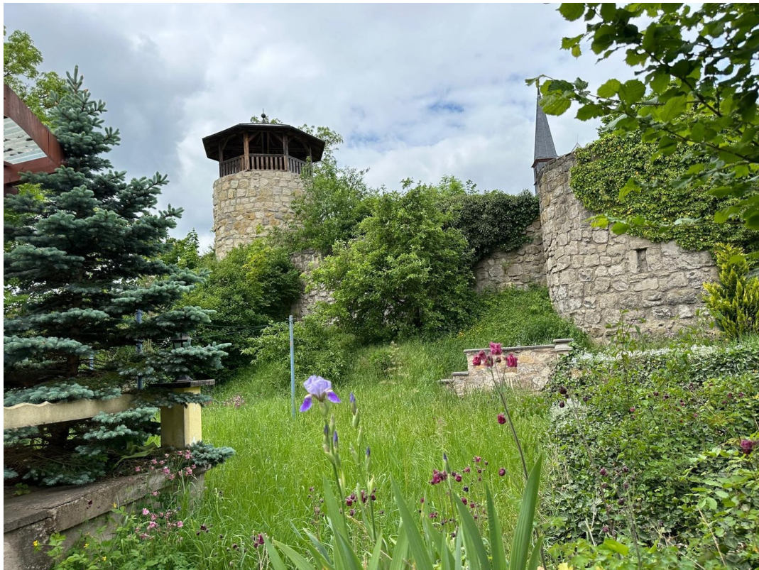
Garten + Blick auf Stadtmauer