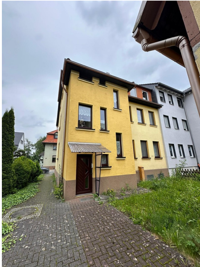
Haus von hinten mit Zufahrt