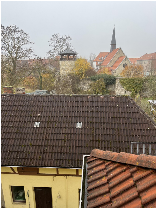
Blick aus Küche Dachgeschoss