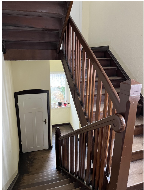
Treppenhaus mit Holzterre