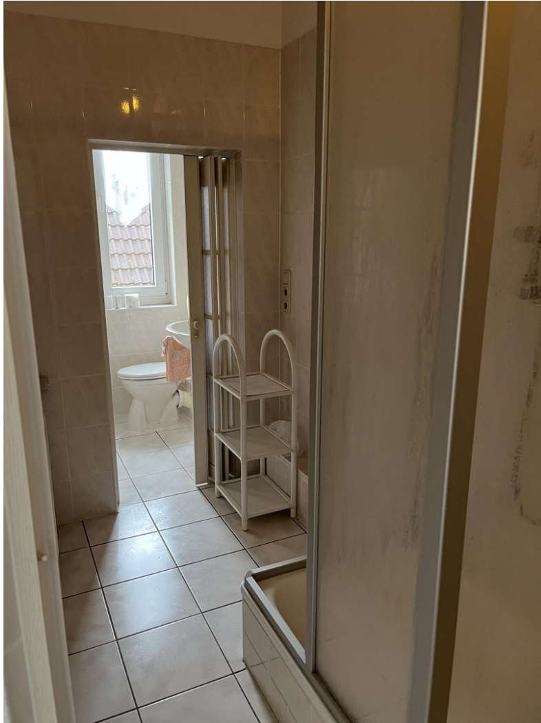
Bad mit Dusche im Obergeschoss