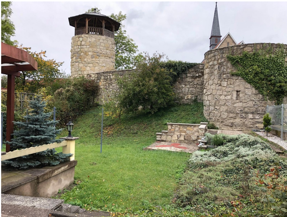
Garten + Blick auf Stadtmauer