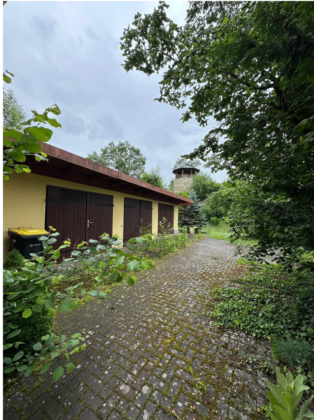
Hof mit 3 Garagen