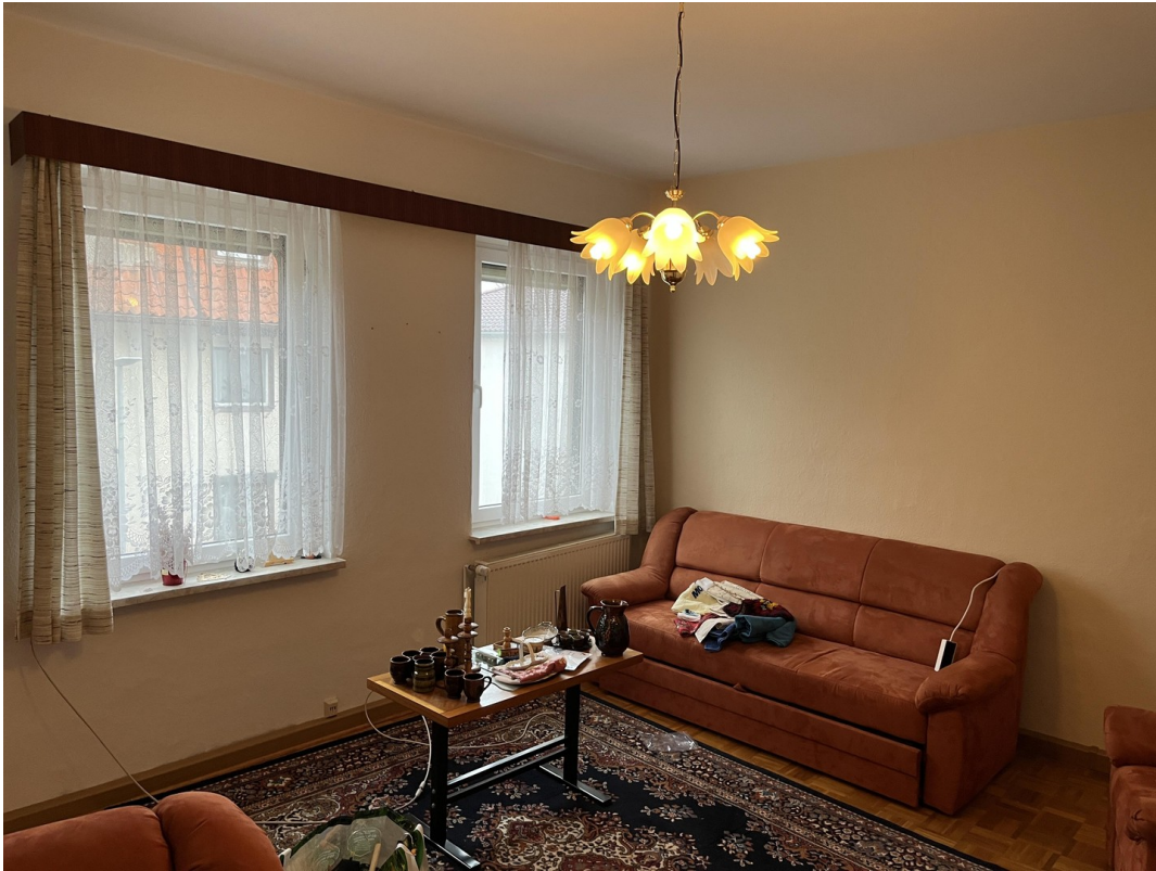
Wohnzimmer im Obergeschoss