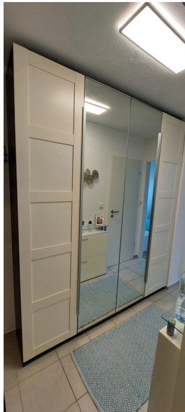
Schrank im Flur