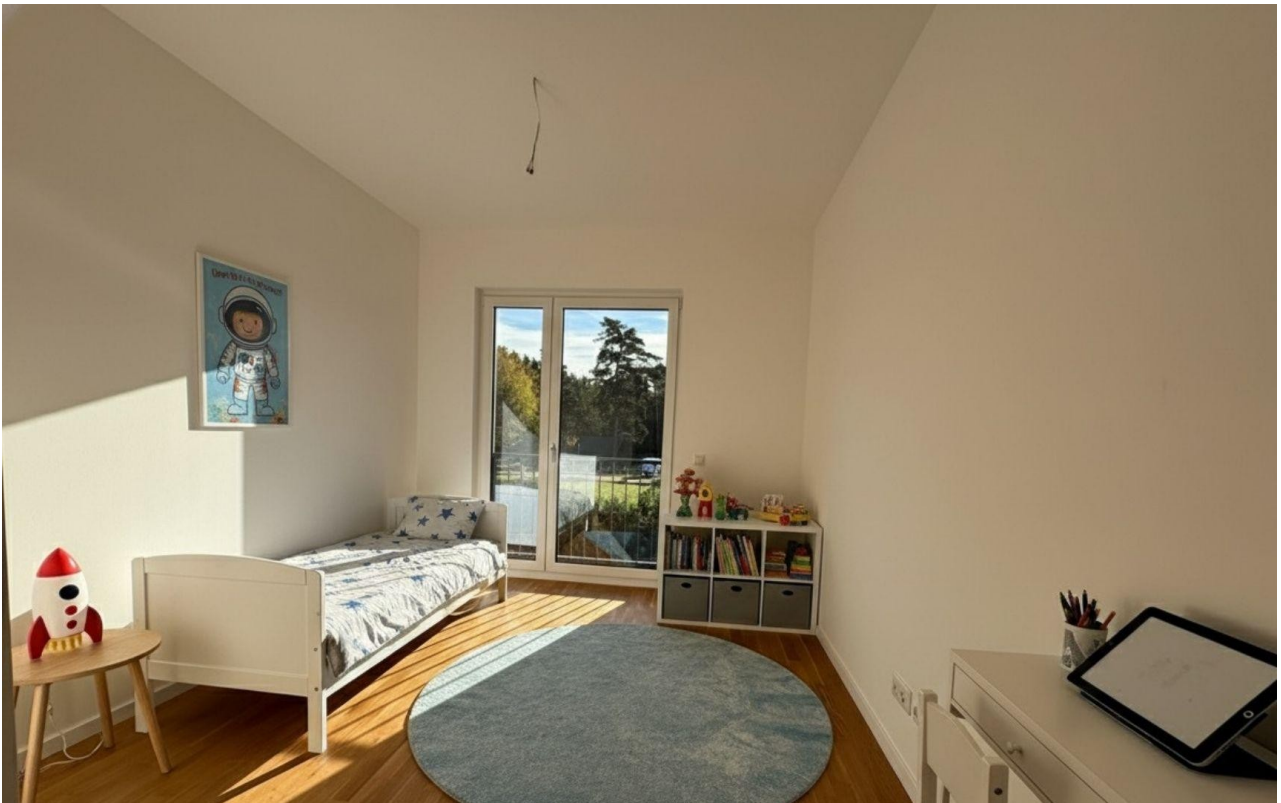
Kind 1 - Musterausstattung