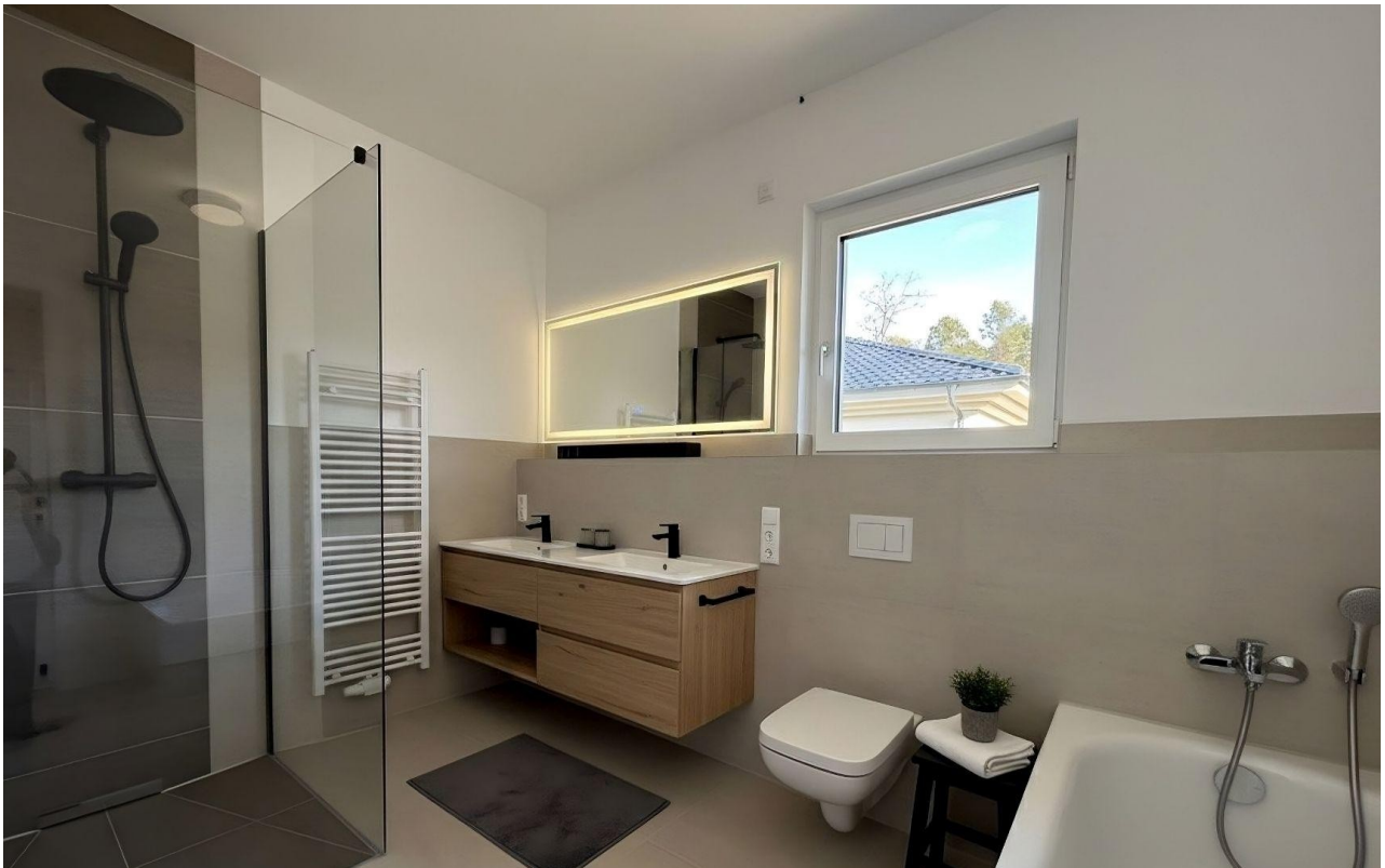
Bad - Musterausstattung