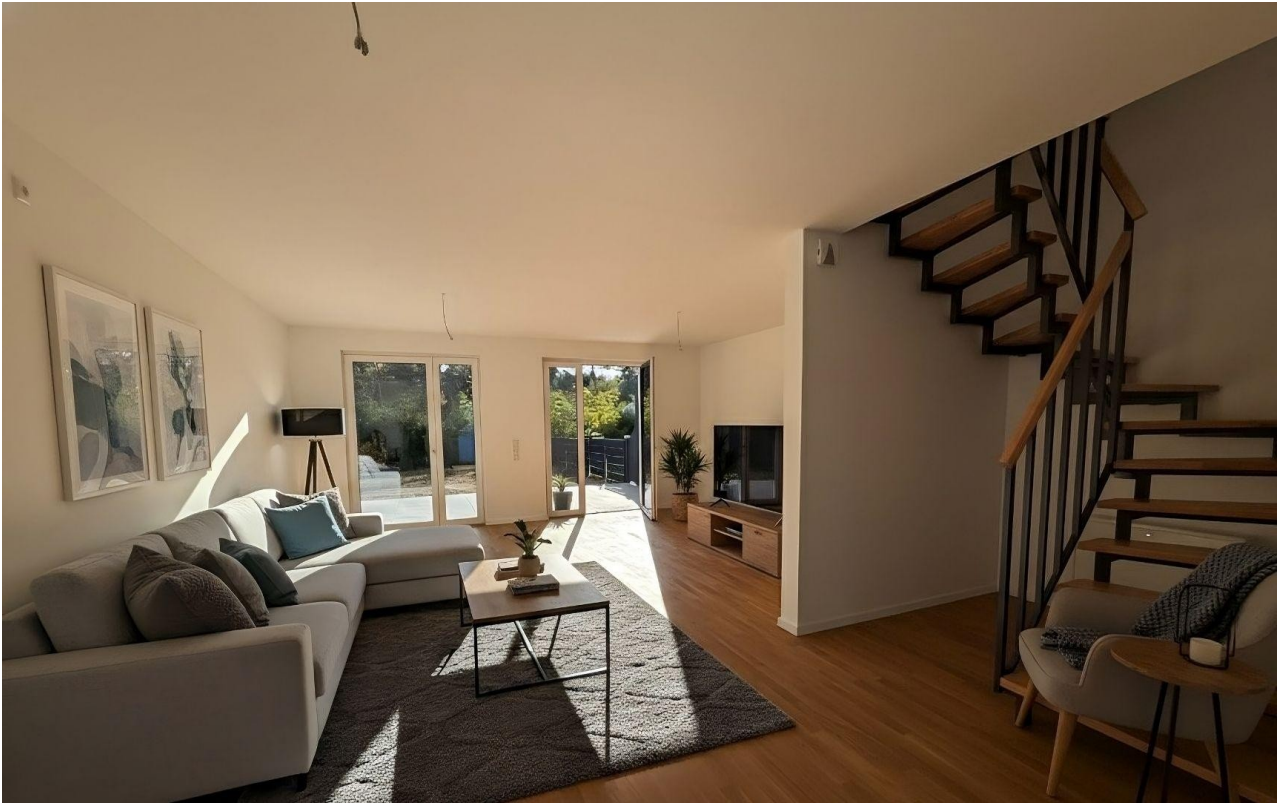
Wohnzimmer - Musterausstattung