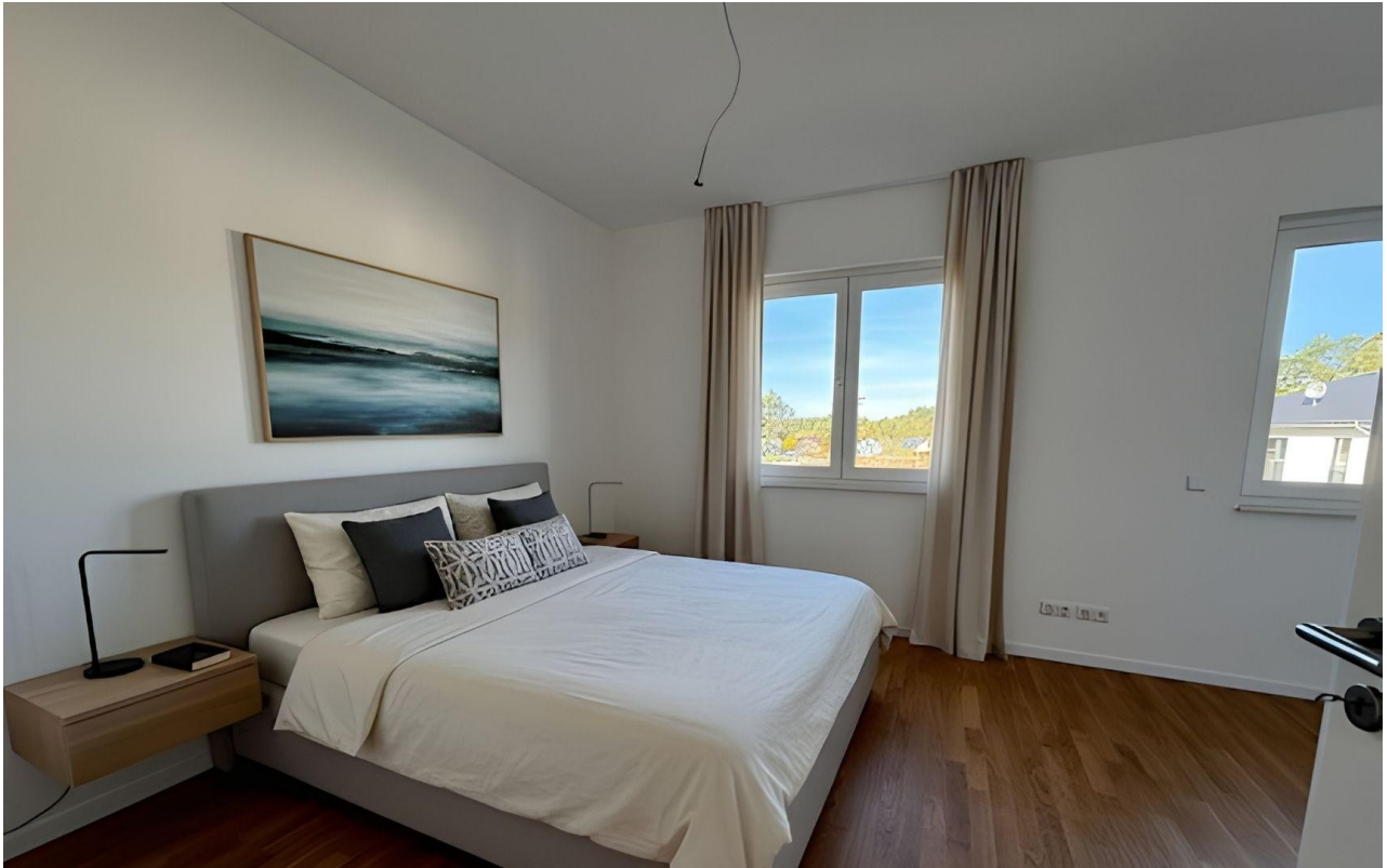
Schlafen - Musterausstattung