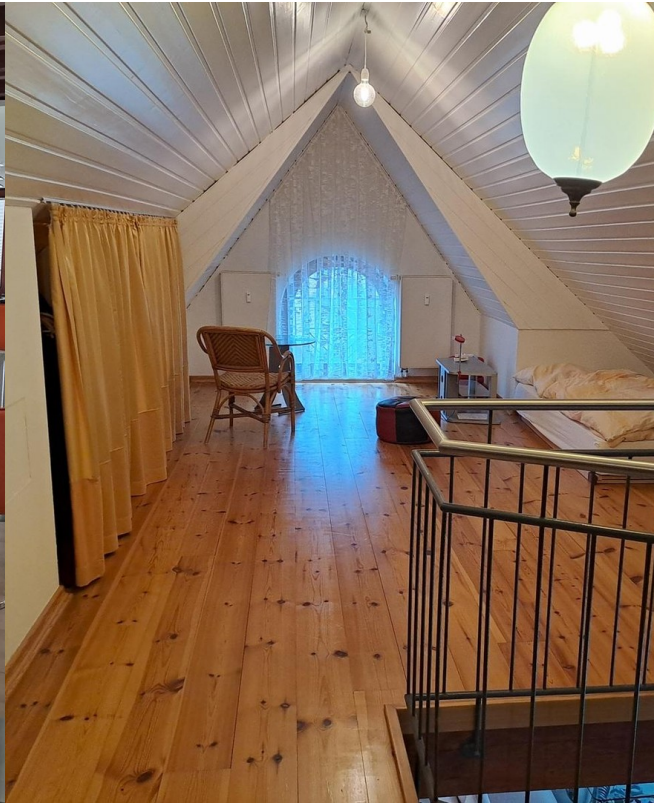
Galerie im 5.OG