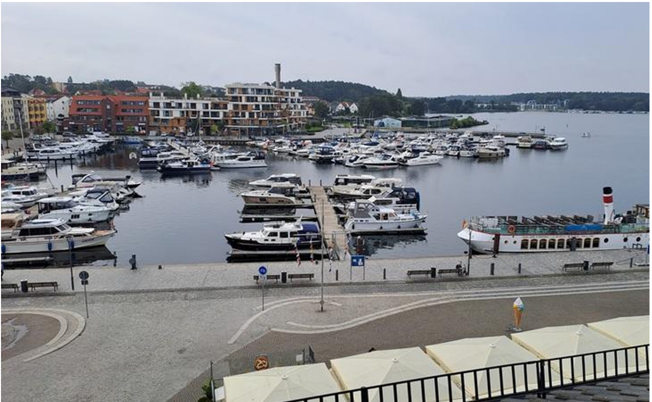
Blick nach Süden