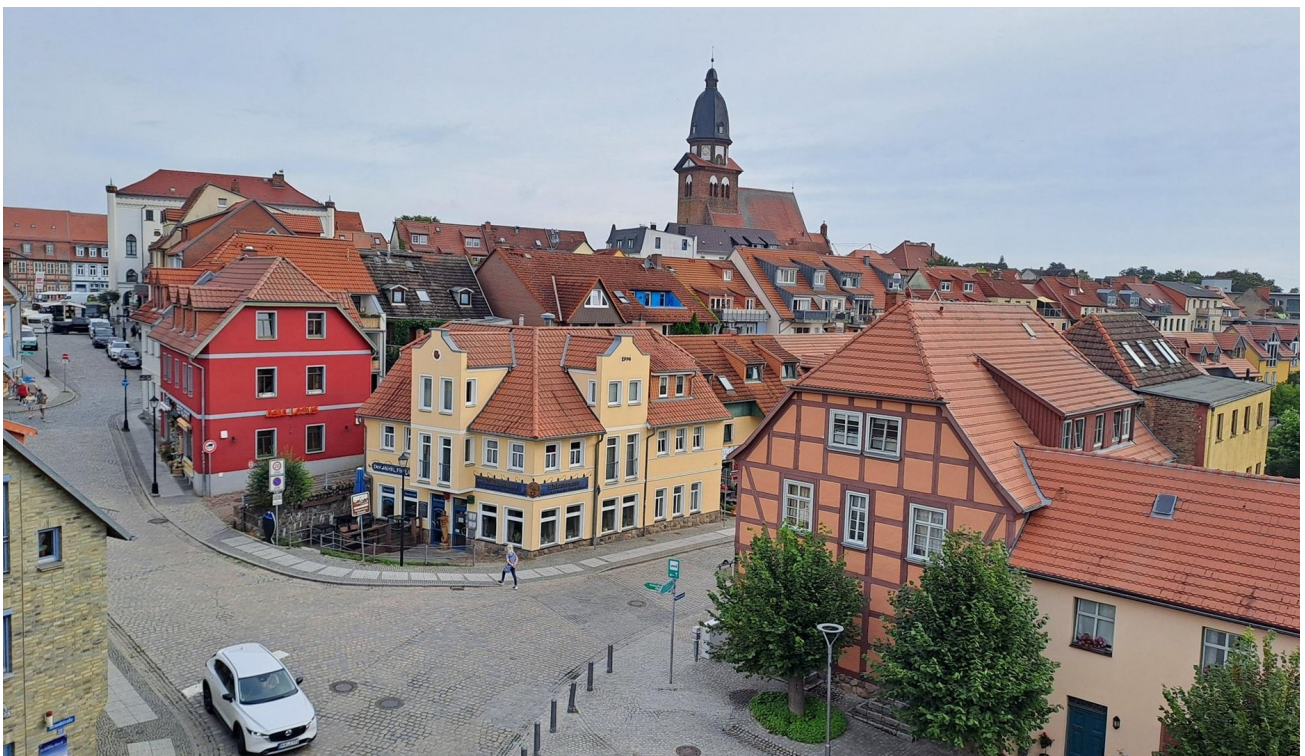
Blick nach Nordost