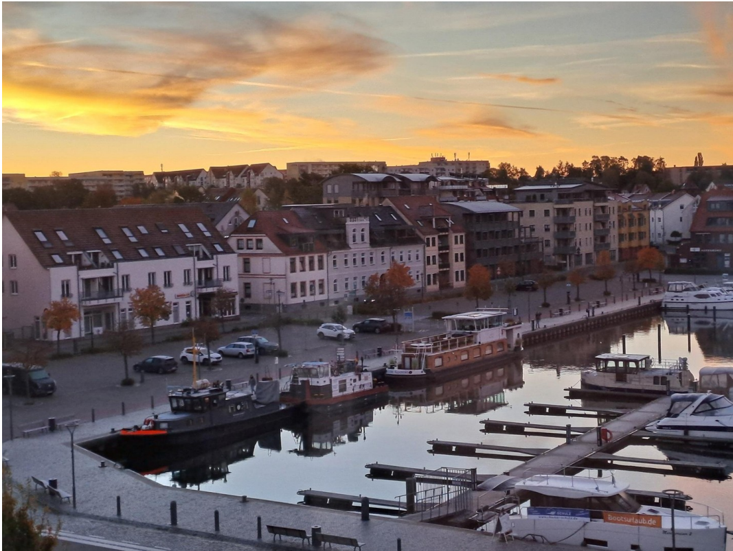
Blick nach Südost