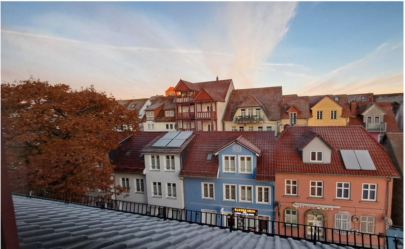
Blick nach Nordwest