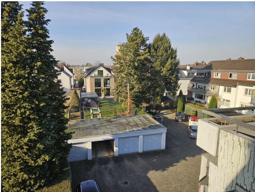
Blick zum Hof