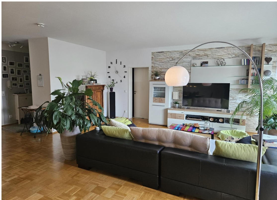
Wohnzimmer mit Möbeln