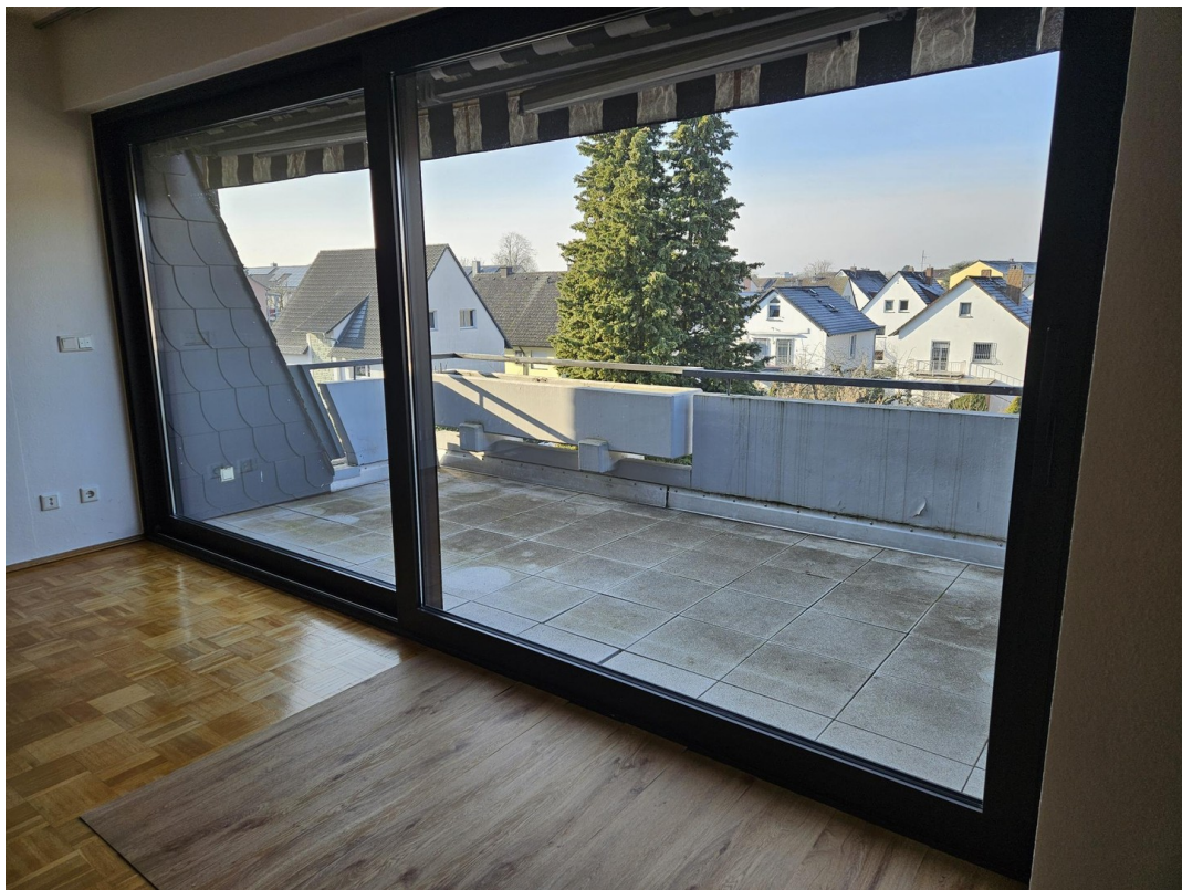
neuer Boden wird verlegt