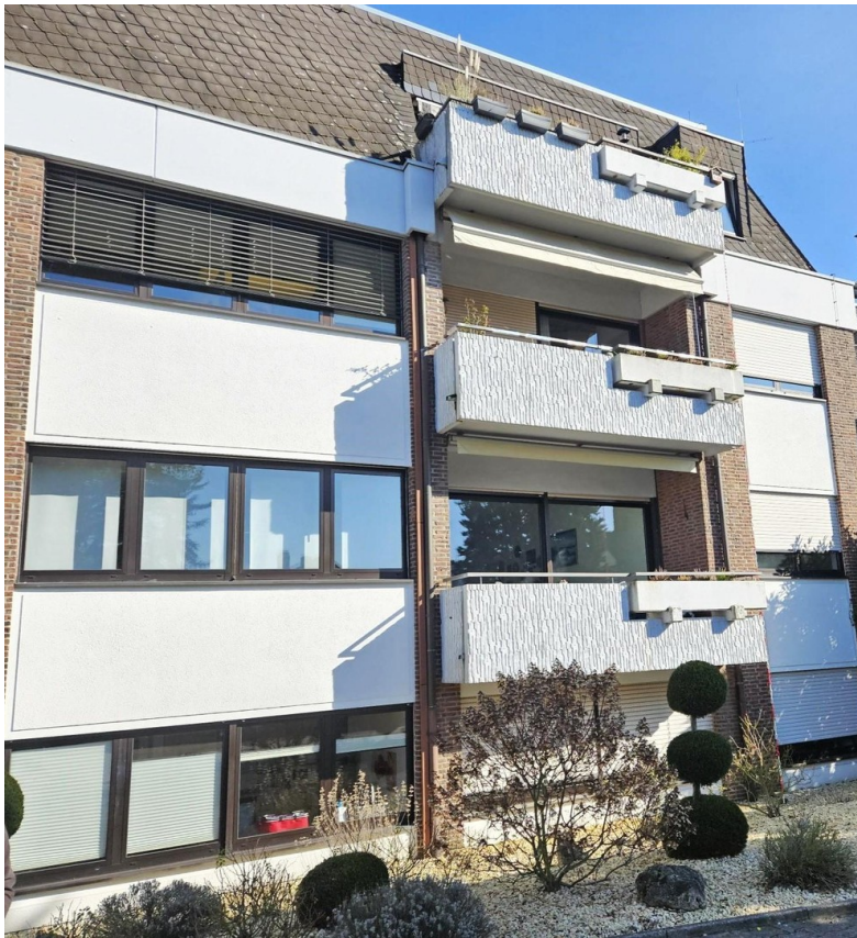
Hausrückseite mit Balkon