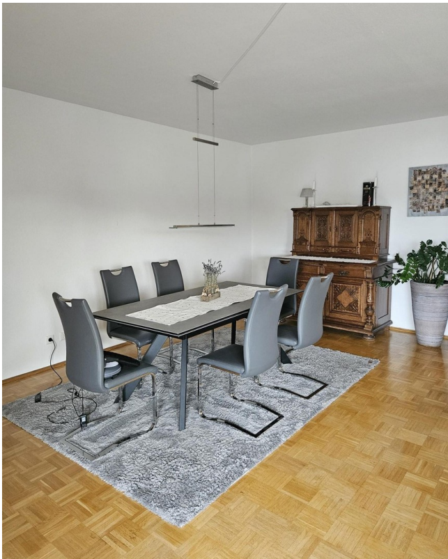
Essbereich im Wohnzimmer