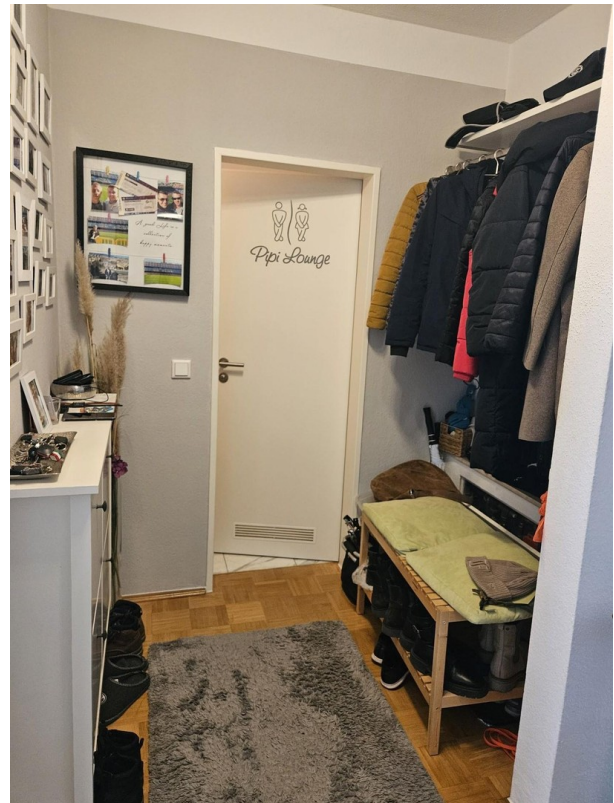
Eingangsbereich mit Gäste WC