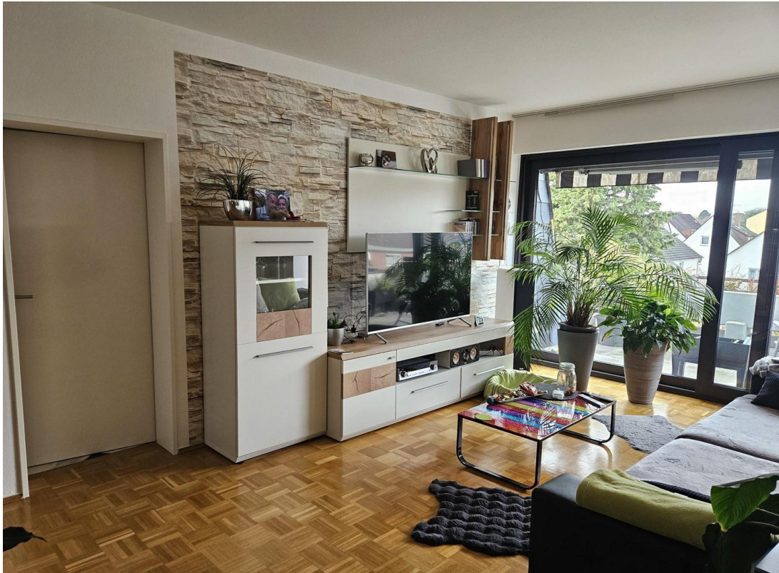
Wohnzimmer mit Möbeln