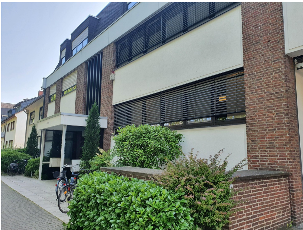
Hausfront mit Eingangsbereich