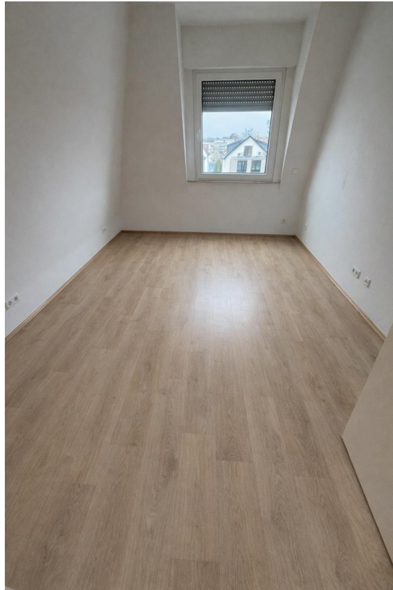
3. Zimmer mit neuem Boden KI