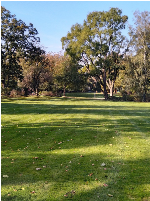
Park in unmittelbarer Umgebung