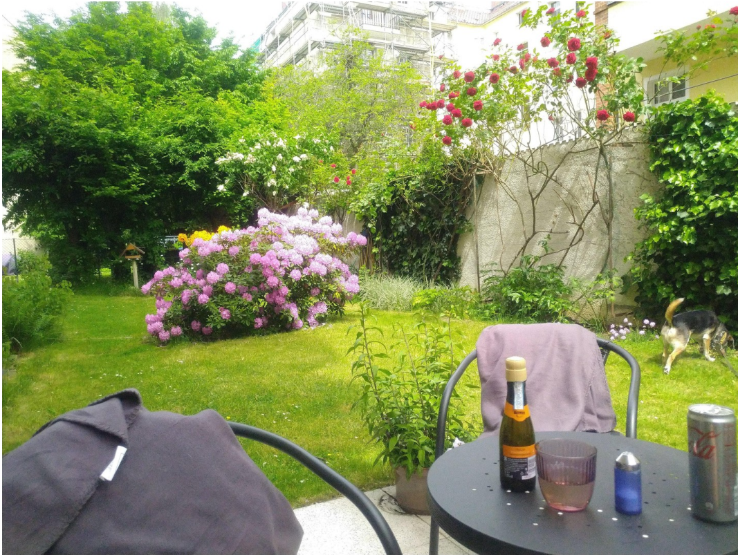
Garten mit Begrünung