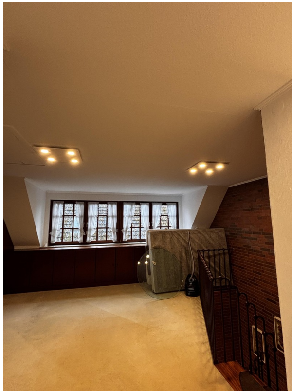
Offener Raum OG