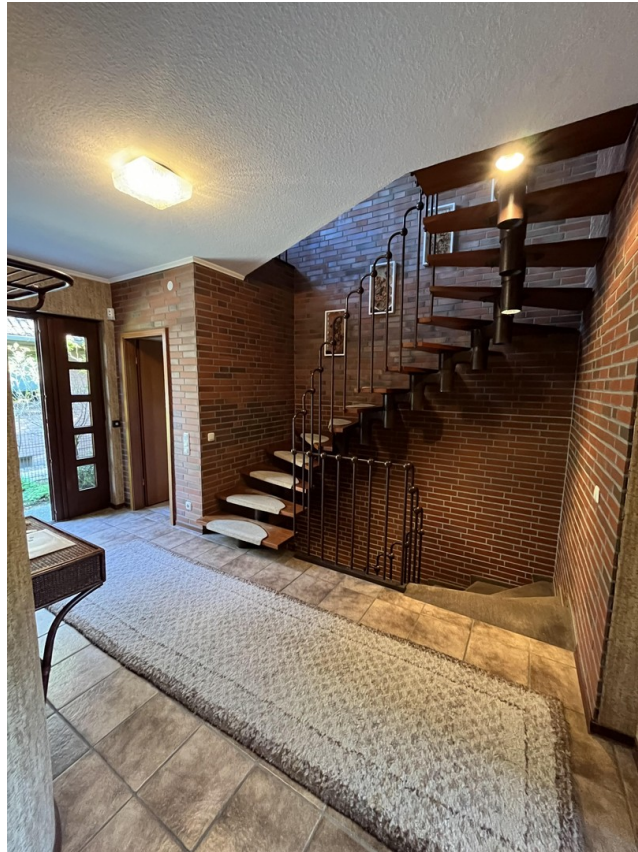
Flur + Treppe