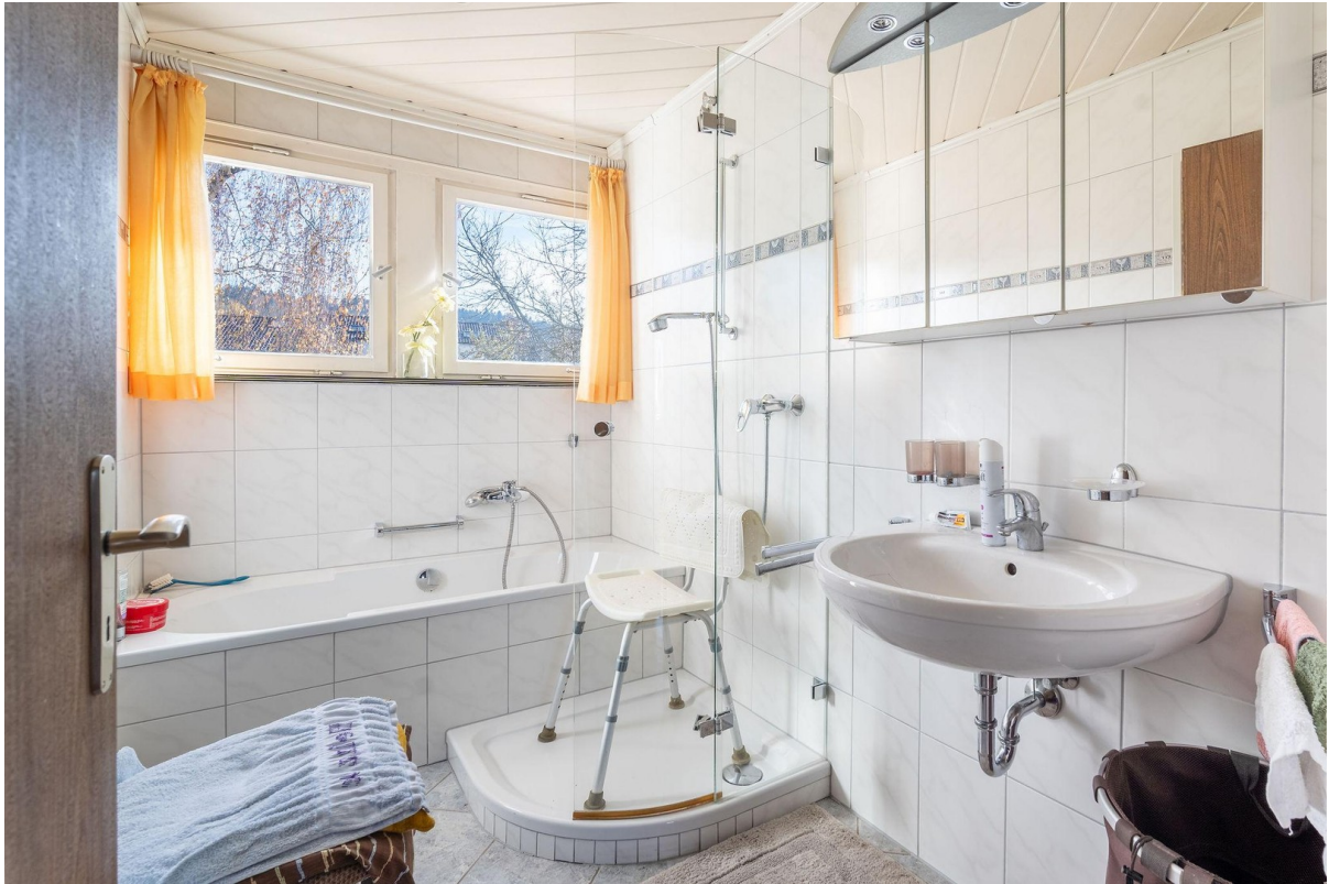
1. OG Bad