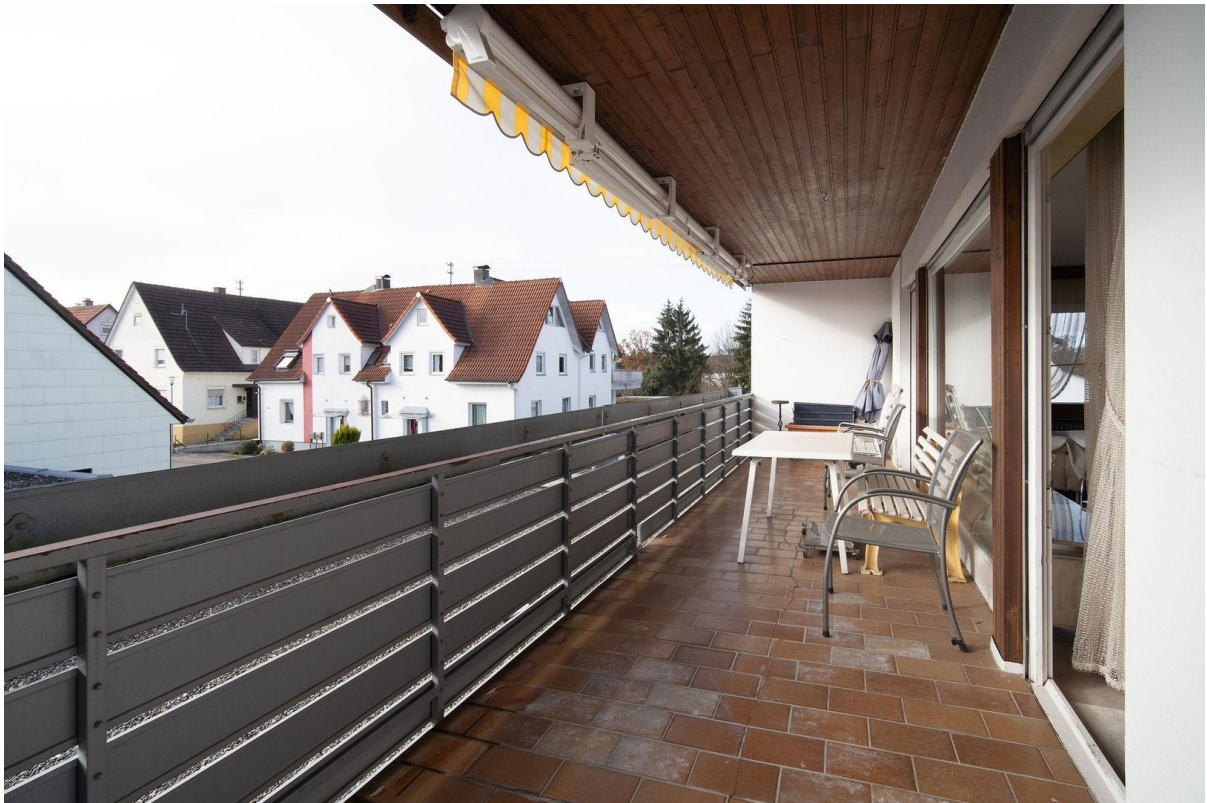
1. OG Loggia