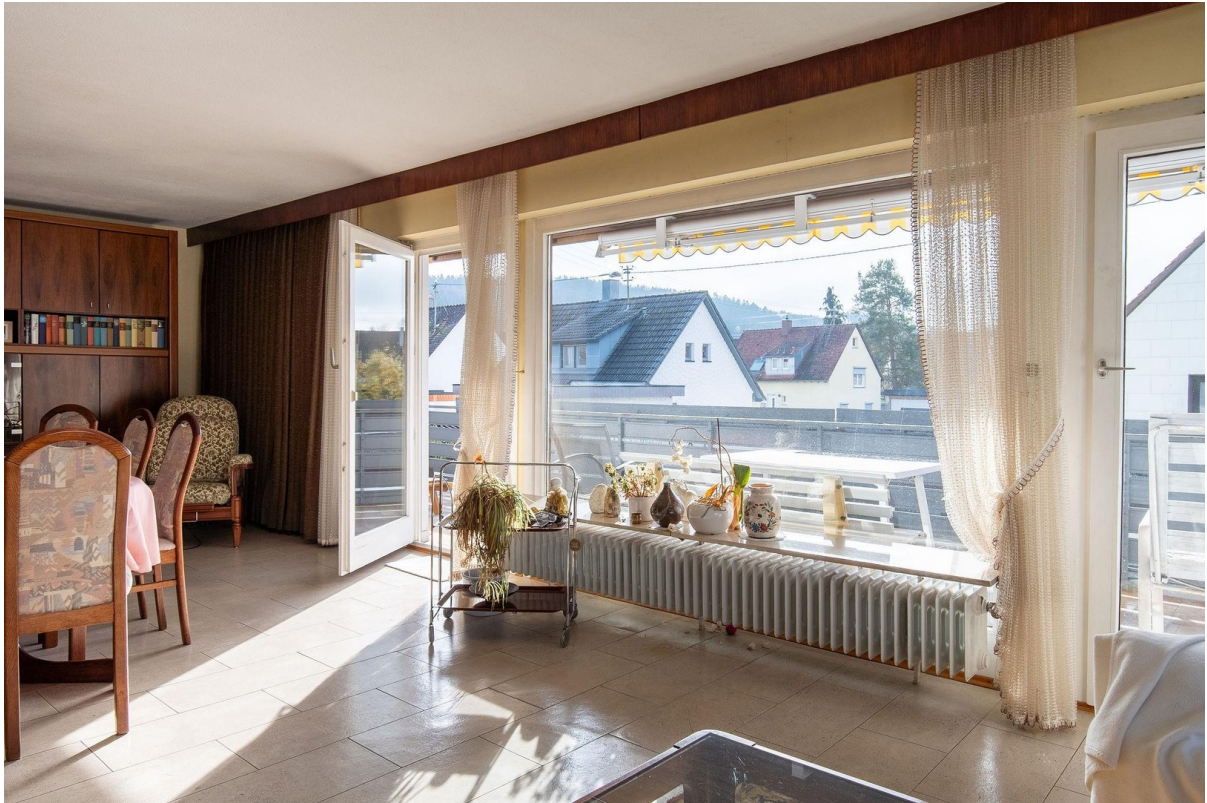
1. OG Wohnzimmer