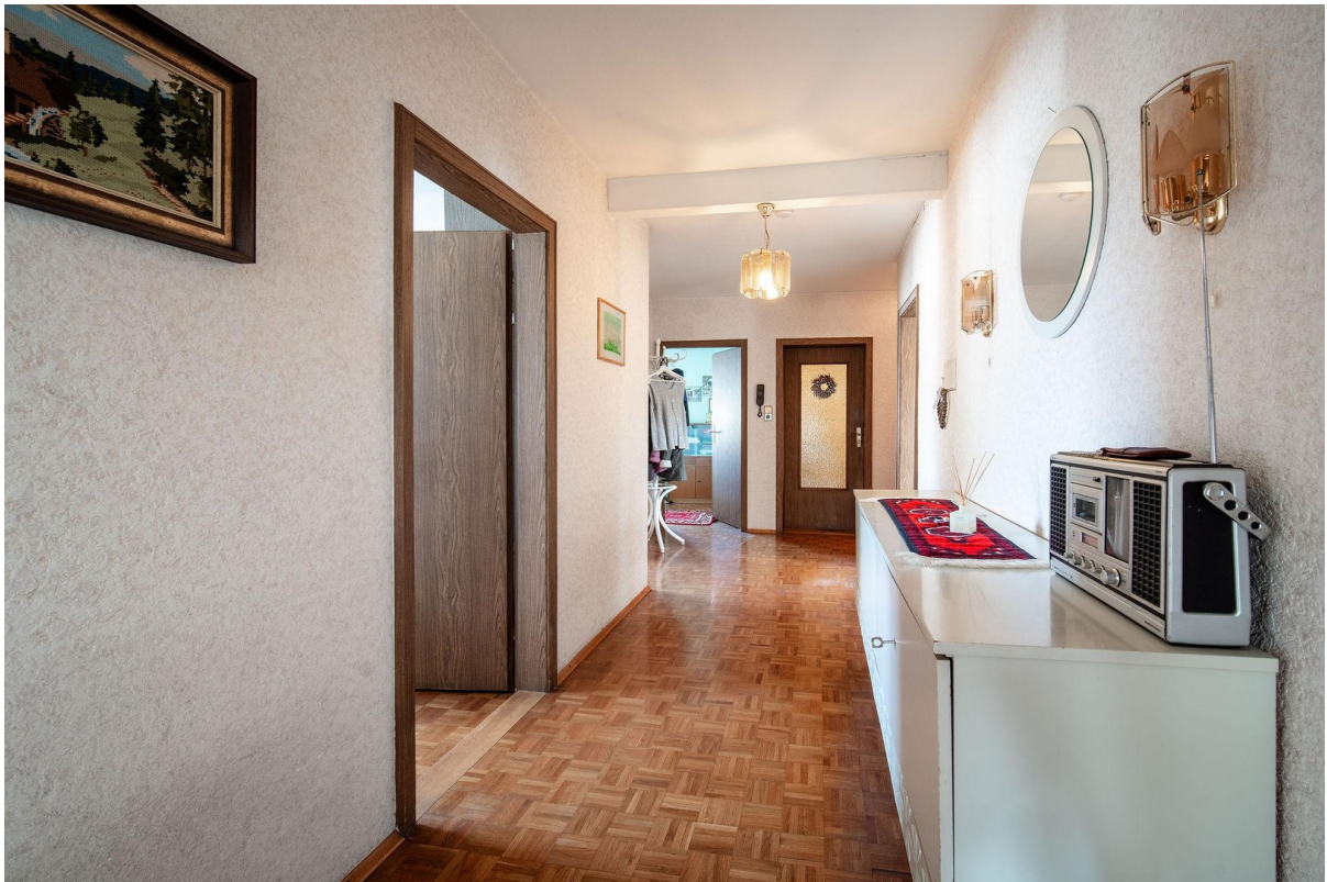
1. OG Flur