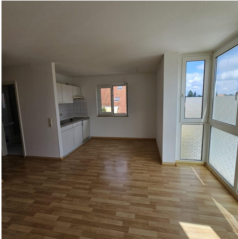
Küche im Wohn-und Schlafzimmer