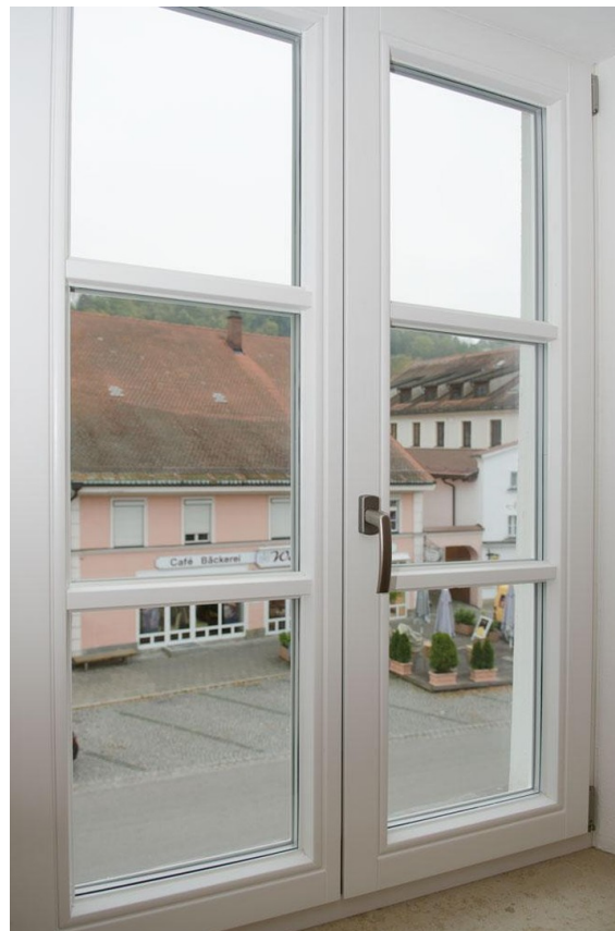
Blick auf den Stadtplatz