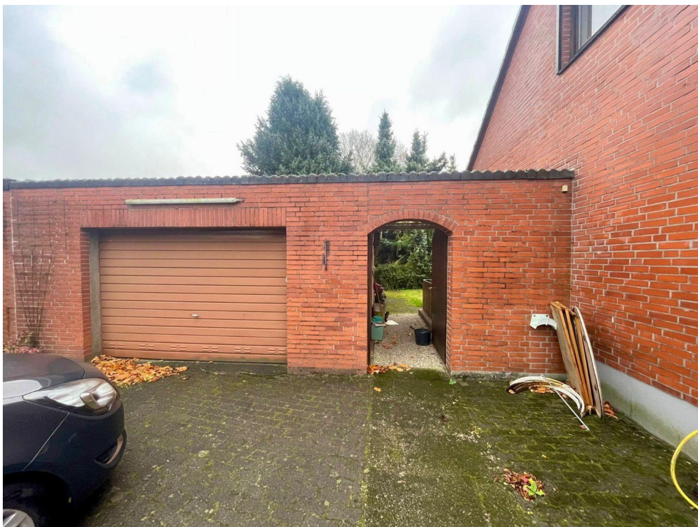
Garage und durchgang Garten