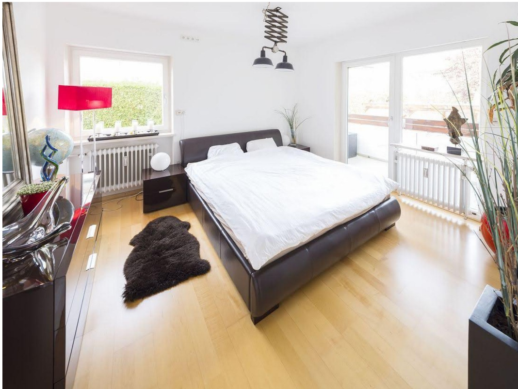
Schlafzimmer mit Ost-Terrasse