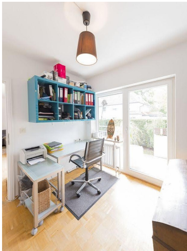
Kind / Büro mit Süd-Terrasse