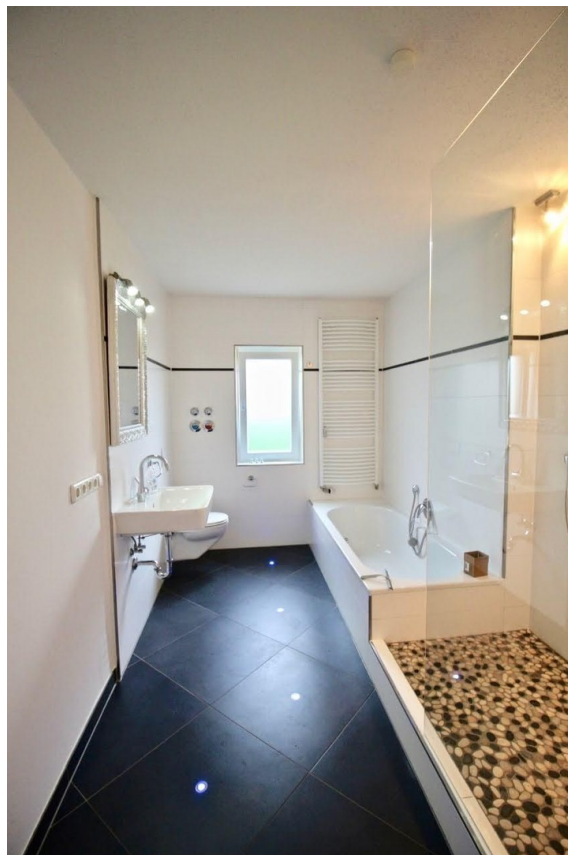
Badewanne und Dusche