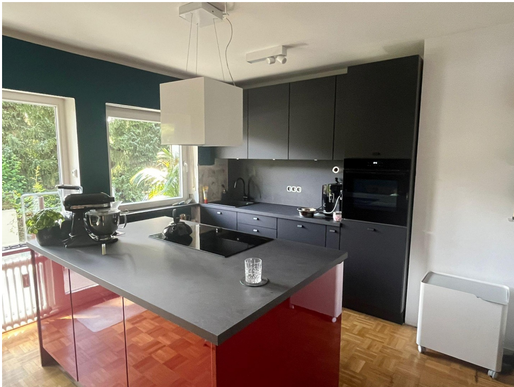
Offene Wohnküche 2024