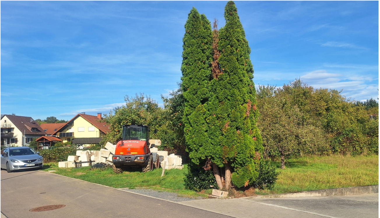
Bagger auf Grundstück