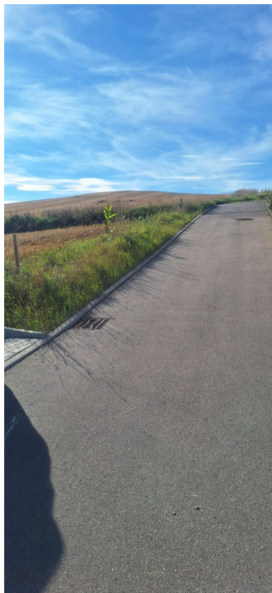
Blick von Bölich in Felder