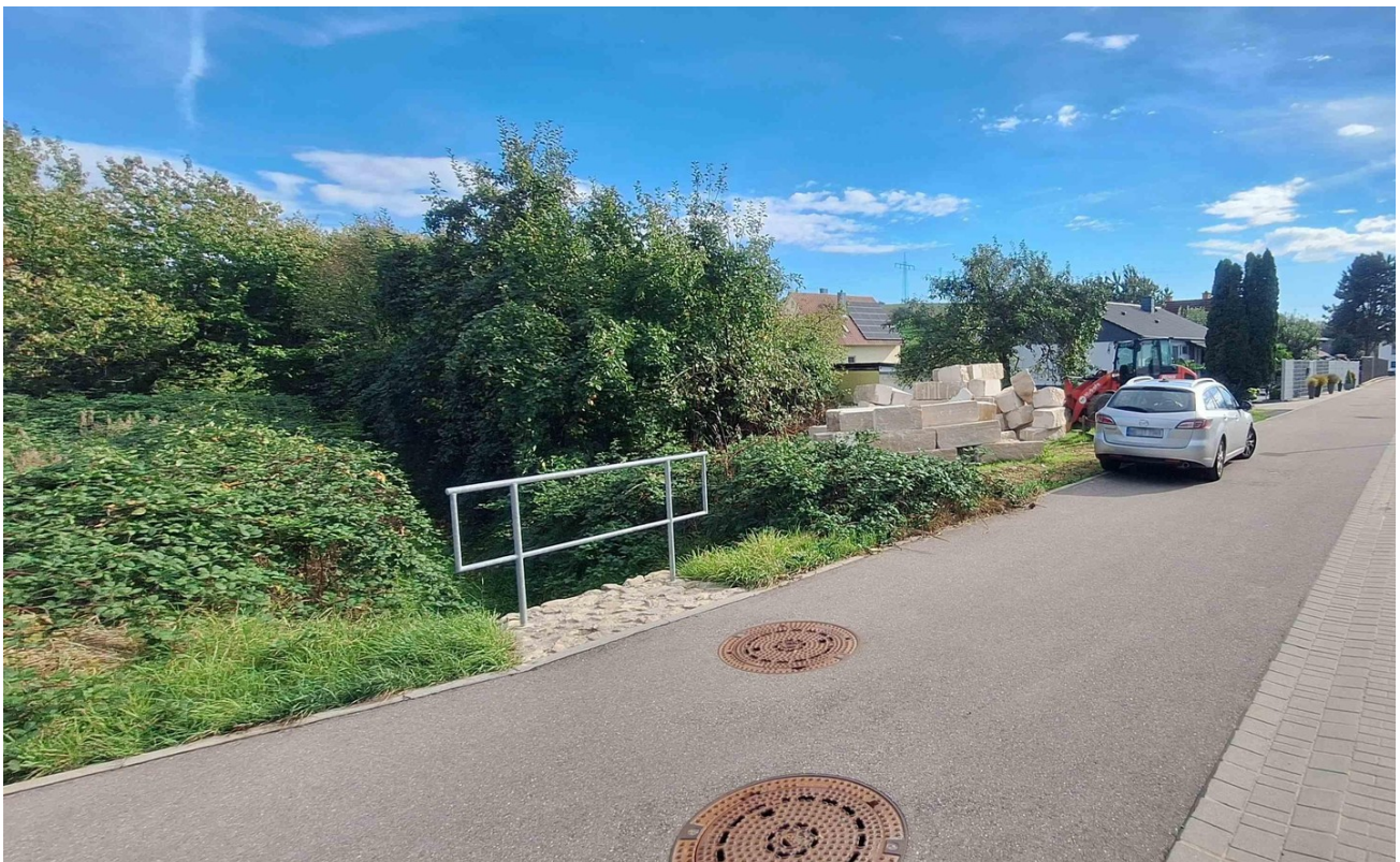
Grundstück bei den Steinen