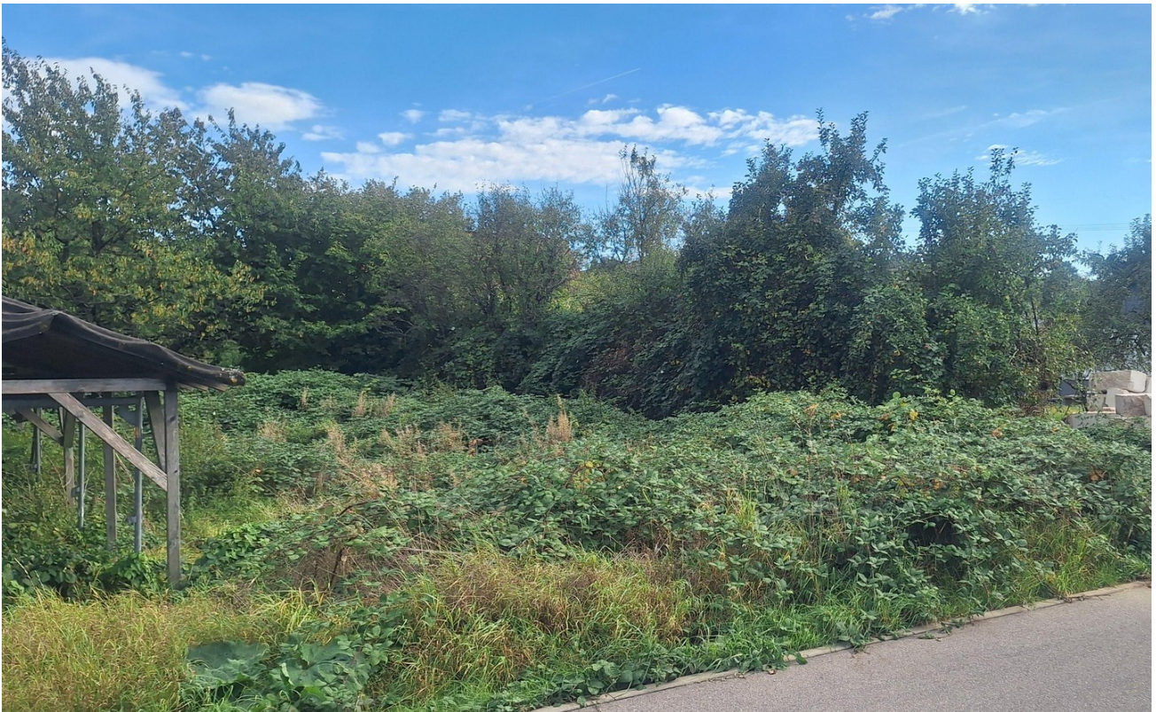
Grundstück mit Bäumen