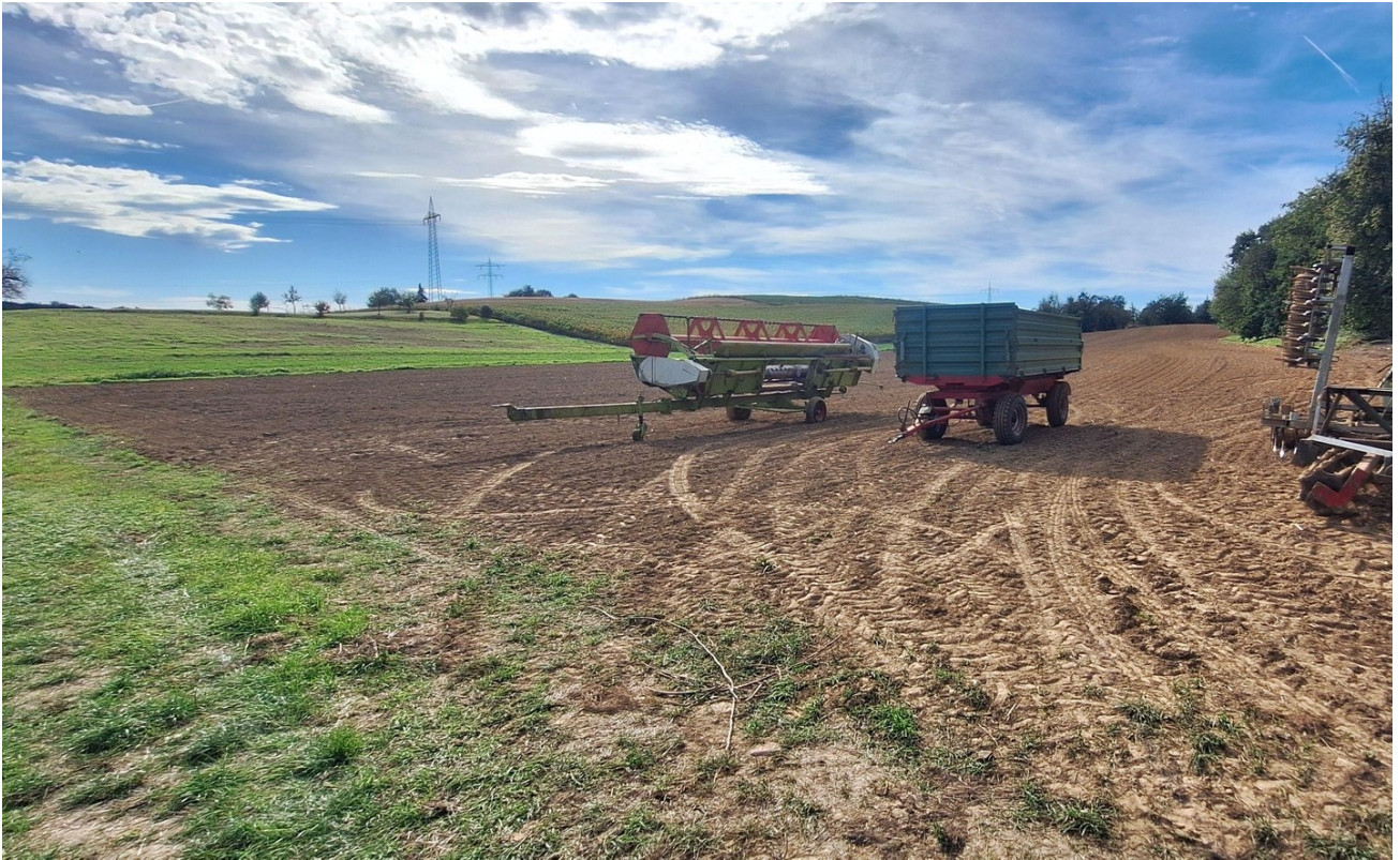
Felder in 40 m Luftlinie