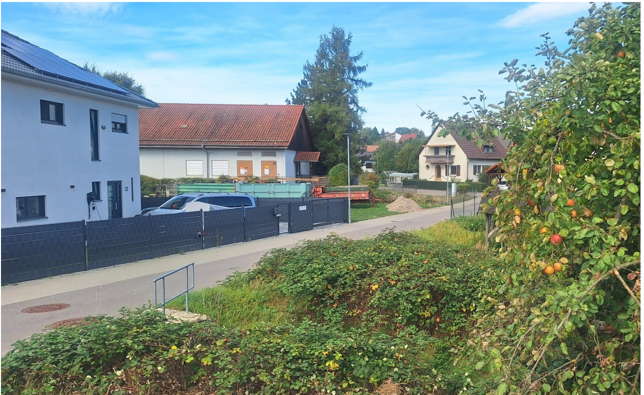
Vom Grundstück in Straße