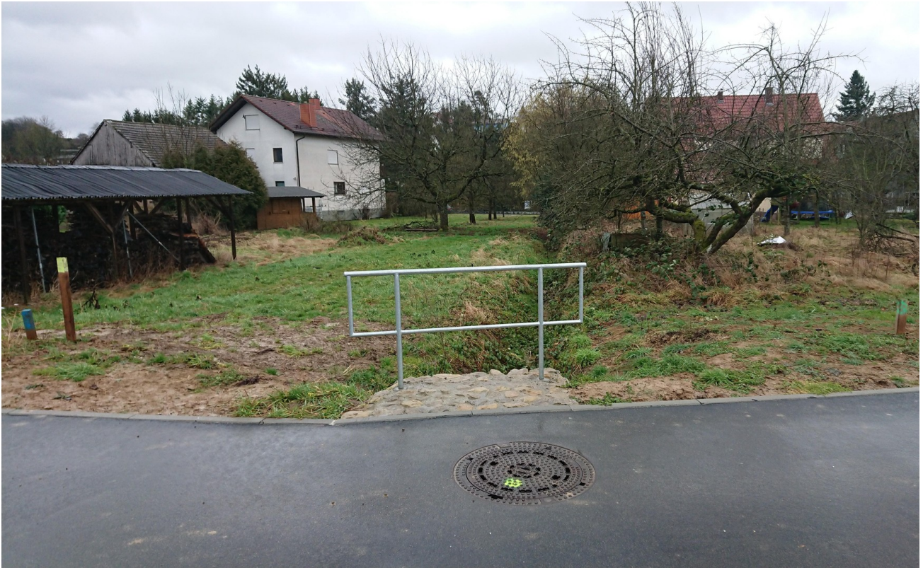
Grundstück liegt rechts