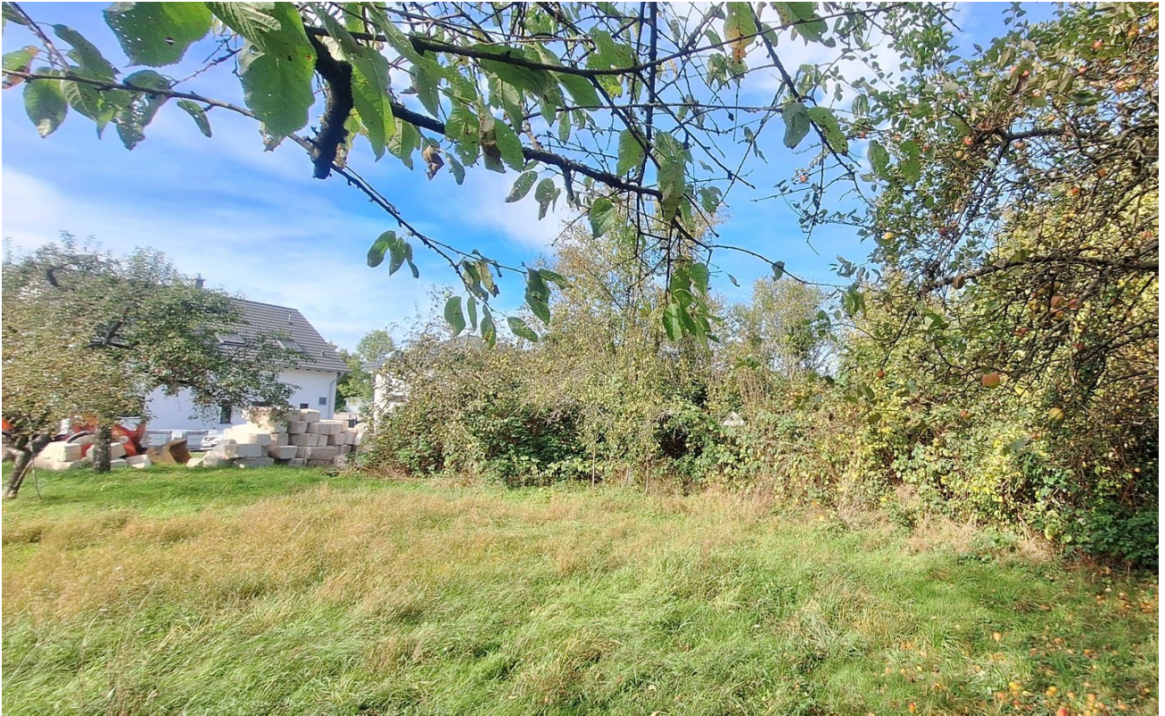
Im Sommer mit Bewuchs