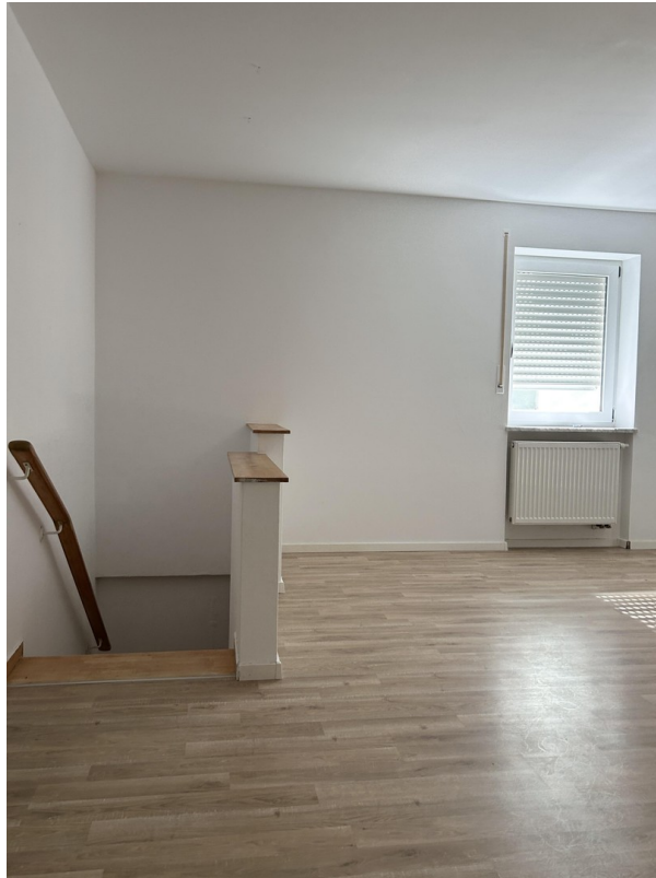
Kellerzugang vom Wohnz.