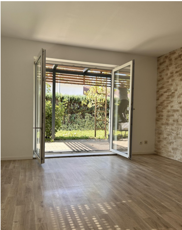
Wohnzimmer mit Gartenblick