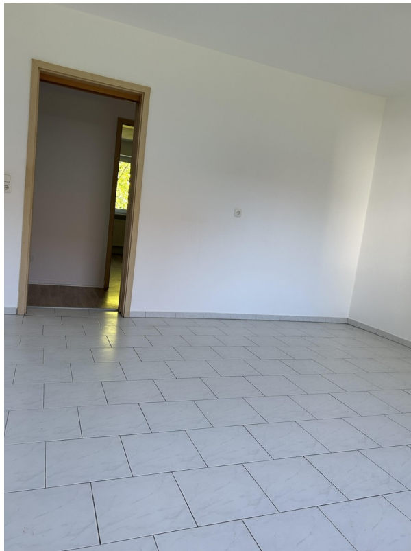
Küche mit Schiebetür