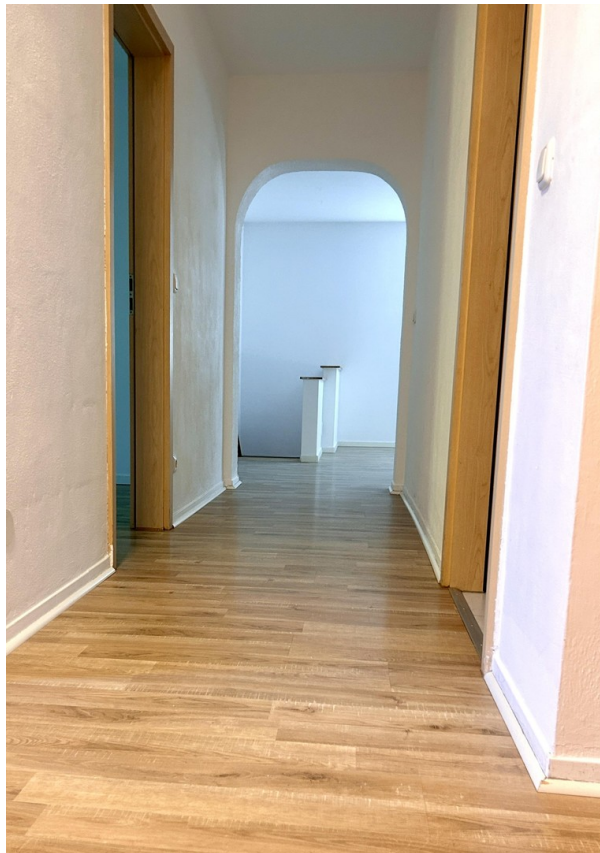
Gang zum Wohnzimmer