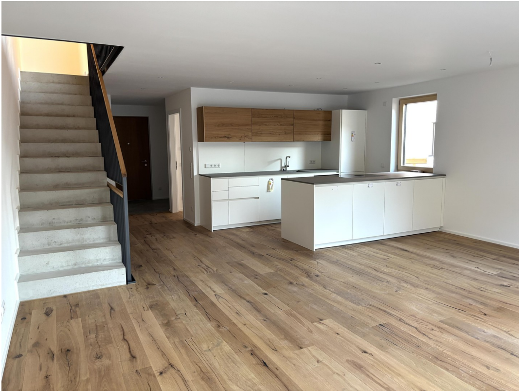
Wohnen und Kochen