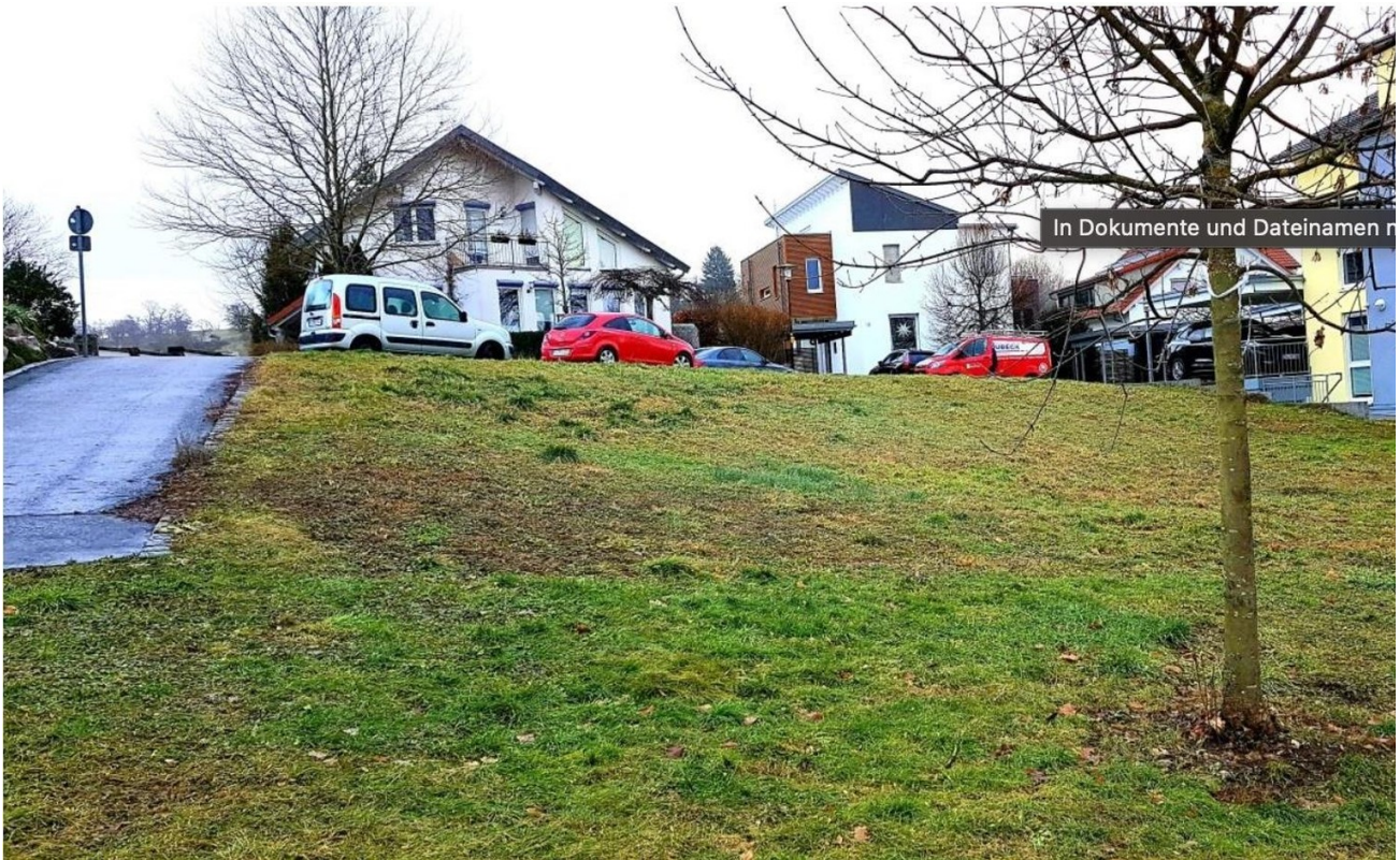
Grundstück Dettenhausen Bild 2