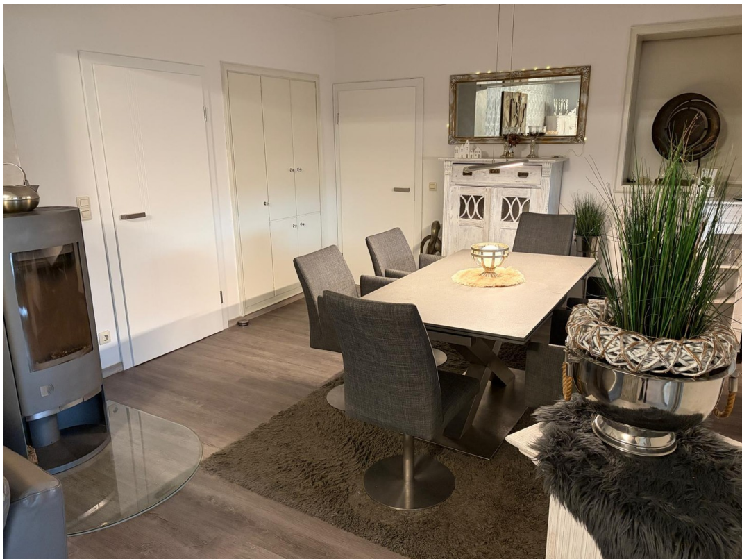
Wohn- & Esszimmer Bild 2