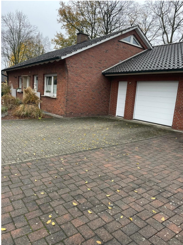
Garage mit Stellplatz