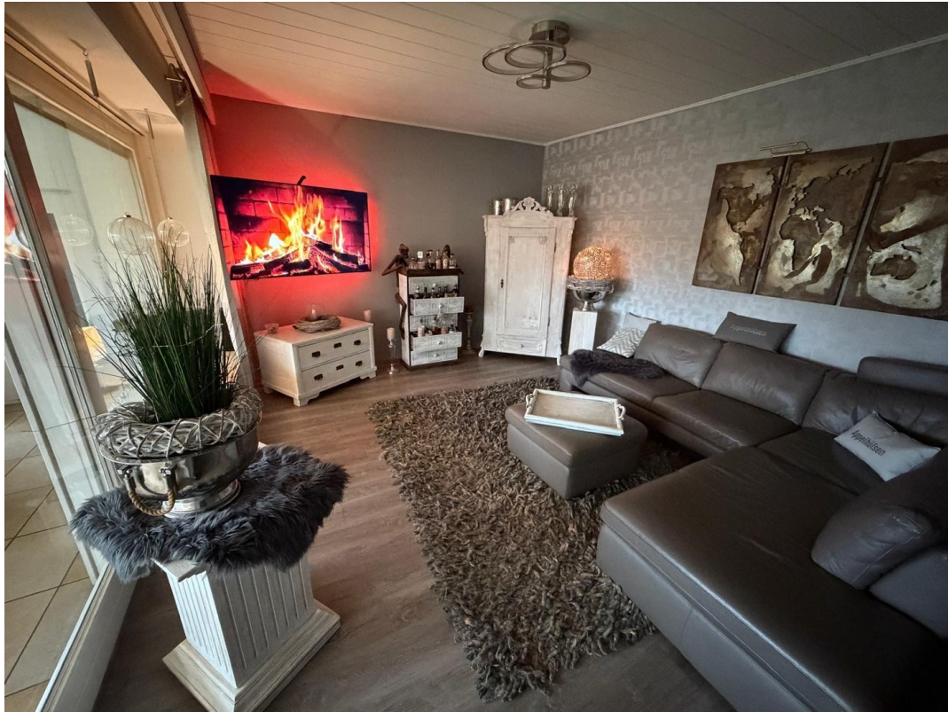
Wohn- & Esszimmer Bild 1