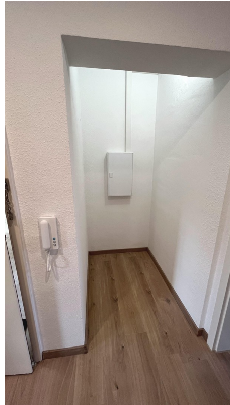
Flur / Abstellnische