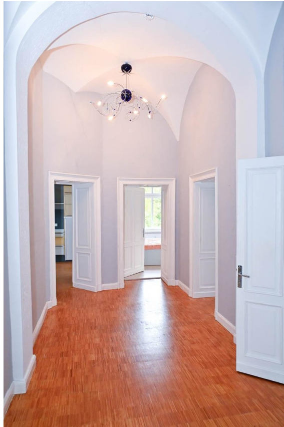
Flur mit Spitzbögen