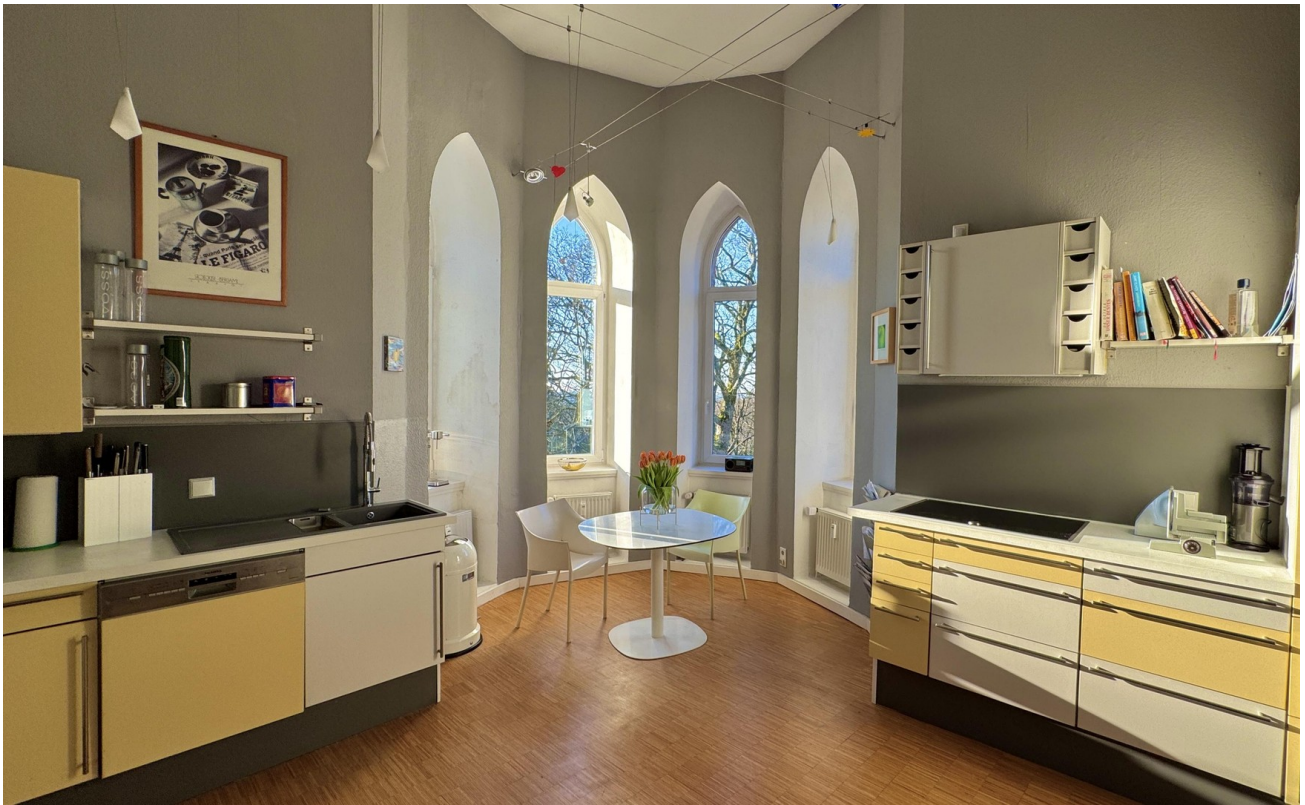
Küche mit Erker