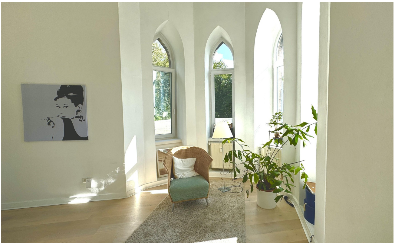
Zimmer mit Erker