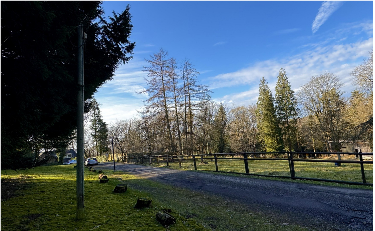
Privatweg Zum Haus