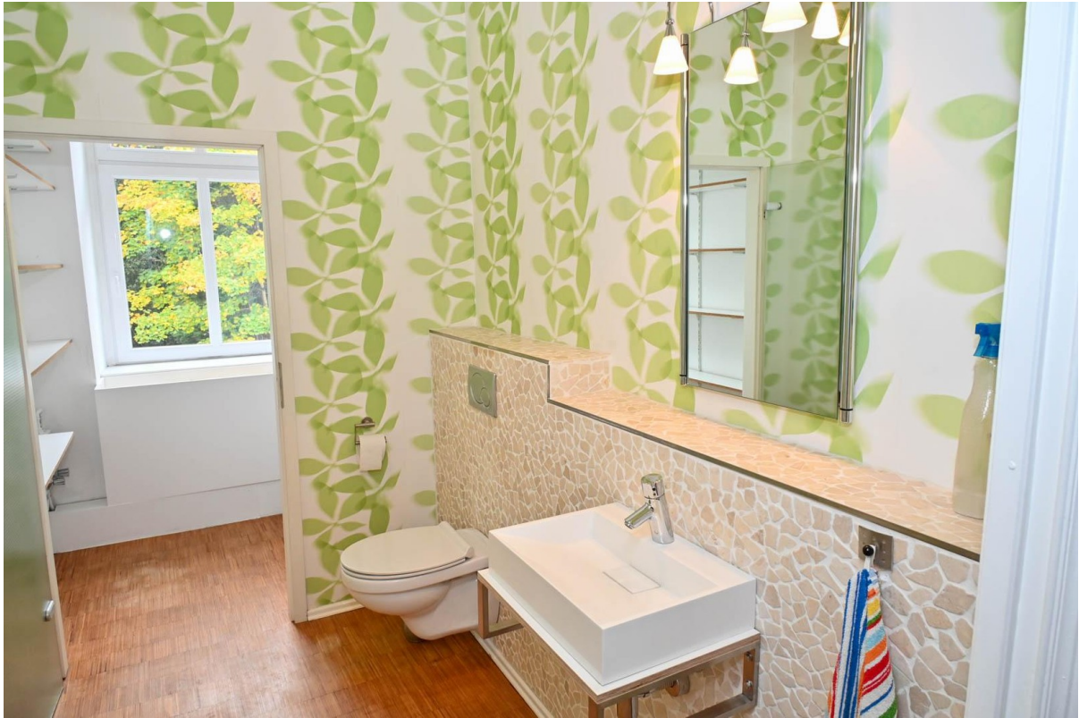
Gäste WC mit anschließendem Ha