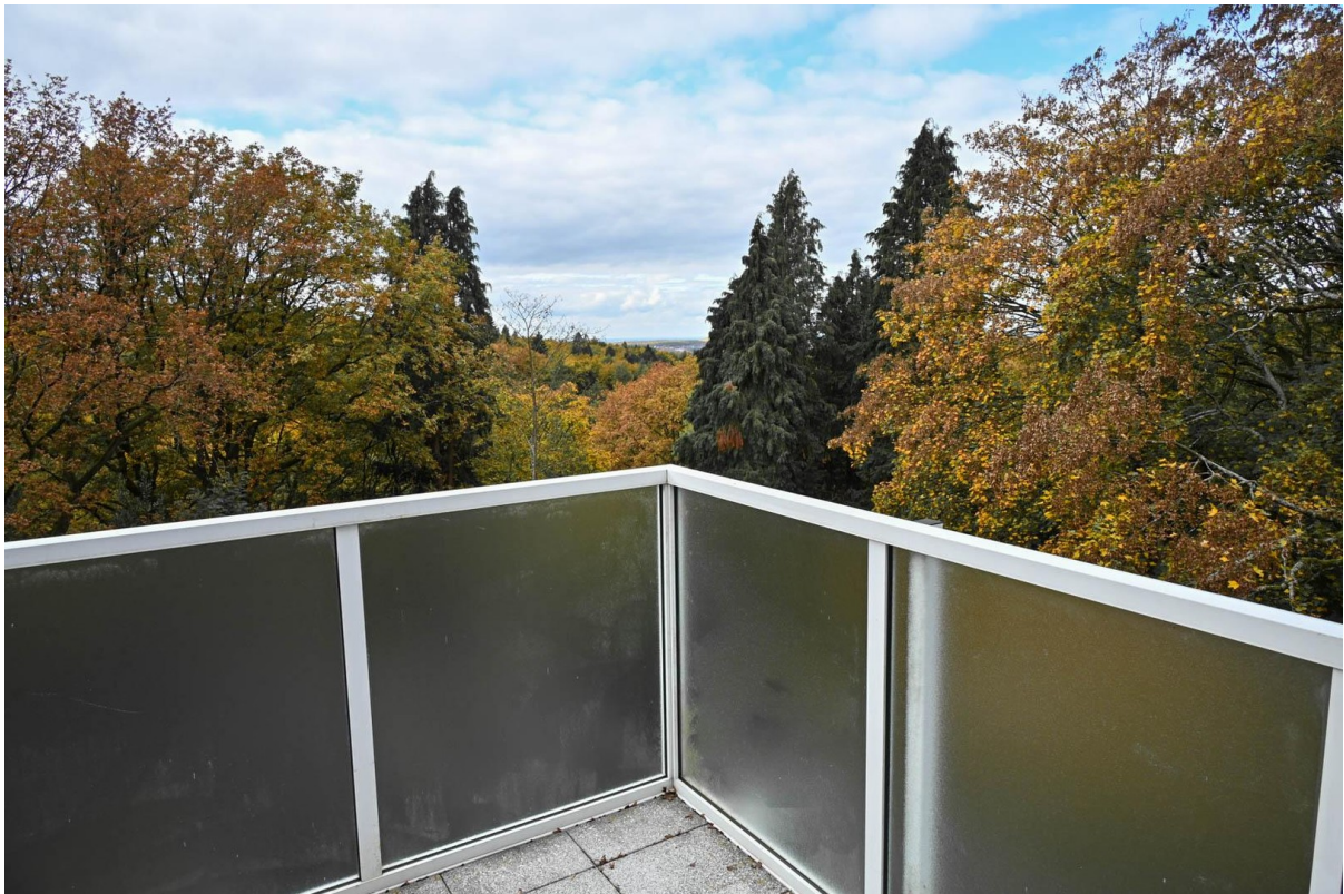
Blick vom Balkon ins Grüne