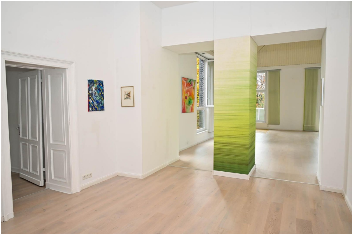
Vorhalle zum Wohnraum