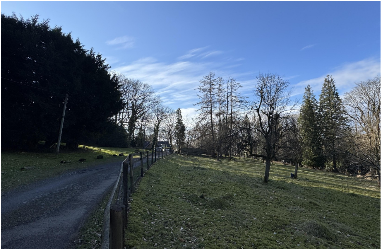
Privatweg zum Haus