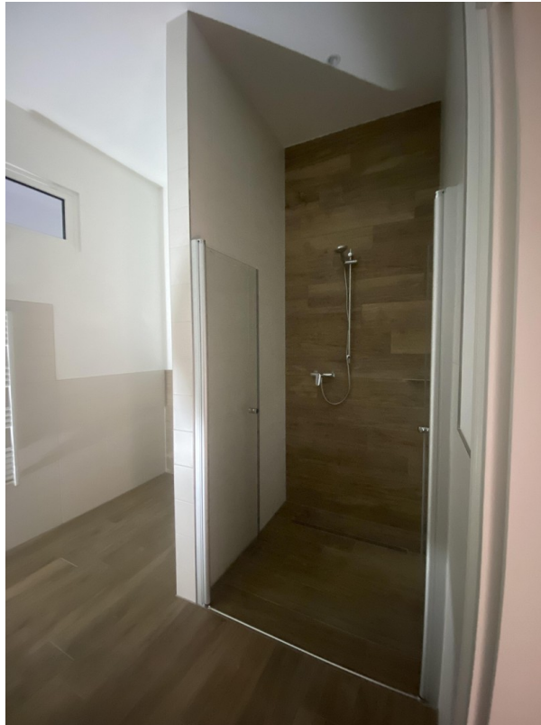
Bad mit ebenerdiger Dusche