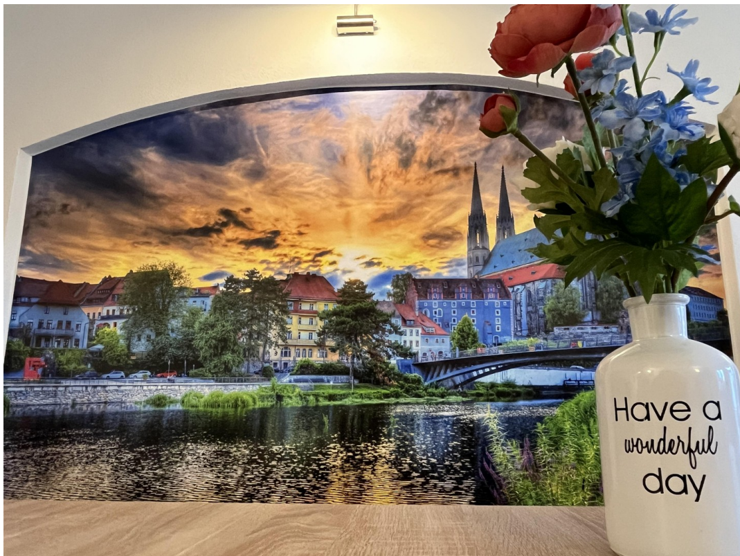
Herzlich Willkommen in Görlitz