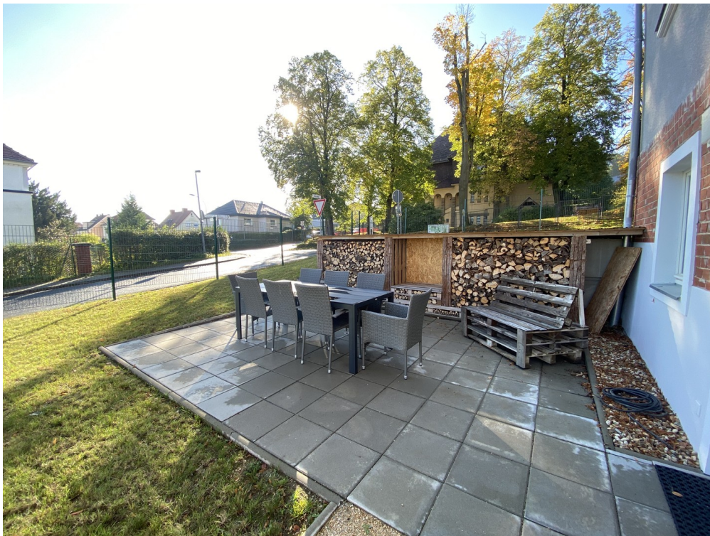
Außenterrasse zum Partykeller