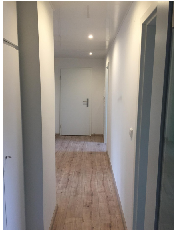
Flur mit Eingangstür