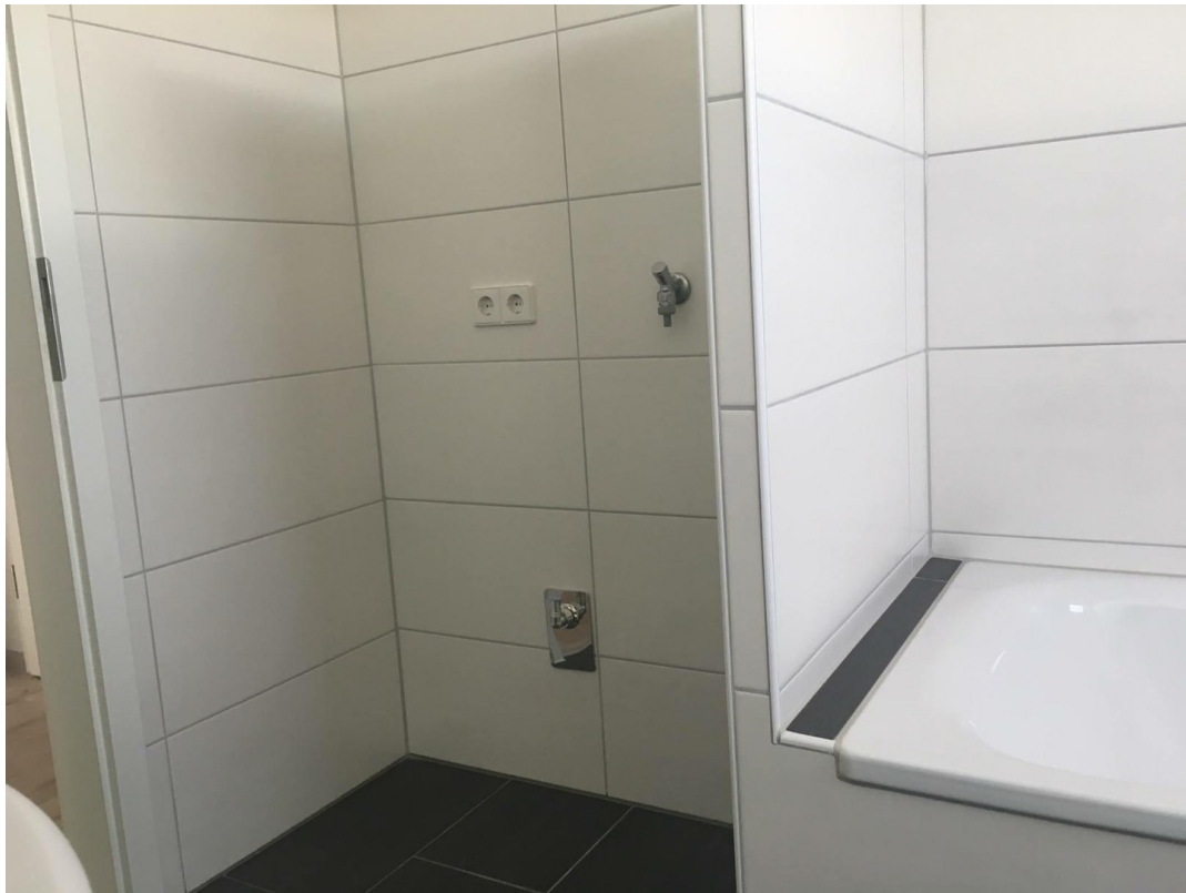
Bad, Platz für Waschmaschine