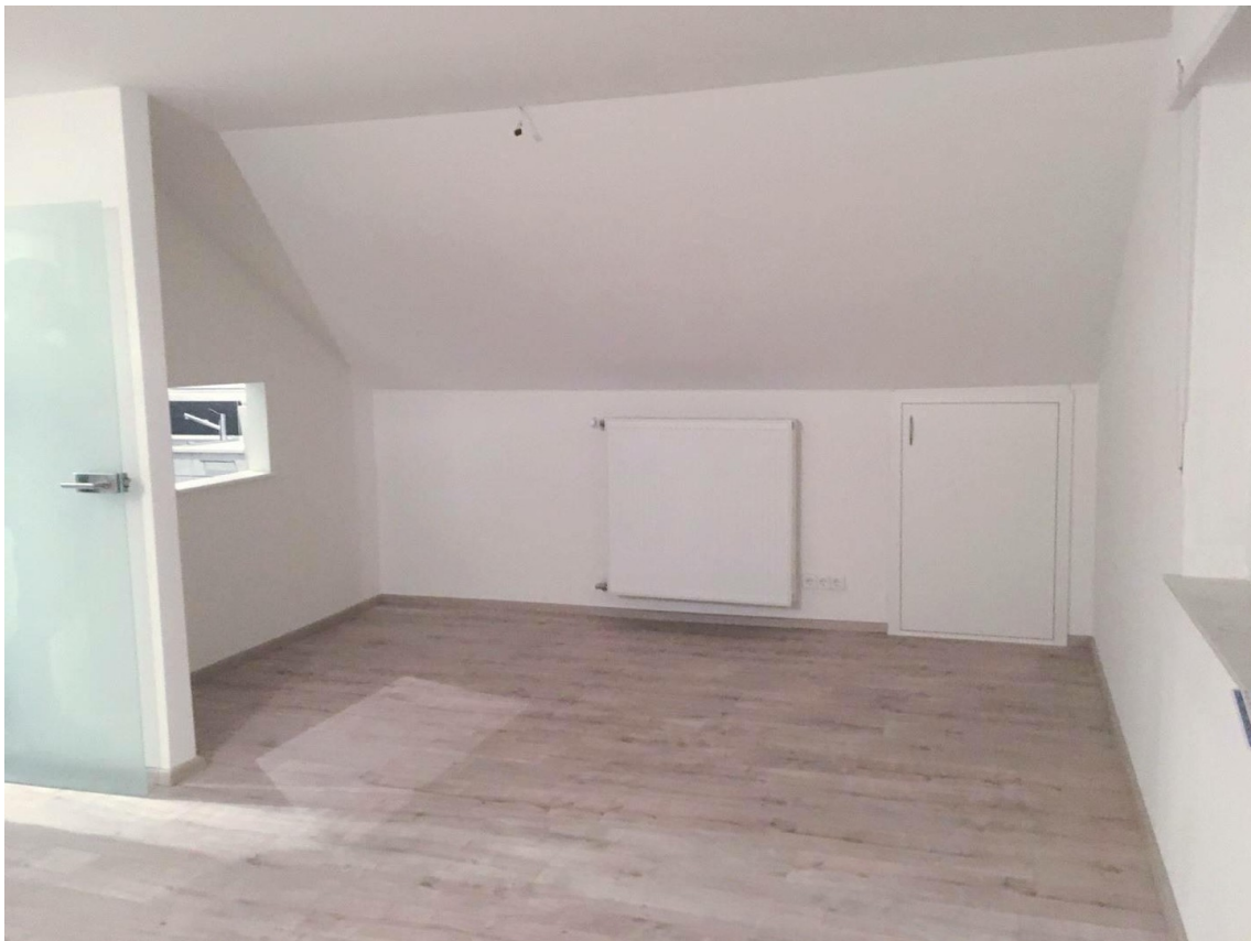
Wohnzimmer mit Essbereich