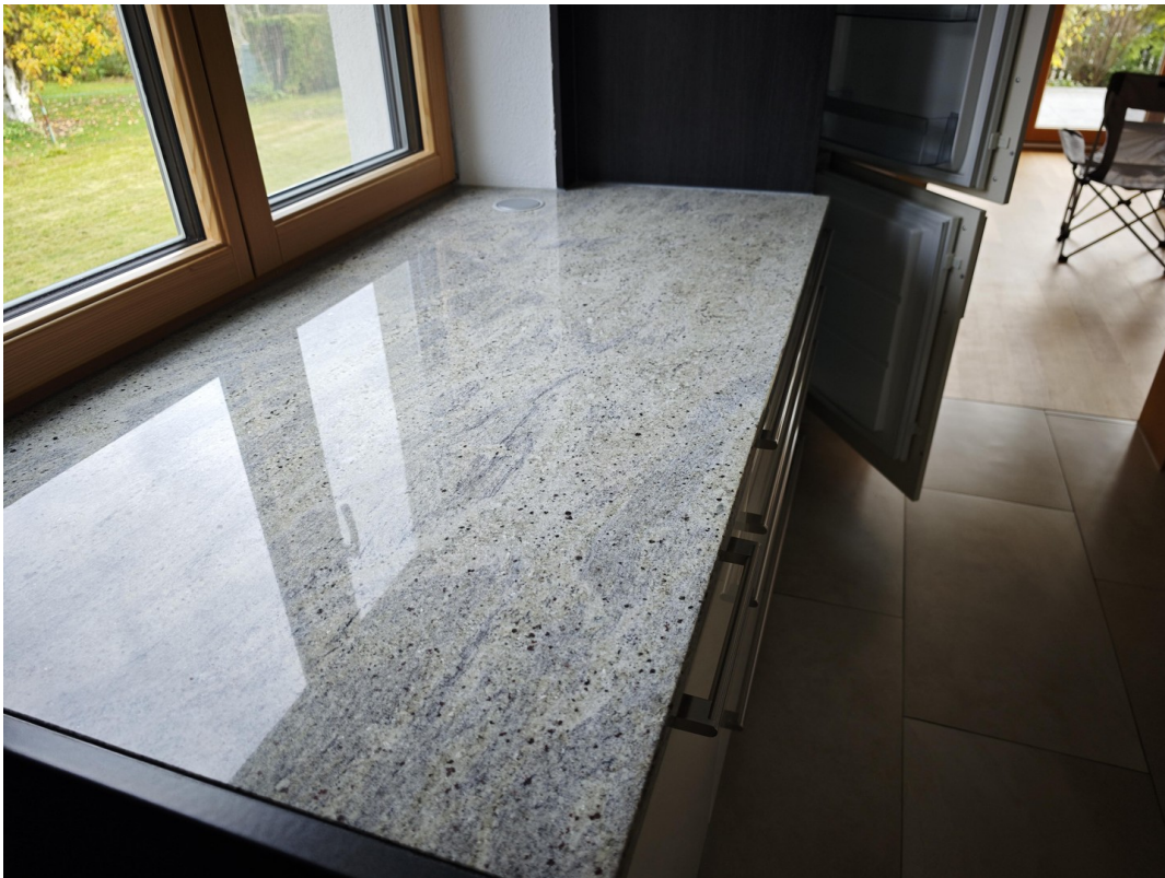
Küche Bild 2