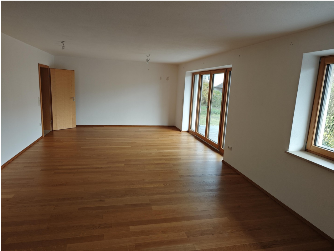
Wohnzimmer Bild 1