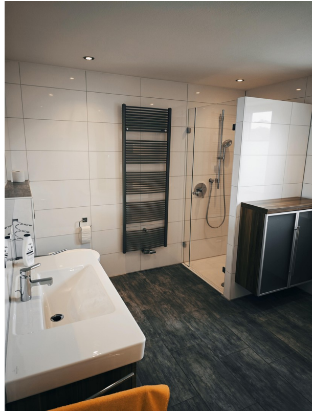
Bad Bild 1