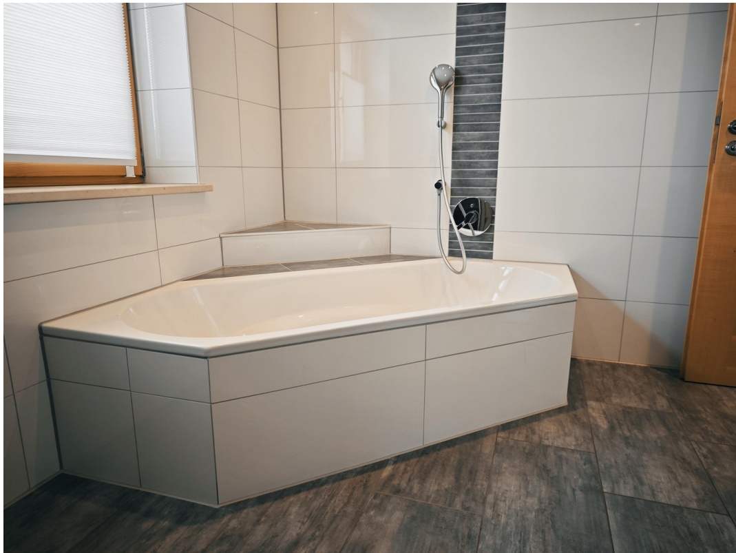
Bad Bild 2