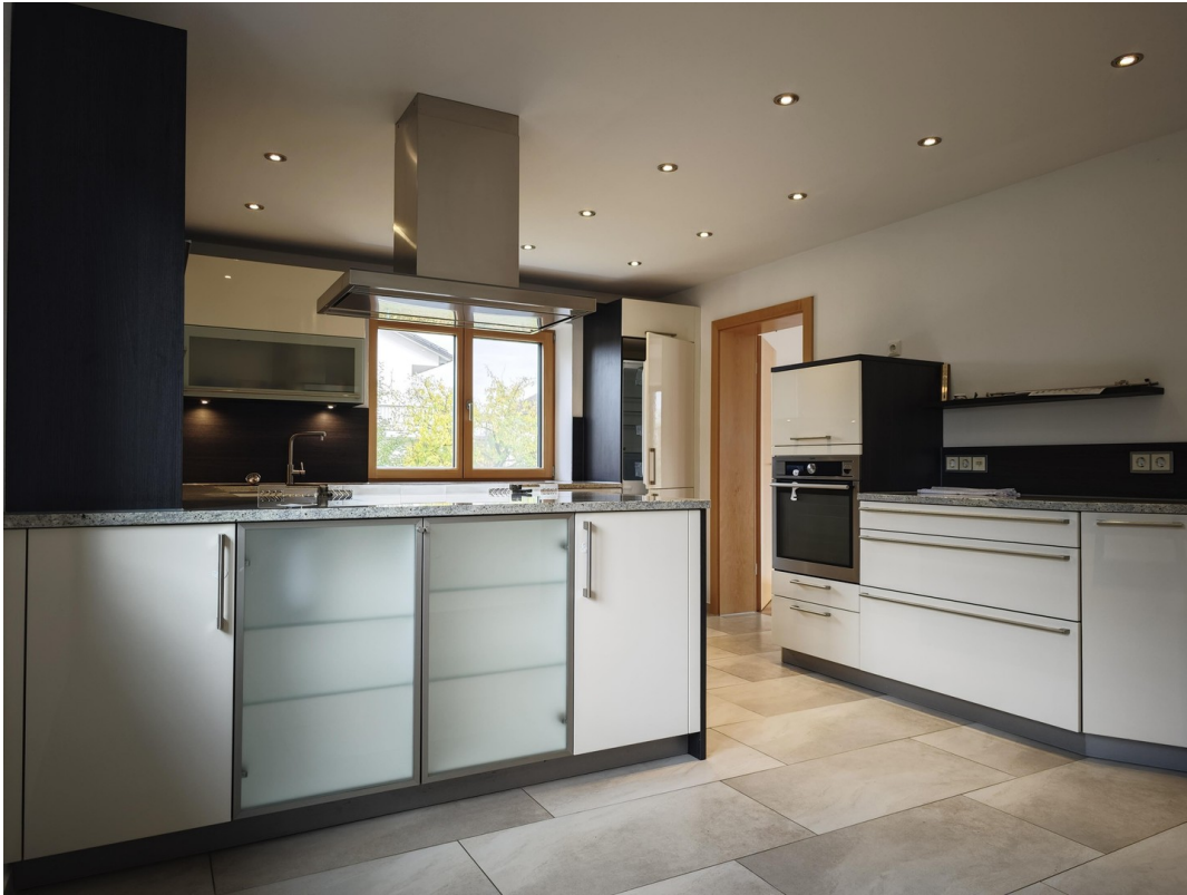
Küche Bild 1