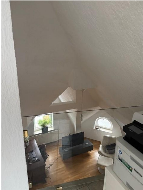
Aussicht von Galerie