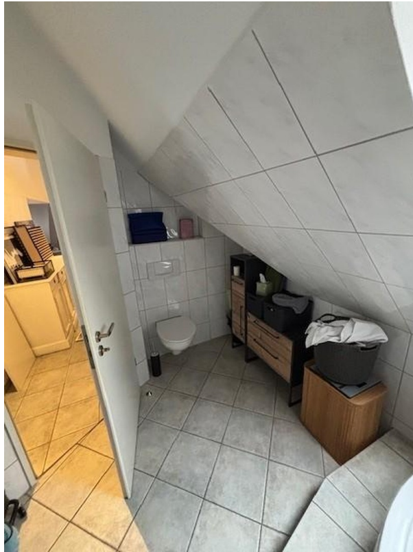
WC im Badezimmer