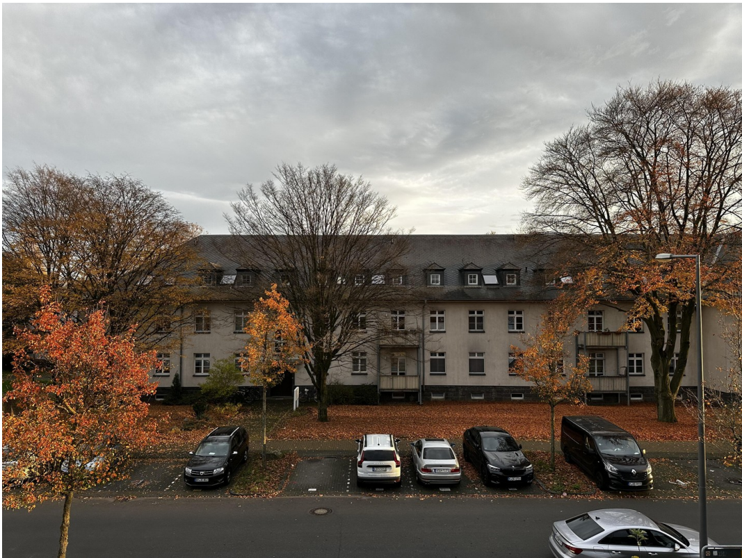
Aussicht 2. OG