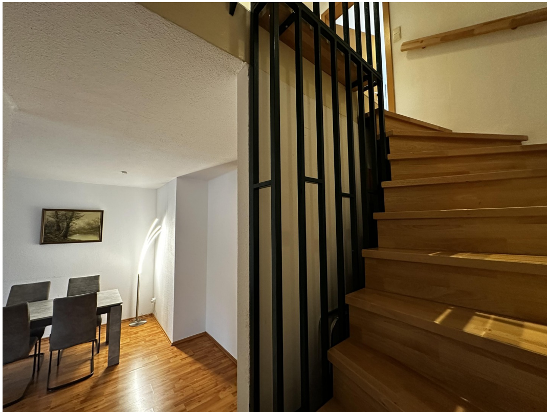
Treppe EG - 1. OG