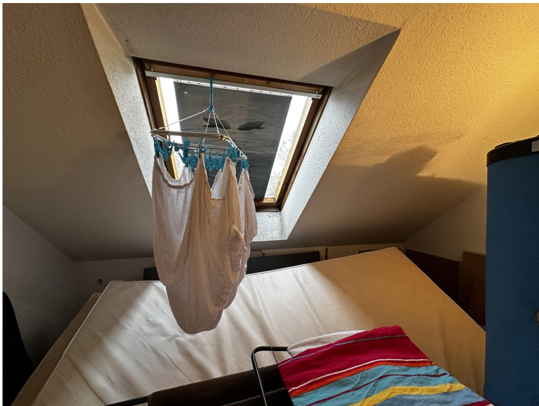
Abstellraum 2. OG