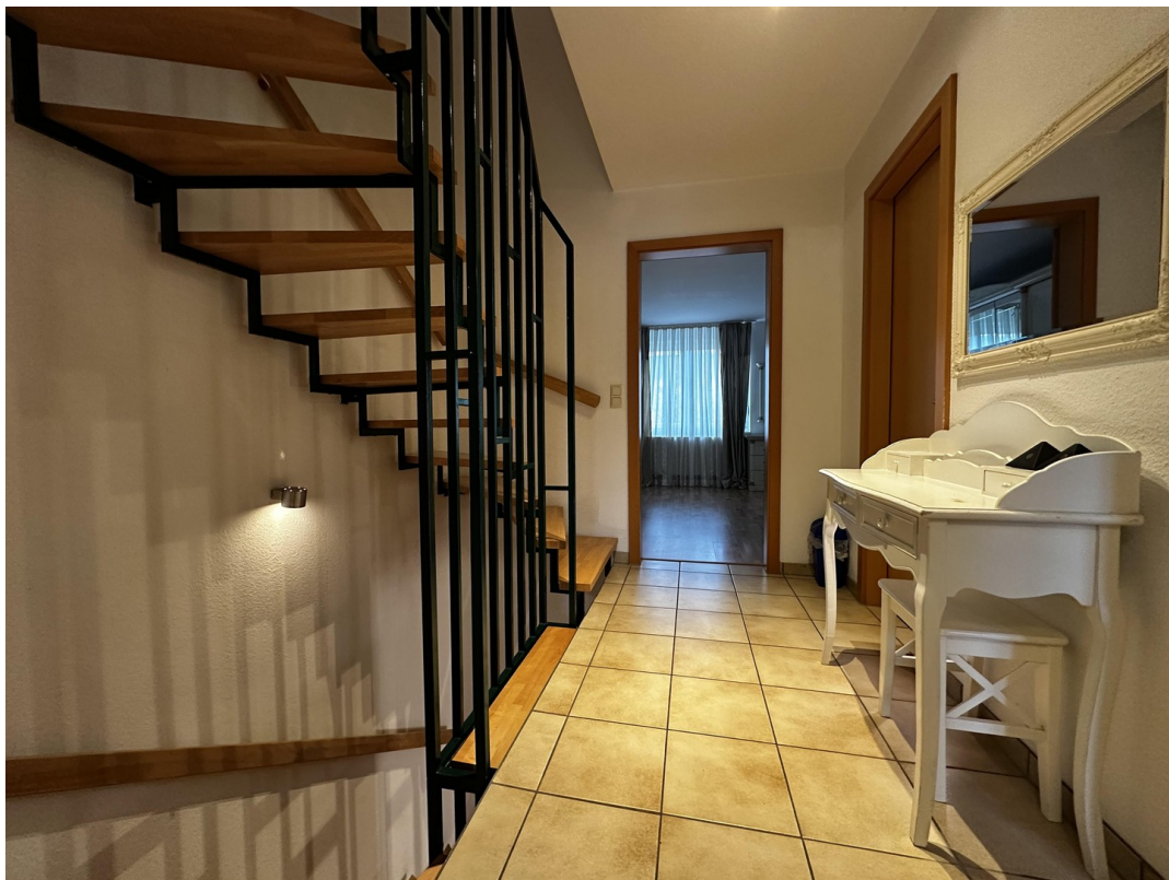
Flur 1. OG