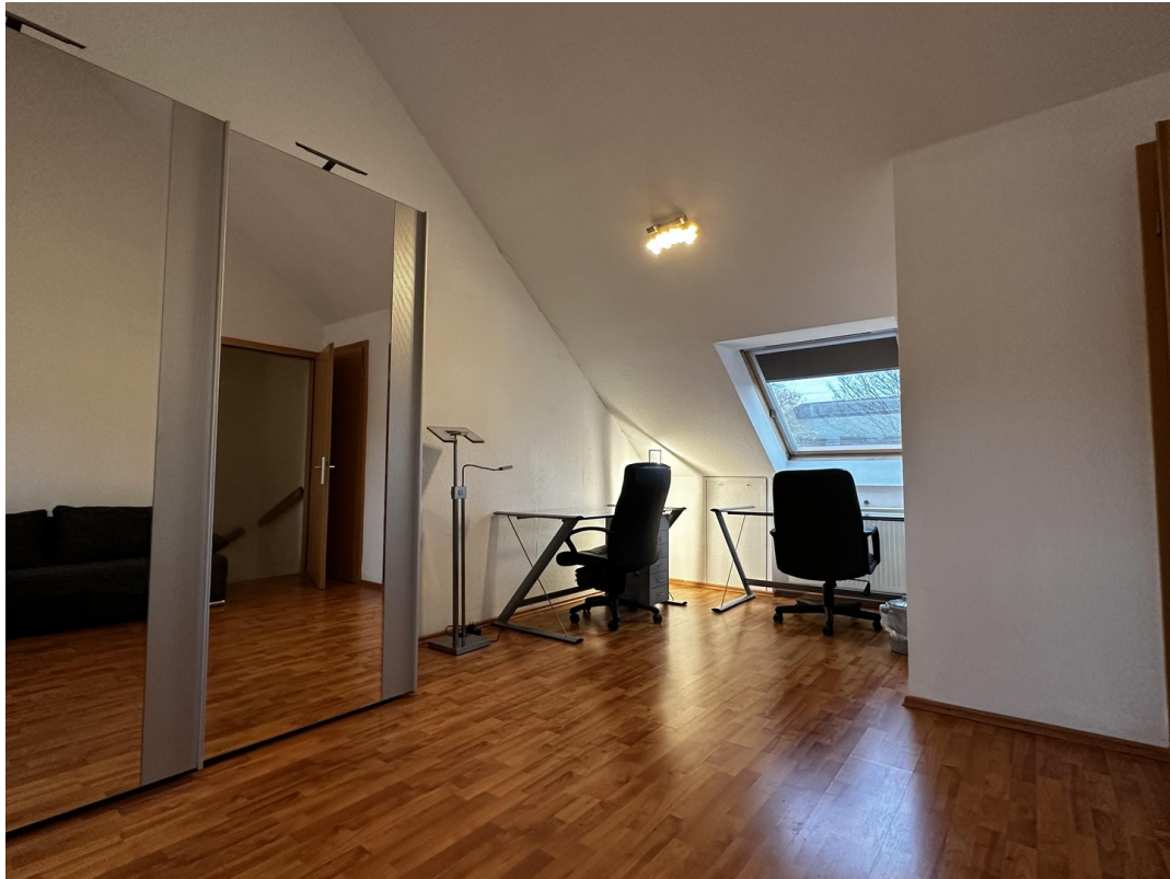
Schlafzimmer 3 (2. OG)