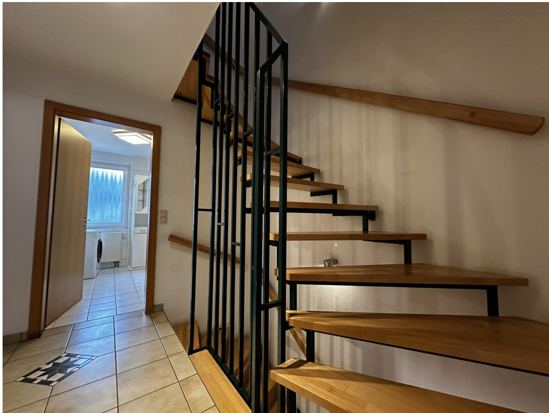
Treppe 1. OG - 2. OG