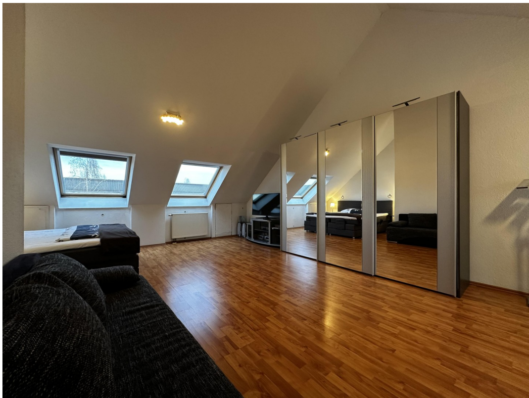
Schlafzimmer 3 (2. OG)