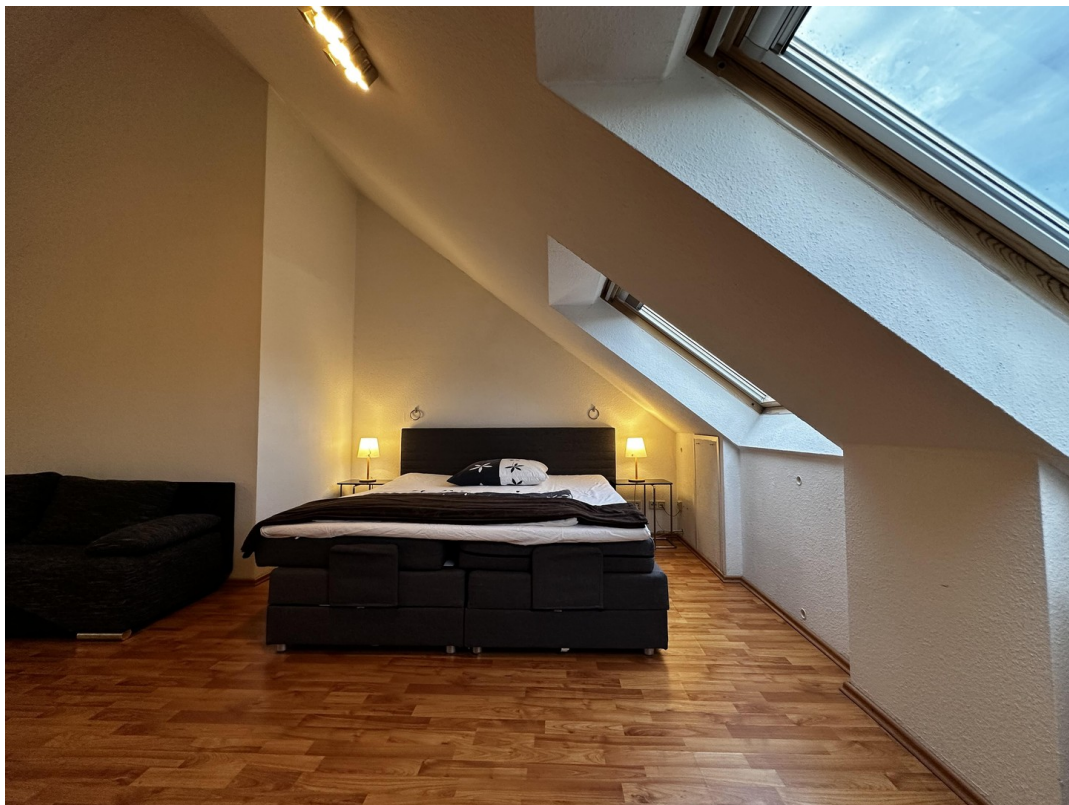
Schlafzimmer 3 (2. OG)