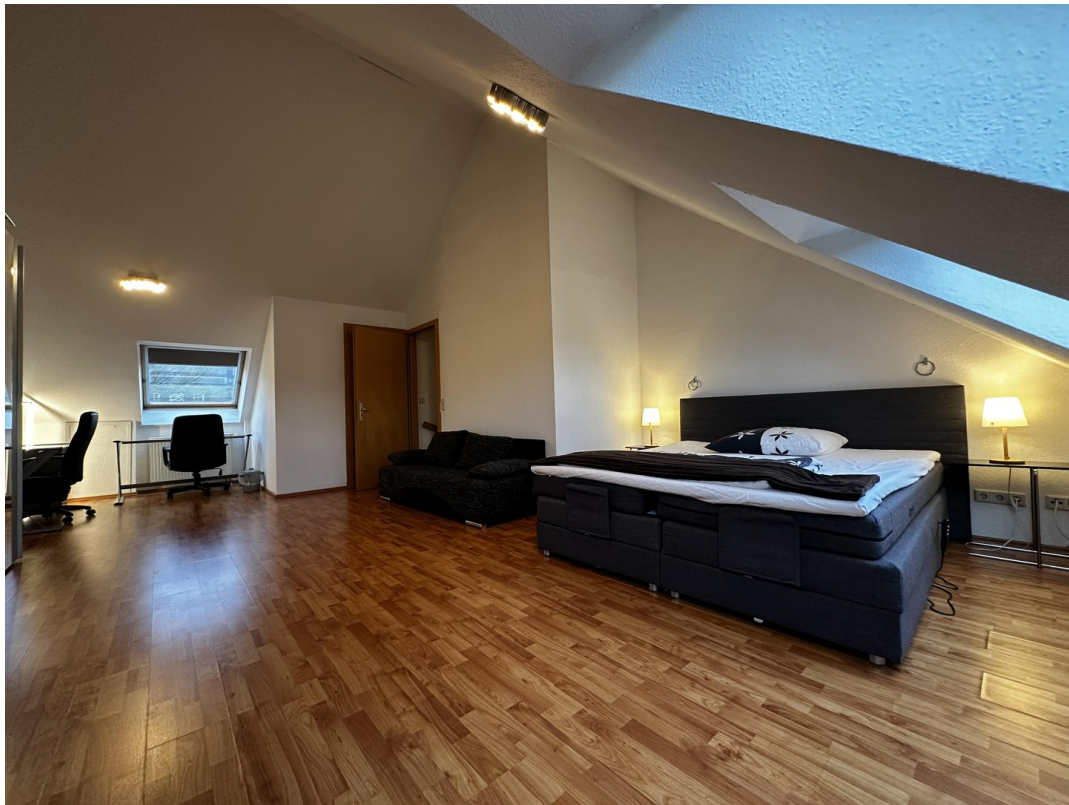
Schlafzimmer 3 (2. OG)