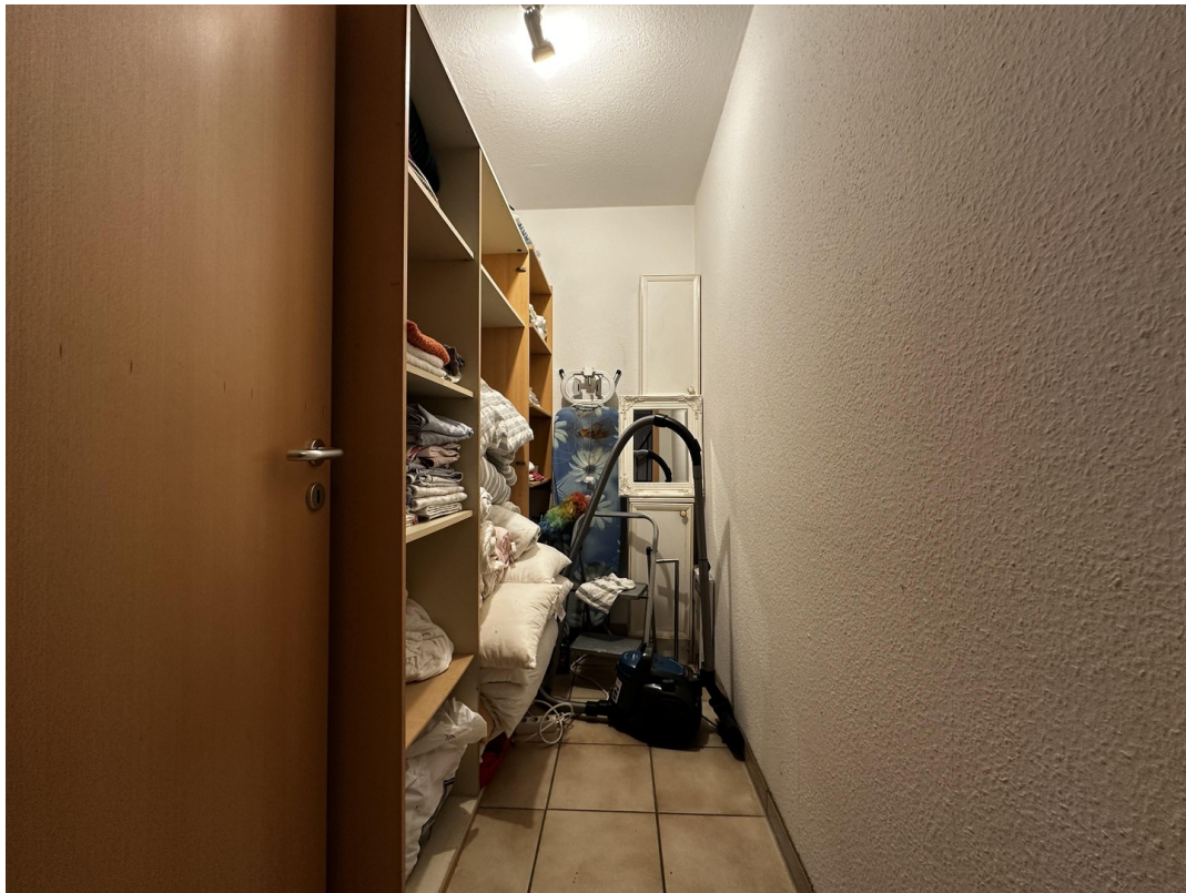
Abstellraum 1. OG