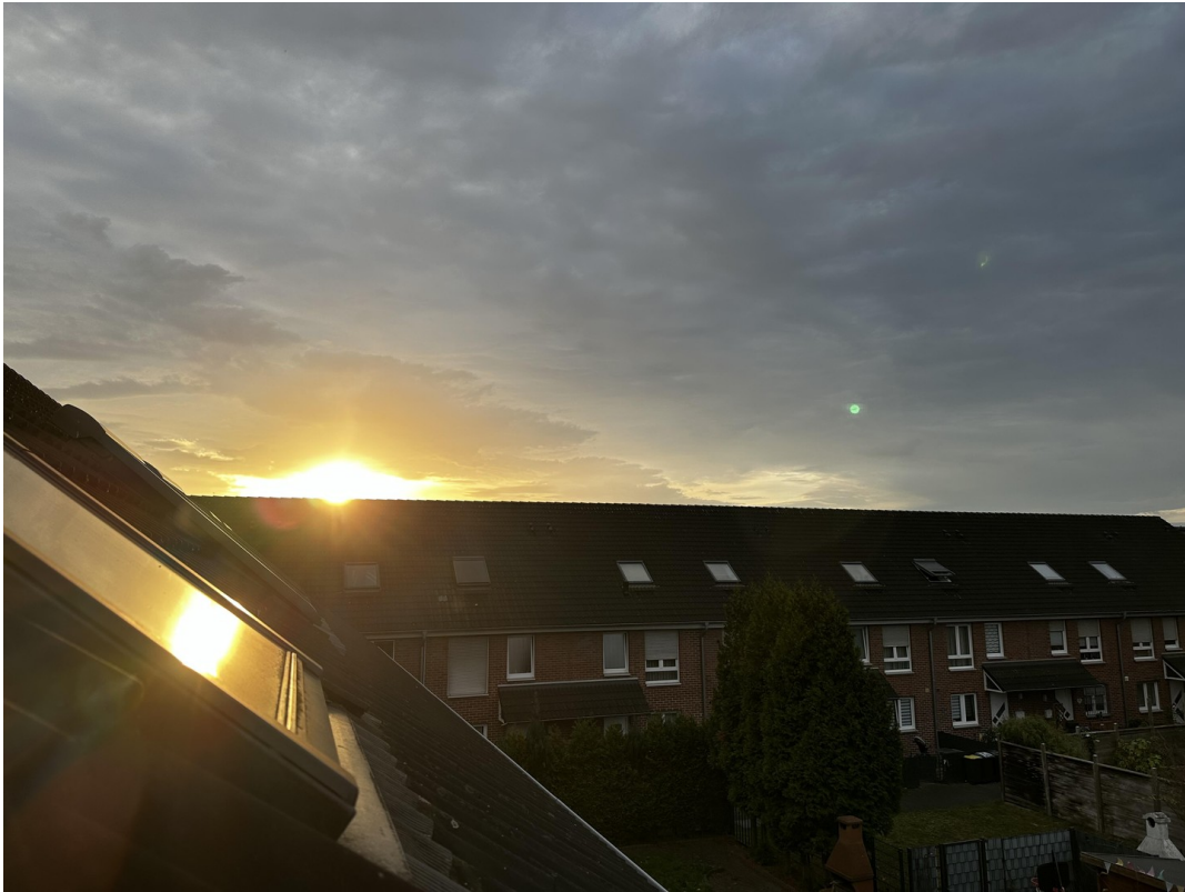
Aussicht 2. OG