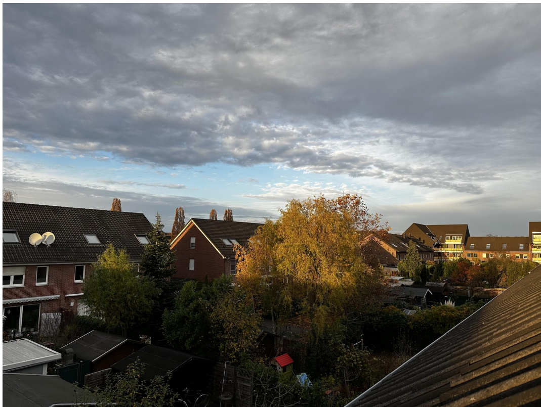
Aussicht 2. OG