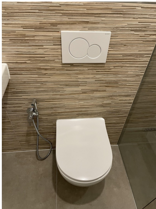
Wc mit Bidet Funktion