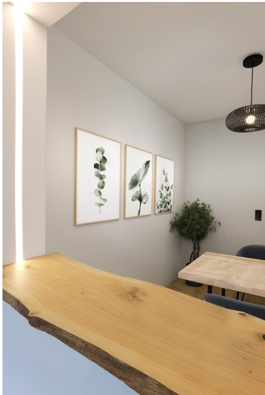
Blick Richtung Essbereich