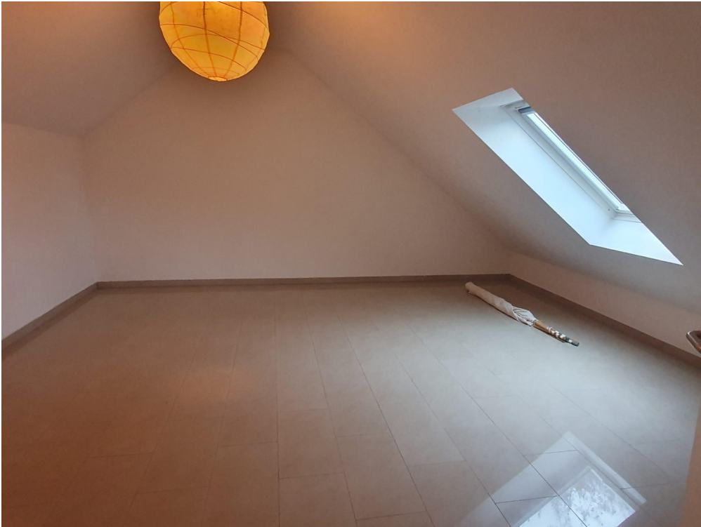
Schlaf - oder Kinderzimmer