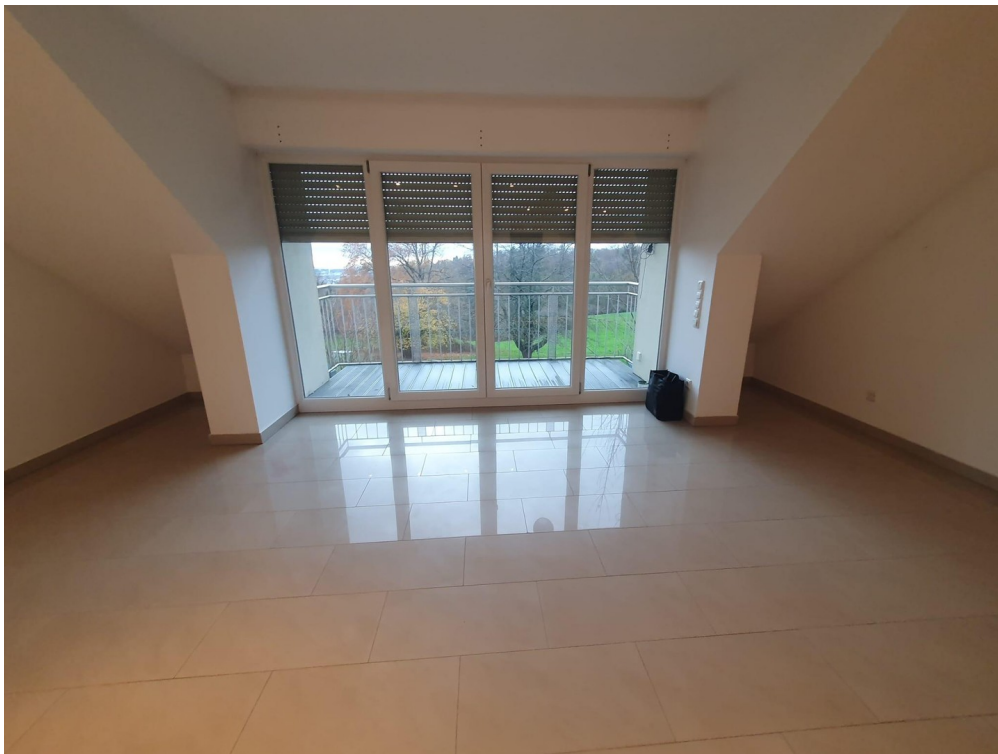
Ausblick vom Wohnzimmer