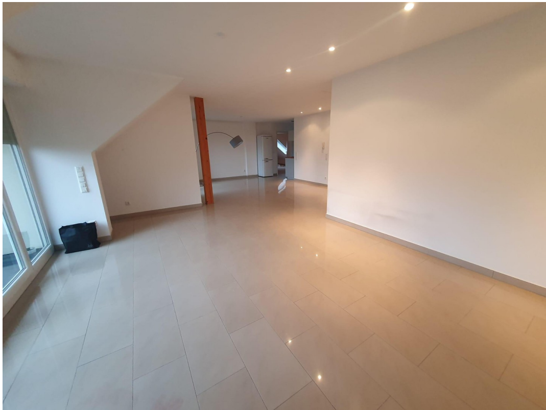
Hell, freundlich, naturnah