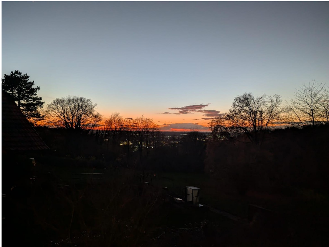
Blick über Aschaffenburg