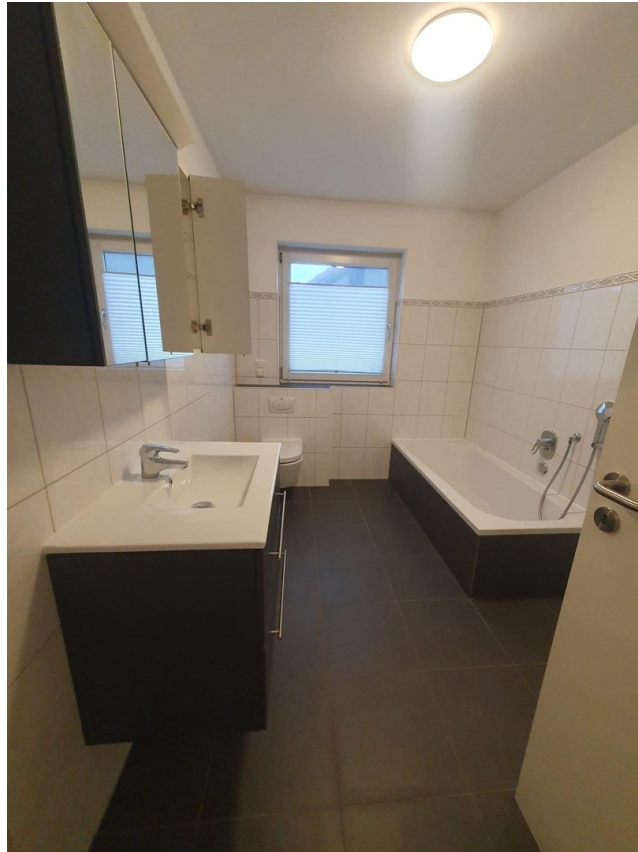
Modernes, exklusives Bad mit D