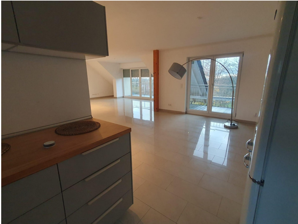
Blick von der Küche