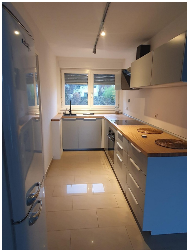
Neuwertige, moderne Einbauküche