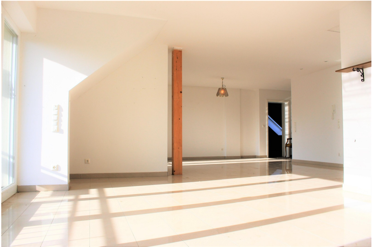
Wohn- u. Esszimmer