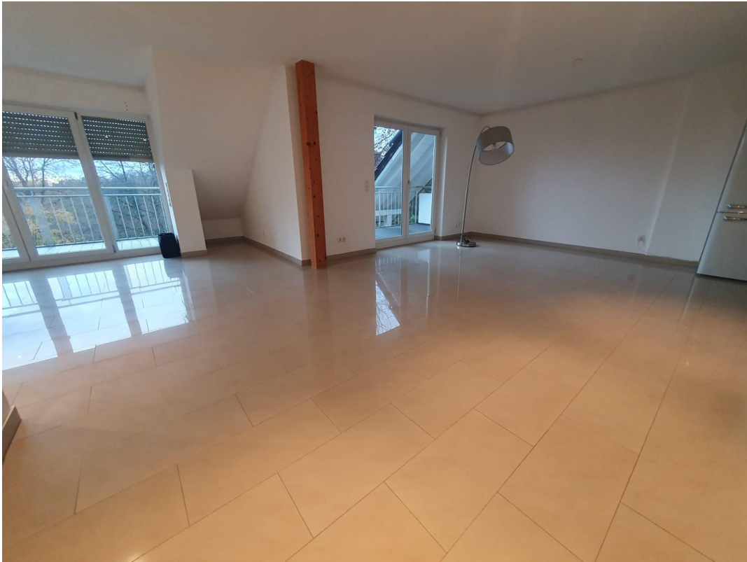
Blick zur Loggia im Essbereich