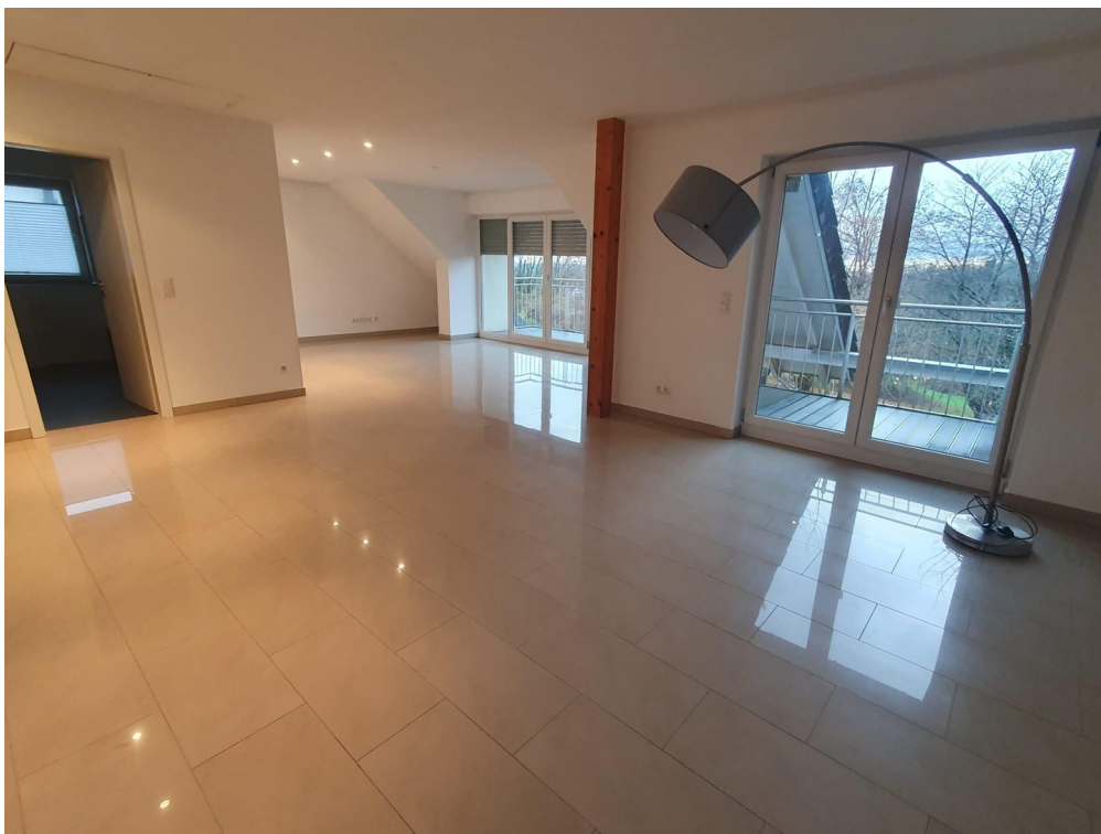
Bodentiefe Fenster mit Loggia