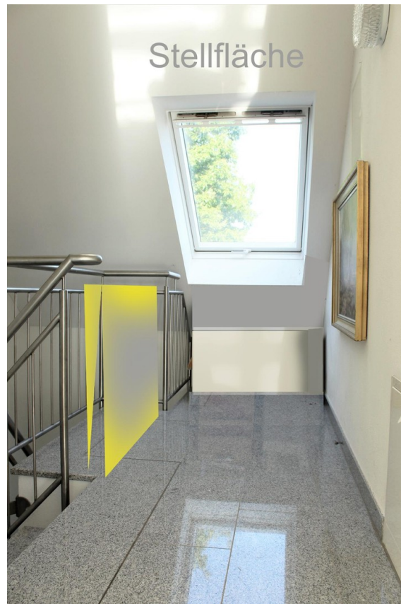
Stellfläche vor Eingangstüre