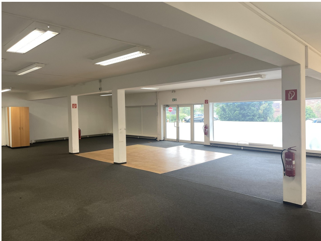
Verkaufsraum mit Haupteingang