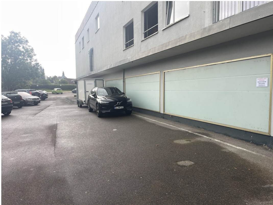
Ansicht vom Parkplatz