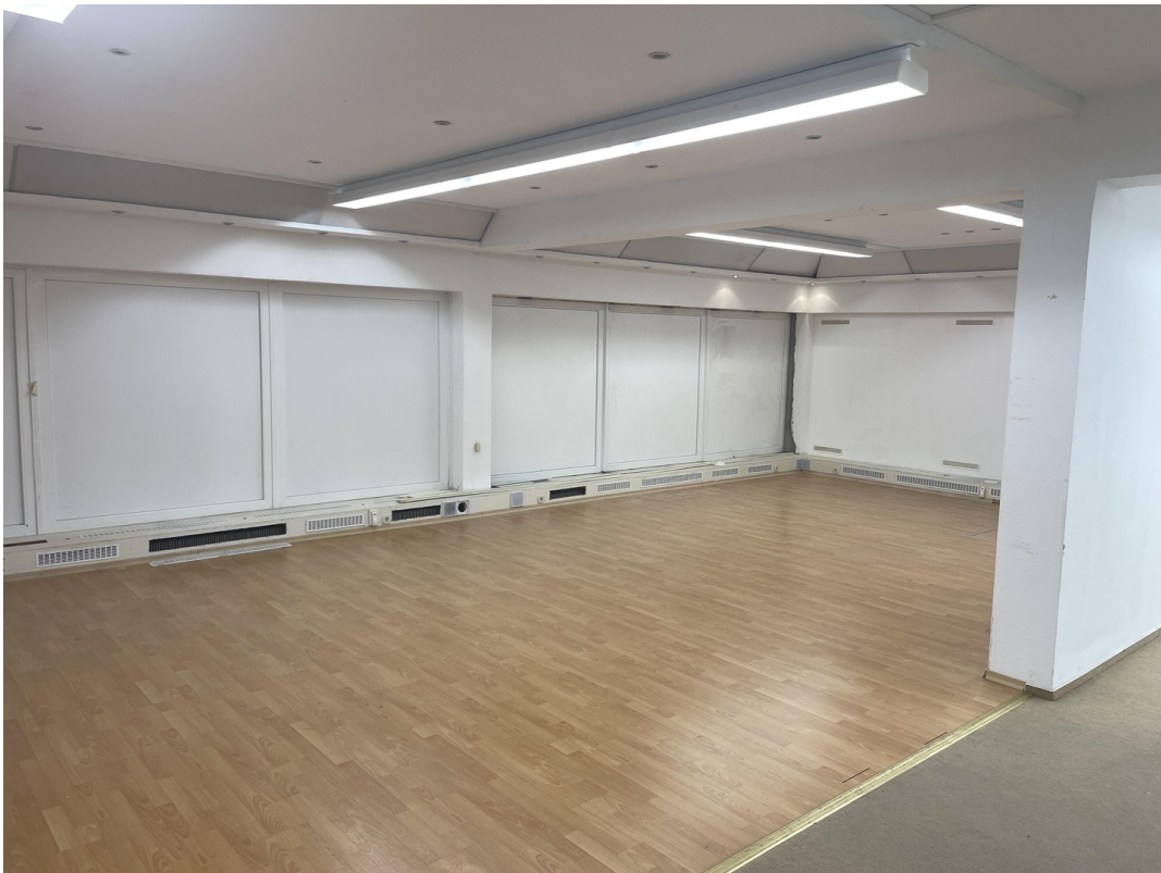
Verkaufsraum hintere Bereich