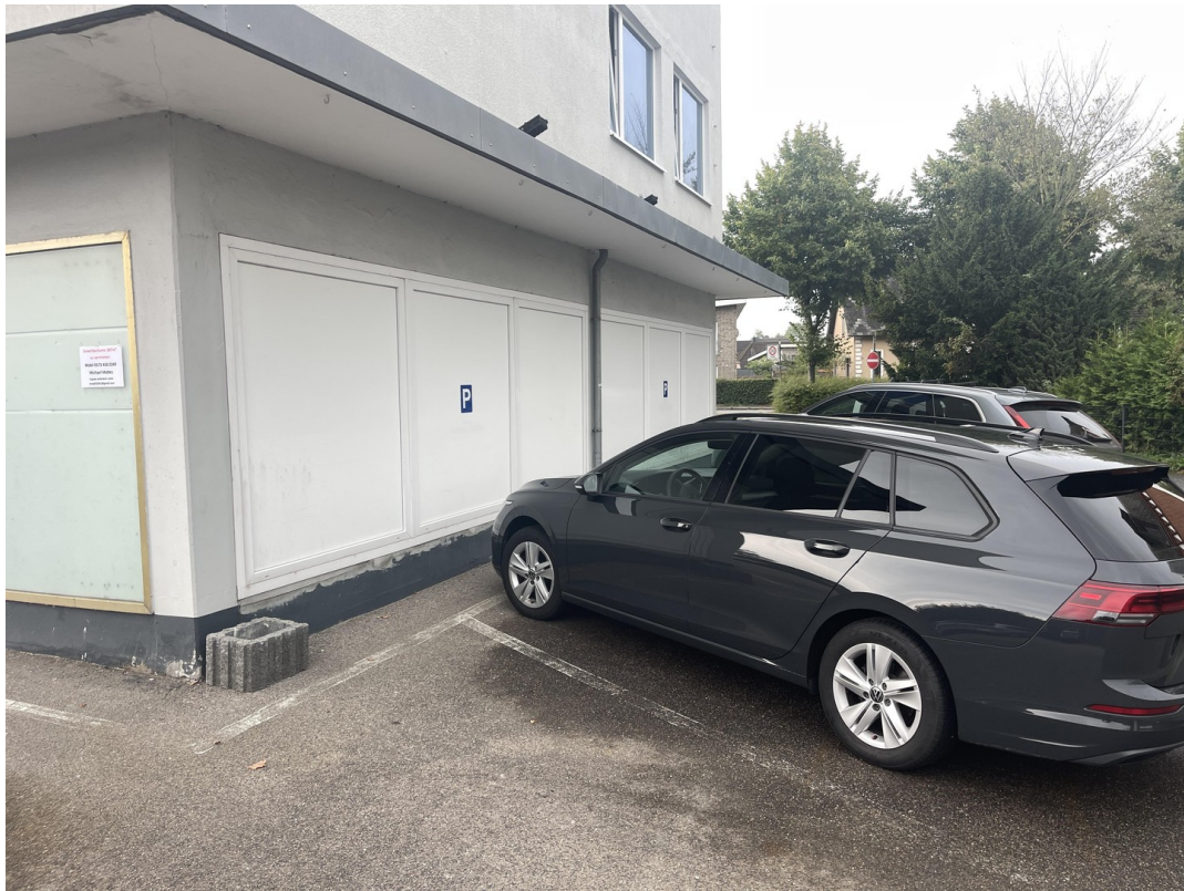
Ansicht von der Nordstraße