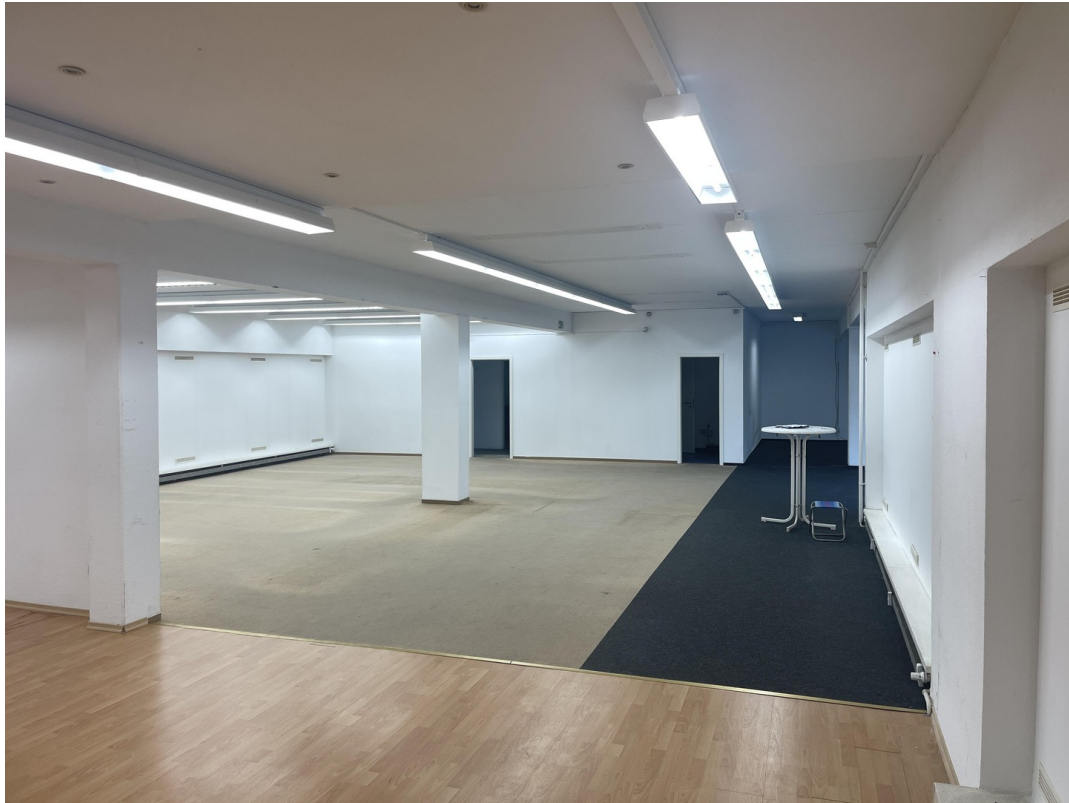
Verkaufsraum vordere Bereich