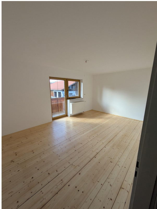
Balkonzimmer / Schlafzimmer