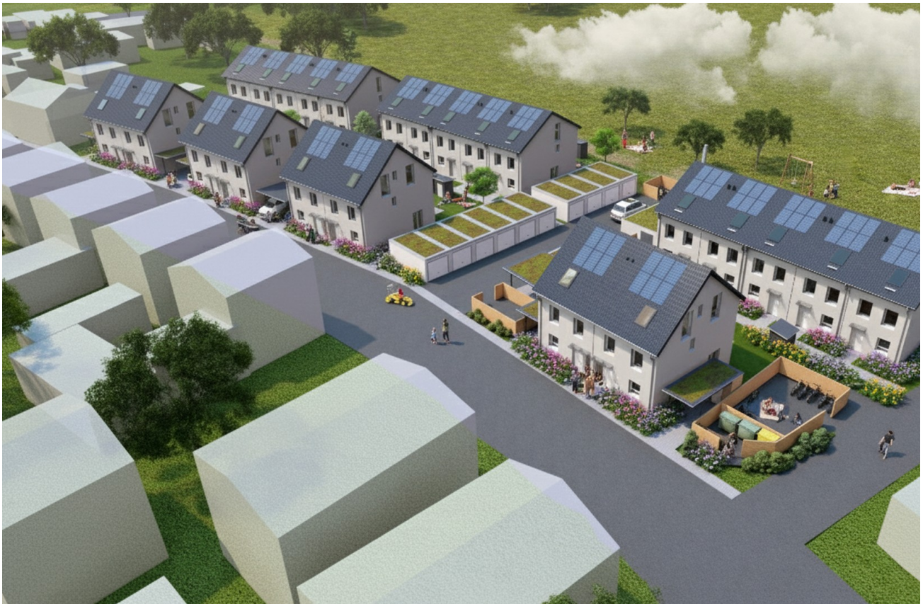
Außensicht Oben - VISU