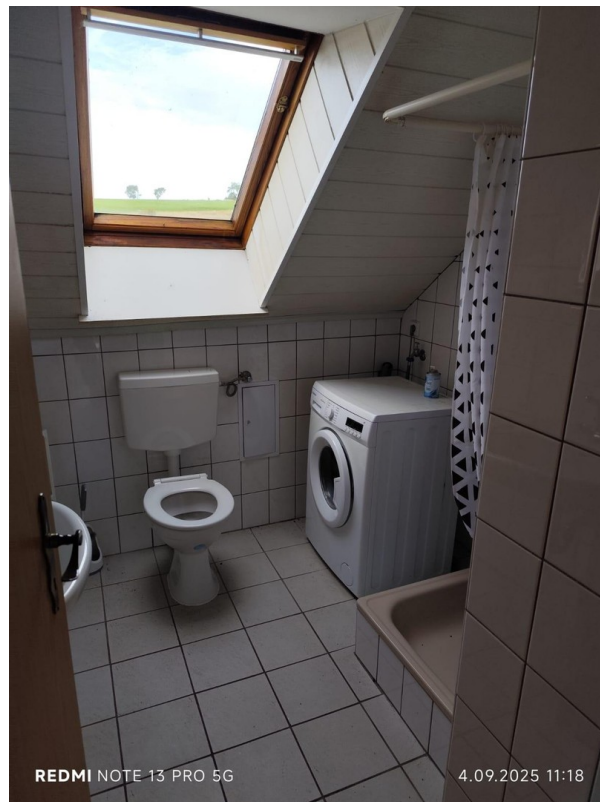
Bad der 2-RMW