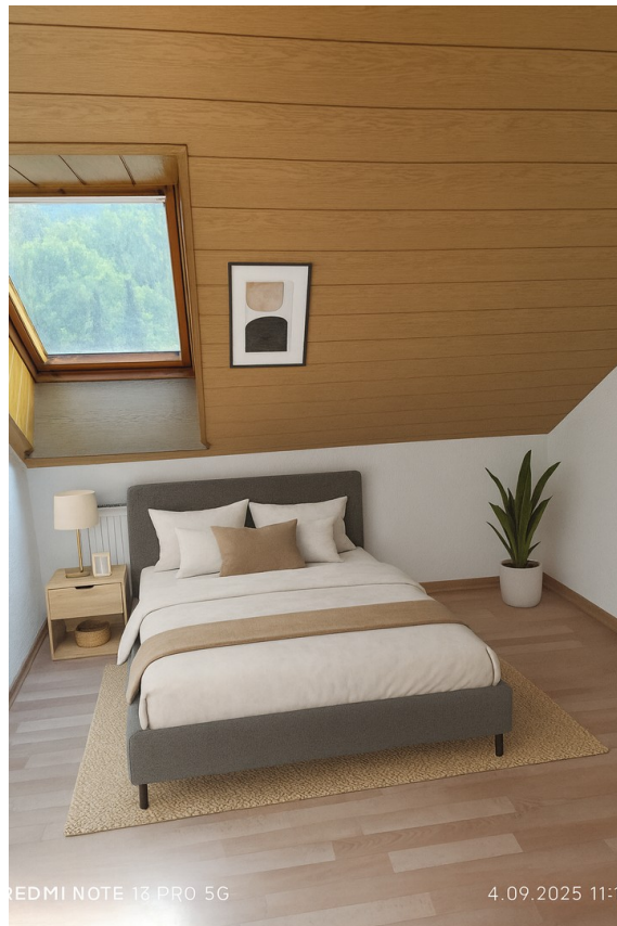
Zimmer der 2-RMW