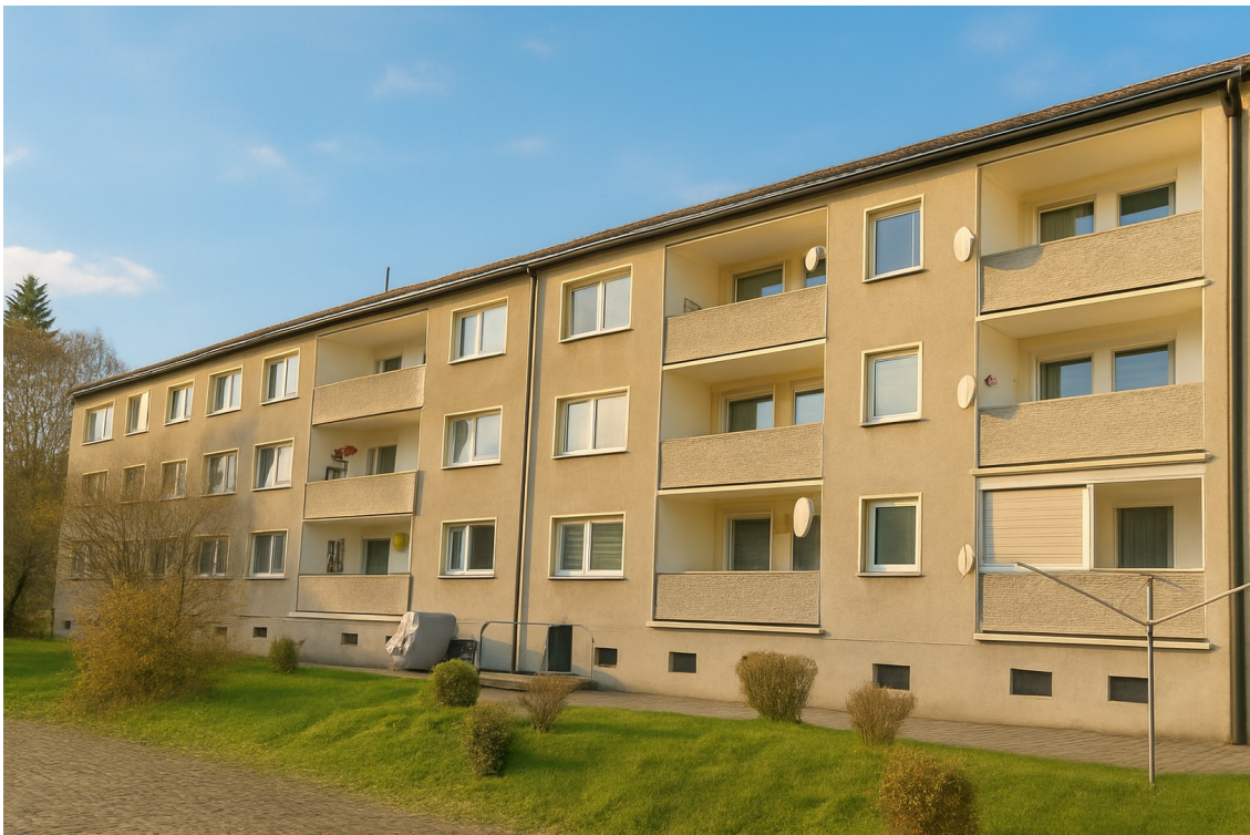
Haus von hinten