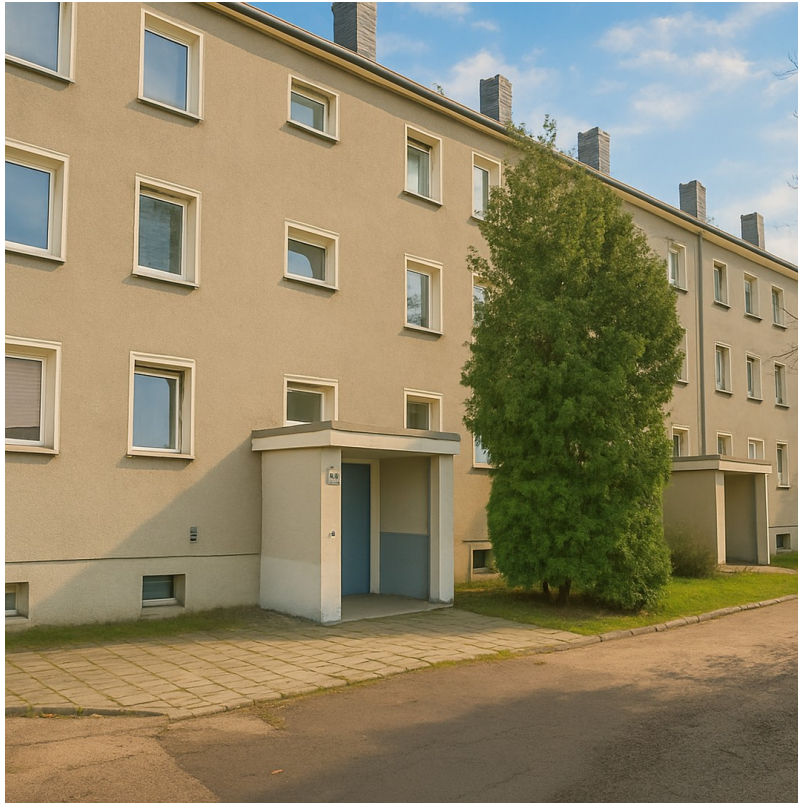
Haus von vorne