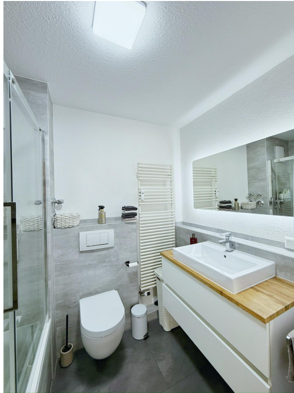
Badezimmer inkl. WC