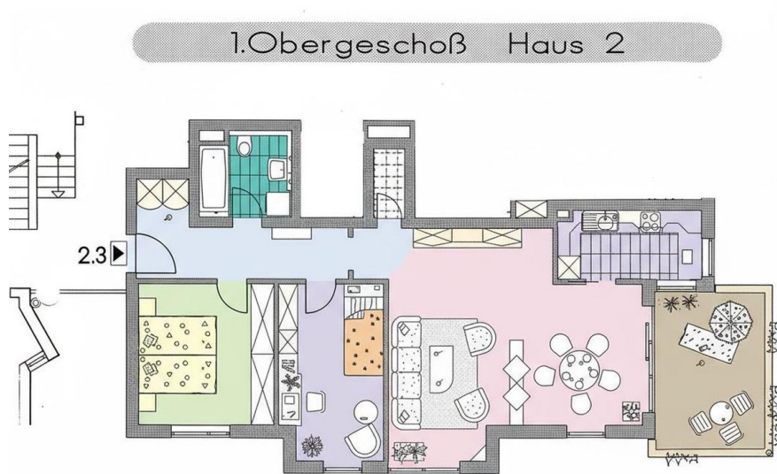
Grundriss als Übersicht