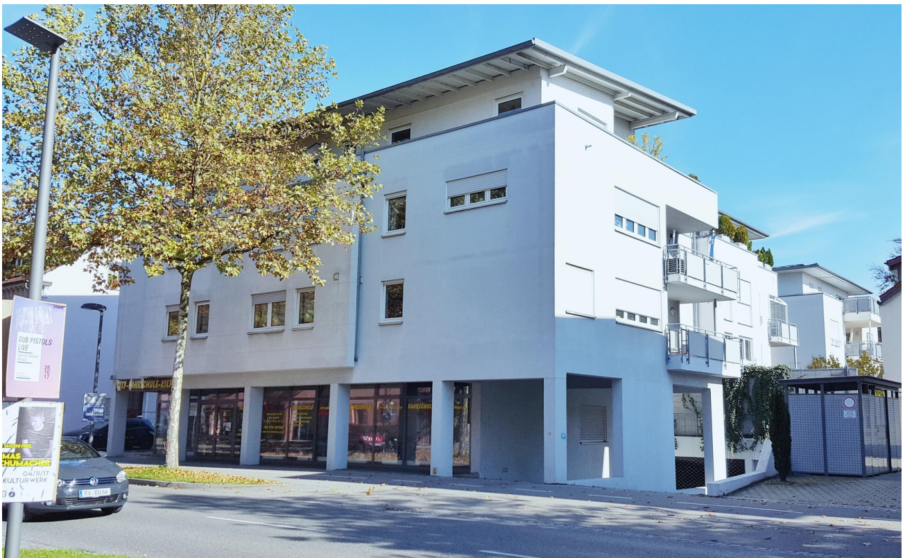
Straße mit Tiefgaragenzufahrt