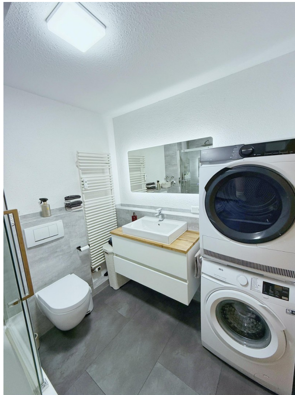
Badezimmer inkl. WC