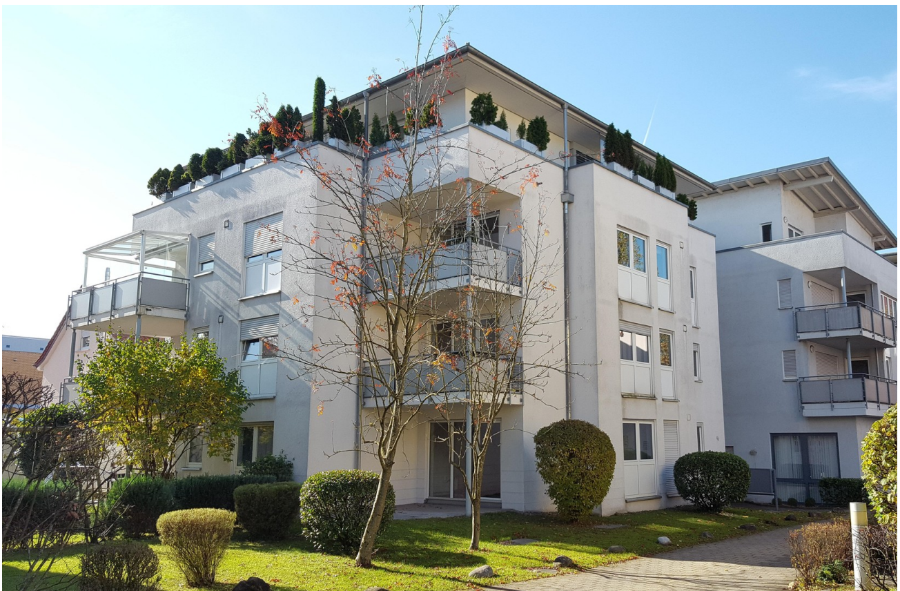
Blick vom Innenhof