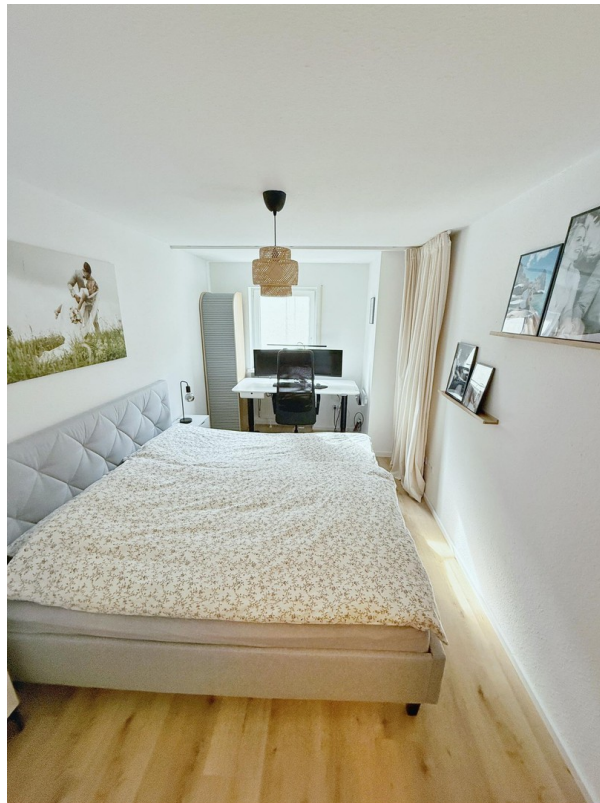
Schlafbereich mit Büroecke