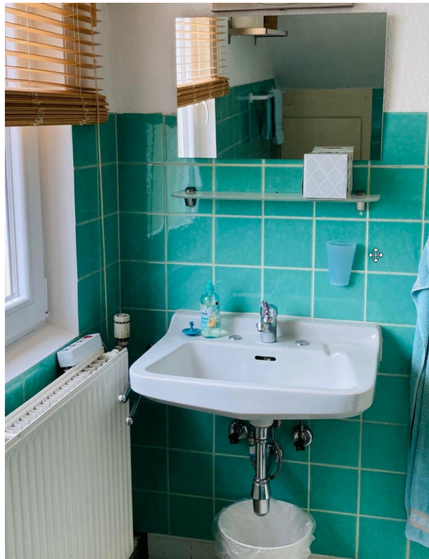
Bad Ansicht 2