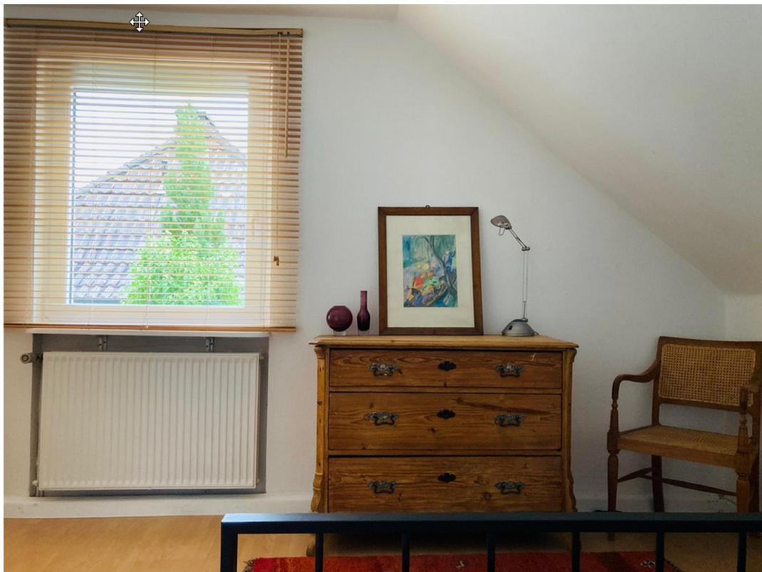
Schlafzimmer Ansicht 1