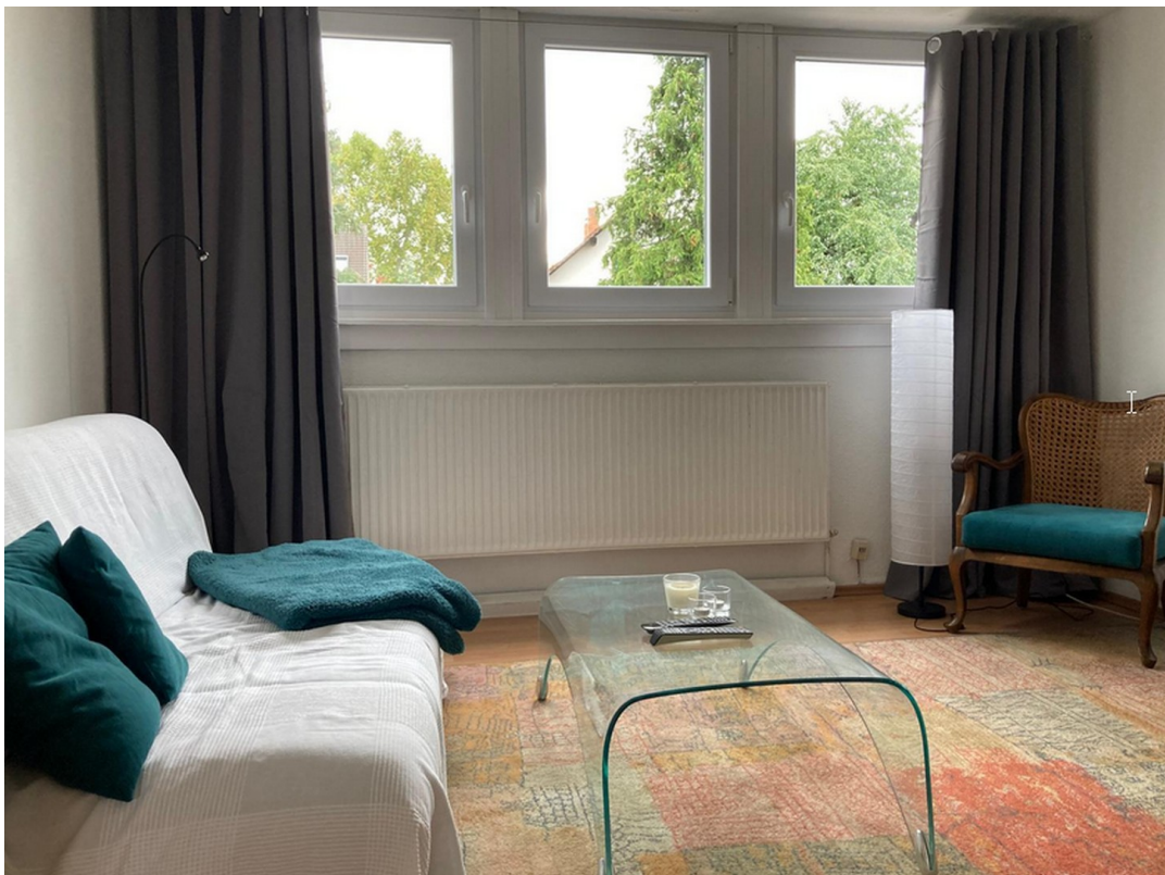
Wohnzimmer Ansicht 1