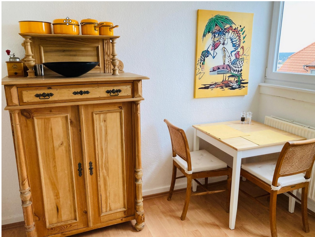
Küche Ansicht 2