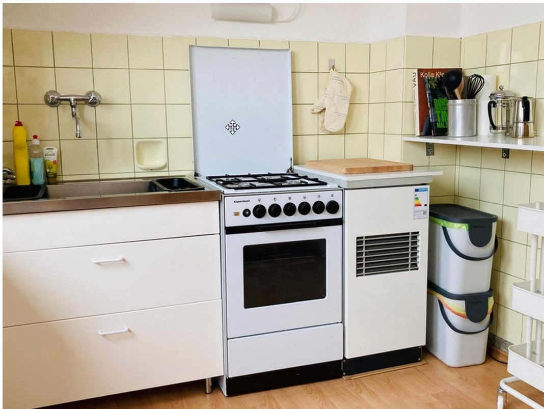
Küche Ansicht 1