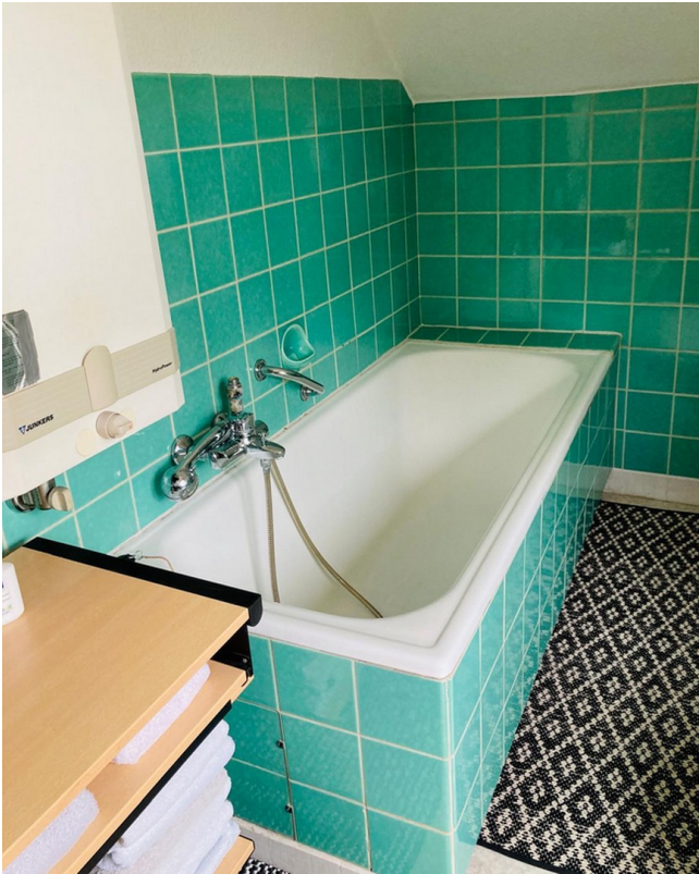
Bad Ansicht 3