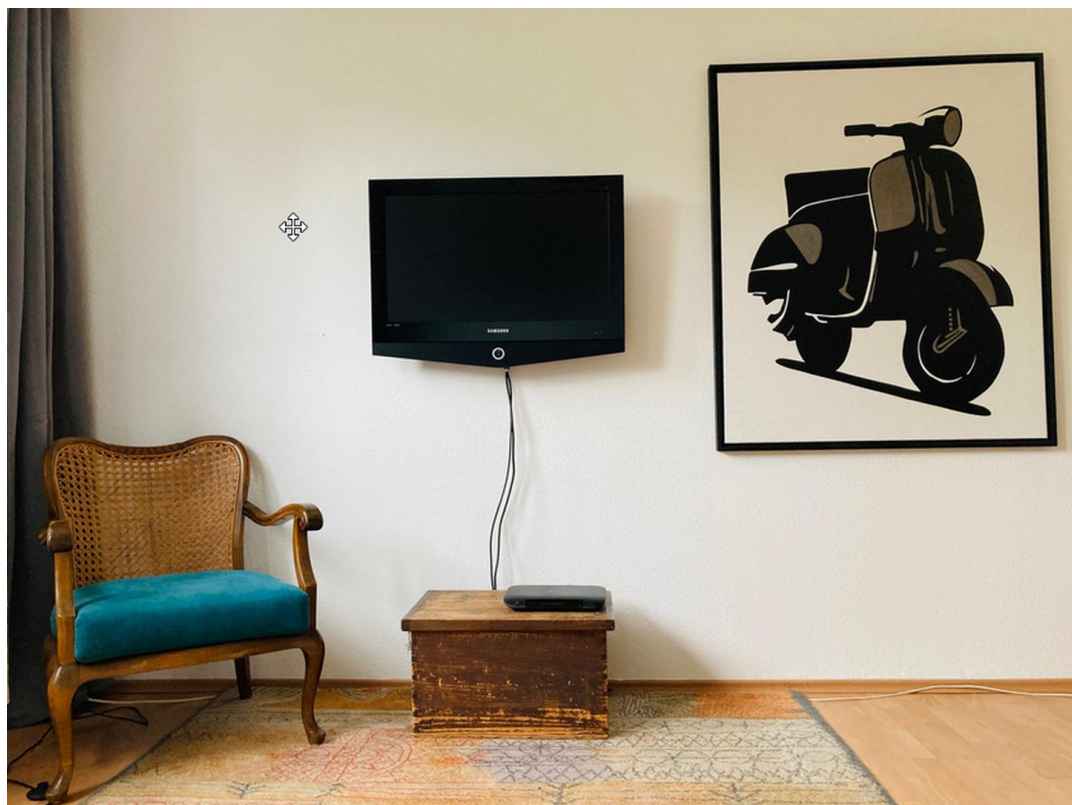
Wohnzimmer Ansicht 2