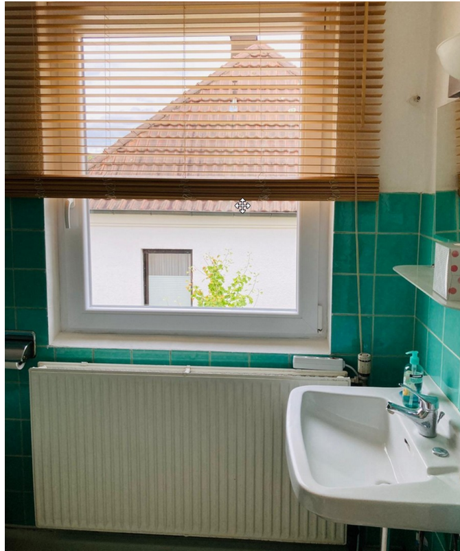
Bad Ansicht 1