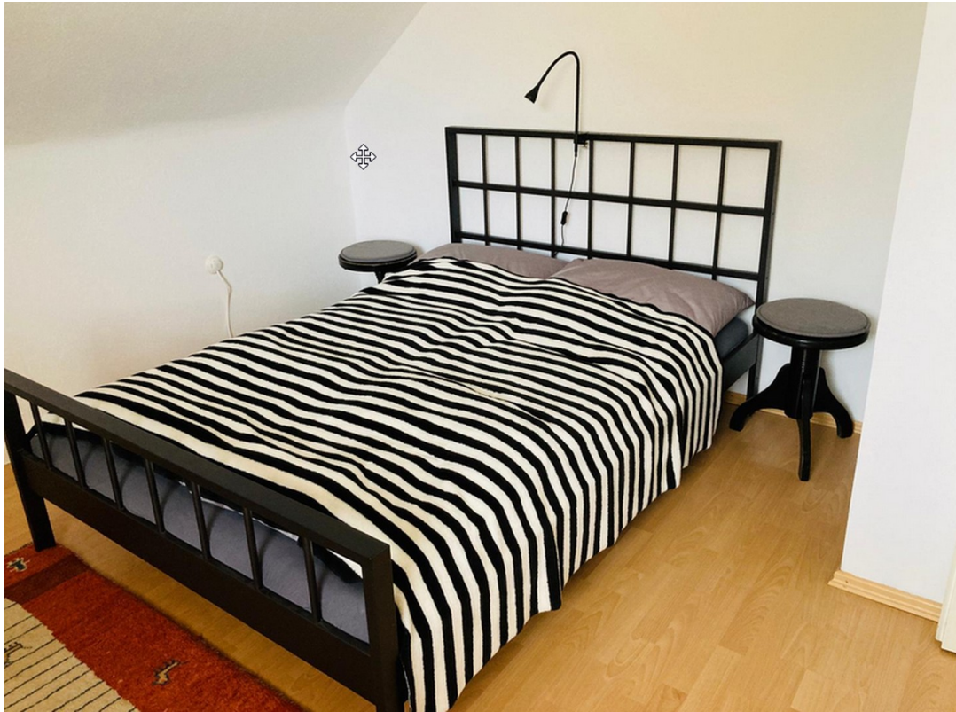
Schlafzimmer Ansicht 2