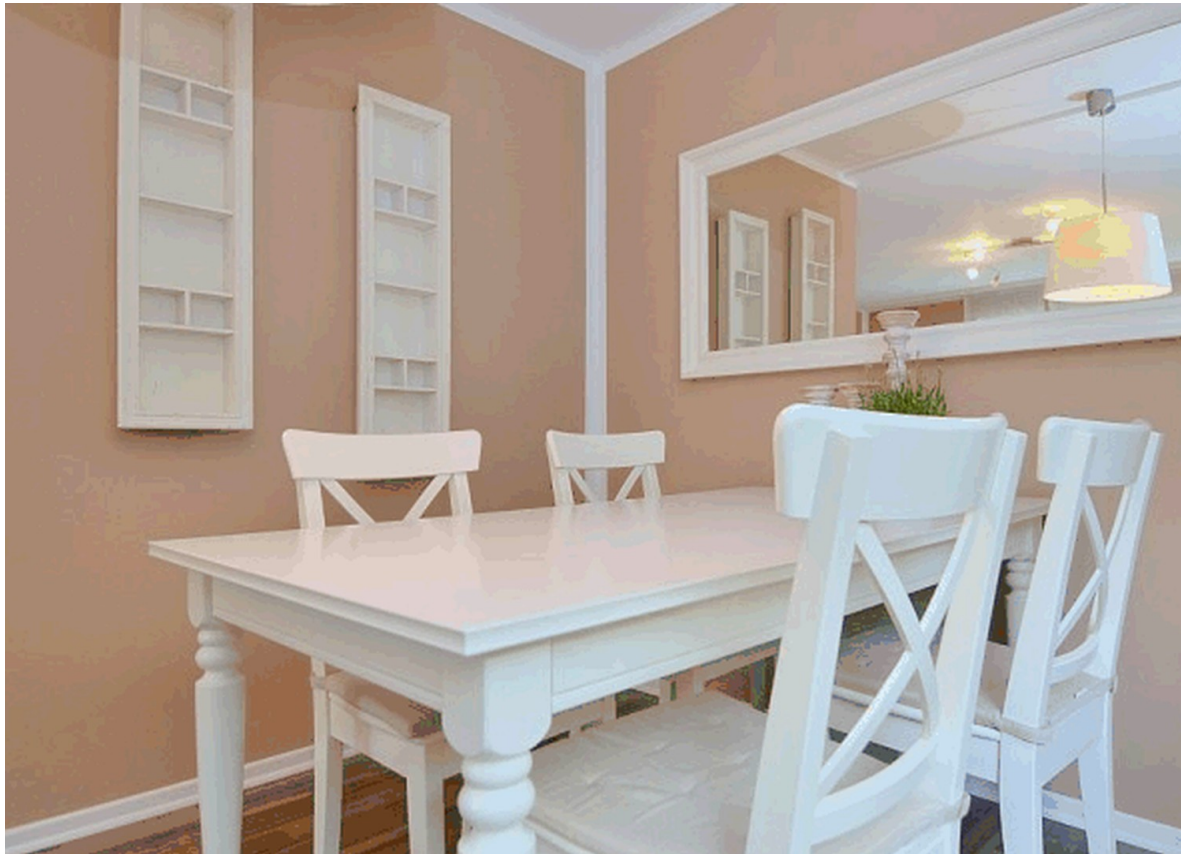
Essbereich im Wohnzimmer