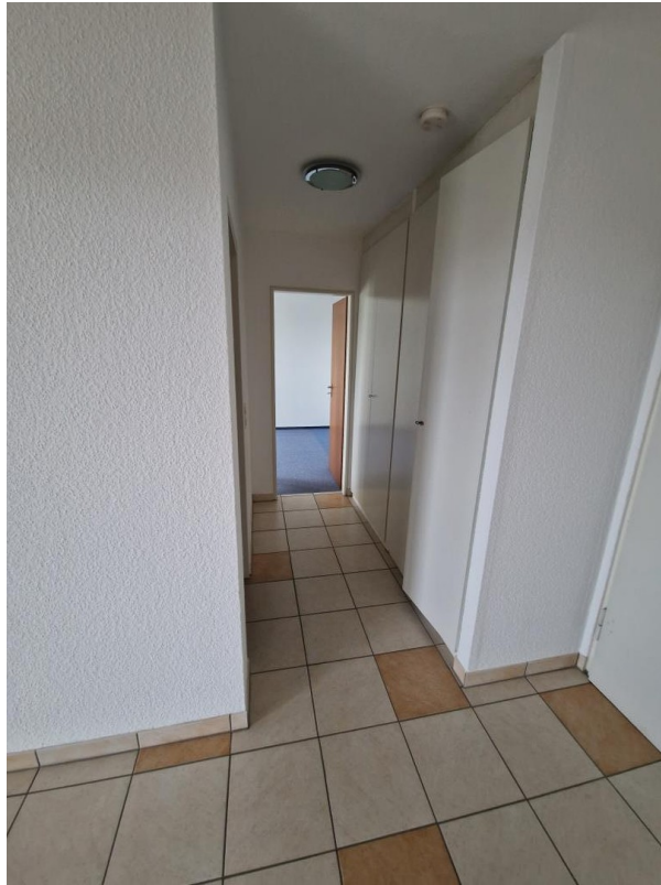
Flur mit Einbauschränken