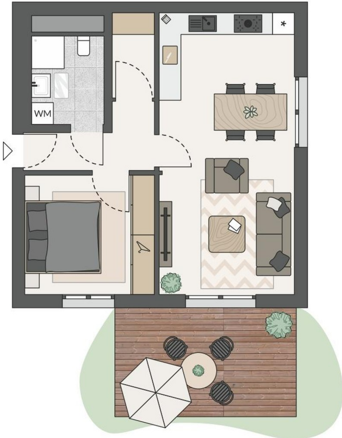
Grundriss Wohnung 03

Der Gartenanteil wird hier nicht vollständig dargestellt.