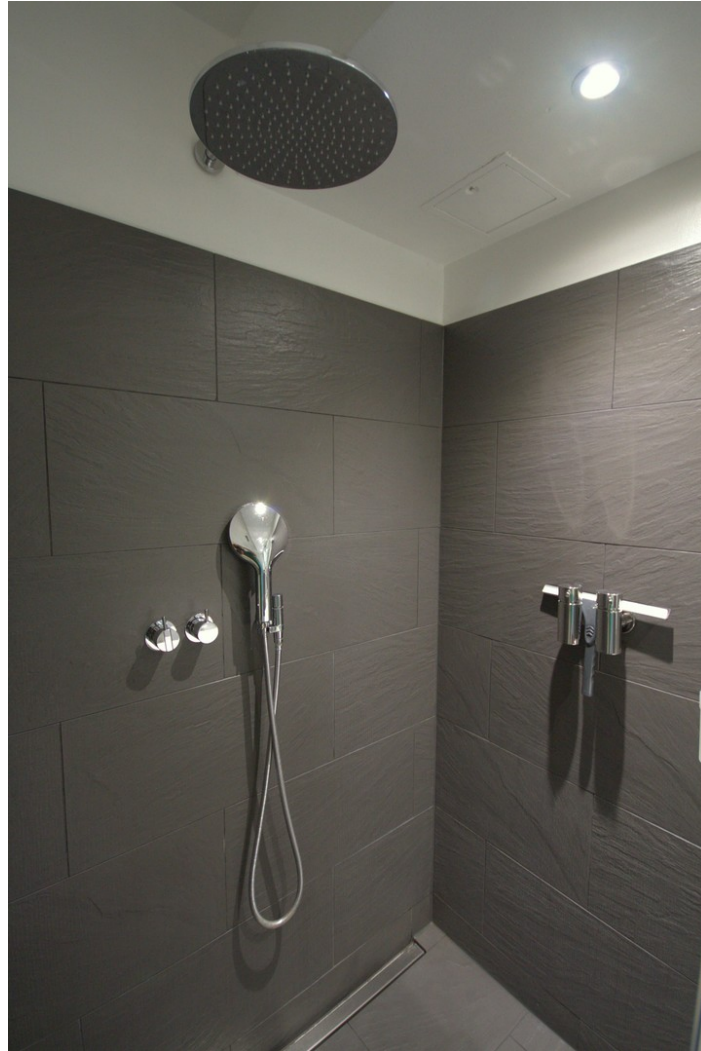
Walk in Dusche