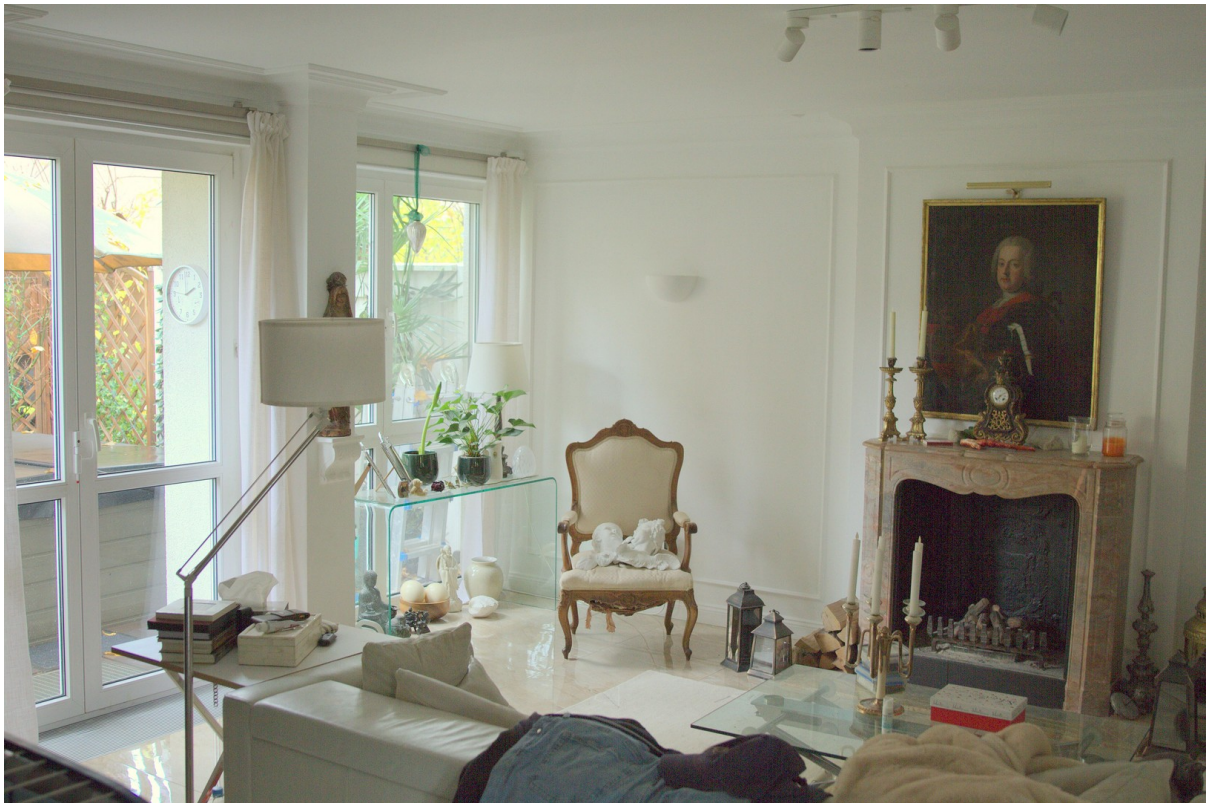
Kamin / Wohnzimmer