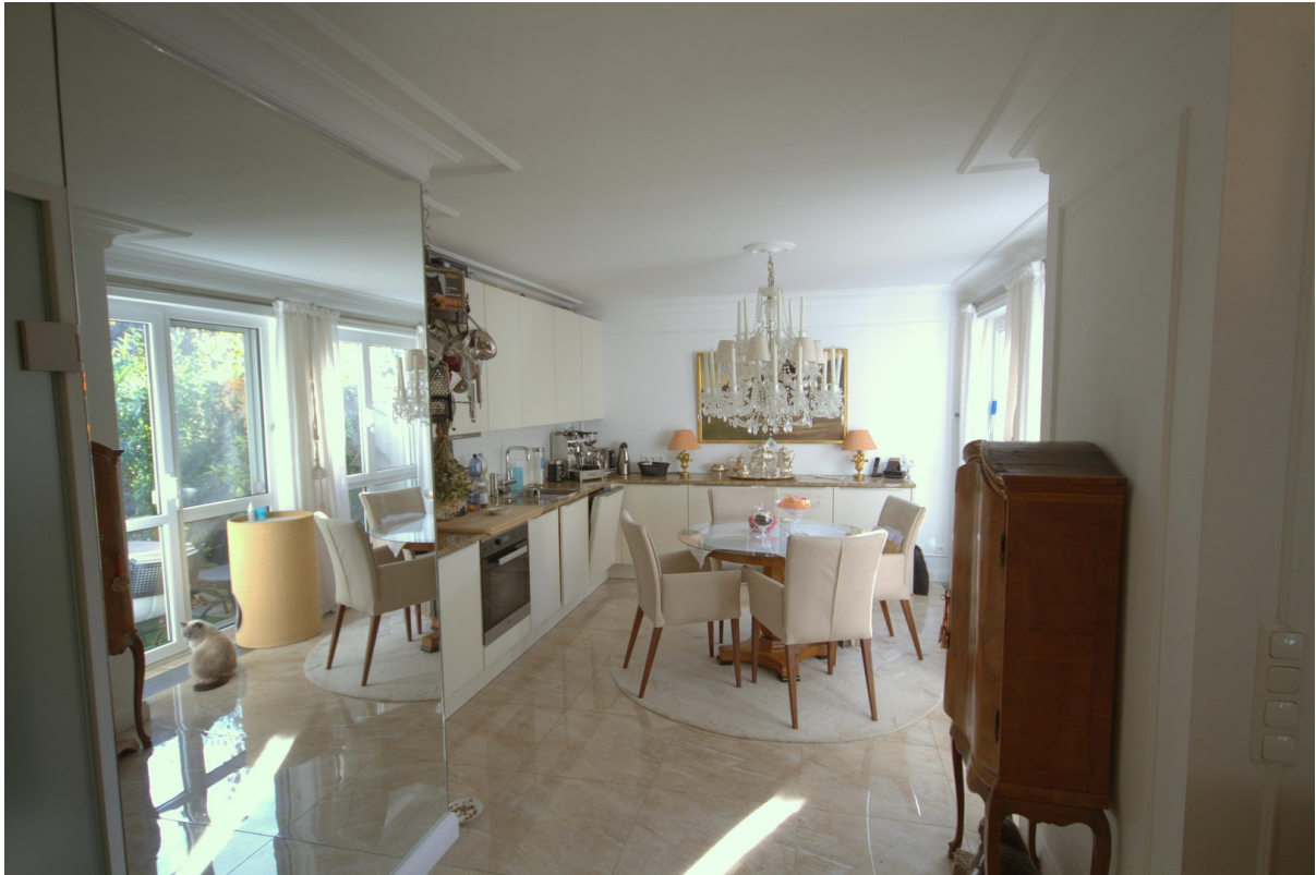
Küche / Esszimmer