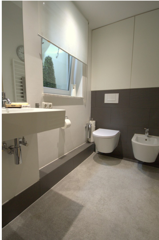
Bad mit Tageslichtfenster