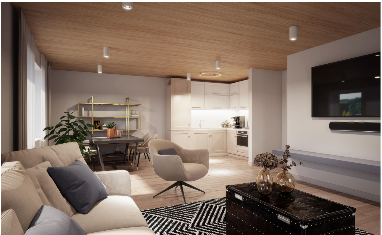
Wohnung 02 - Wohnen