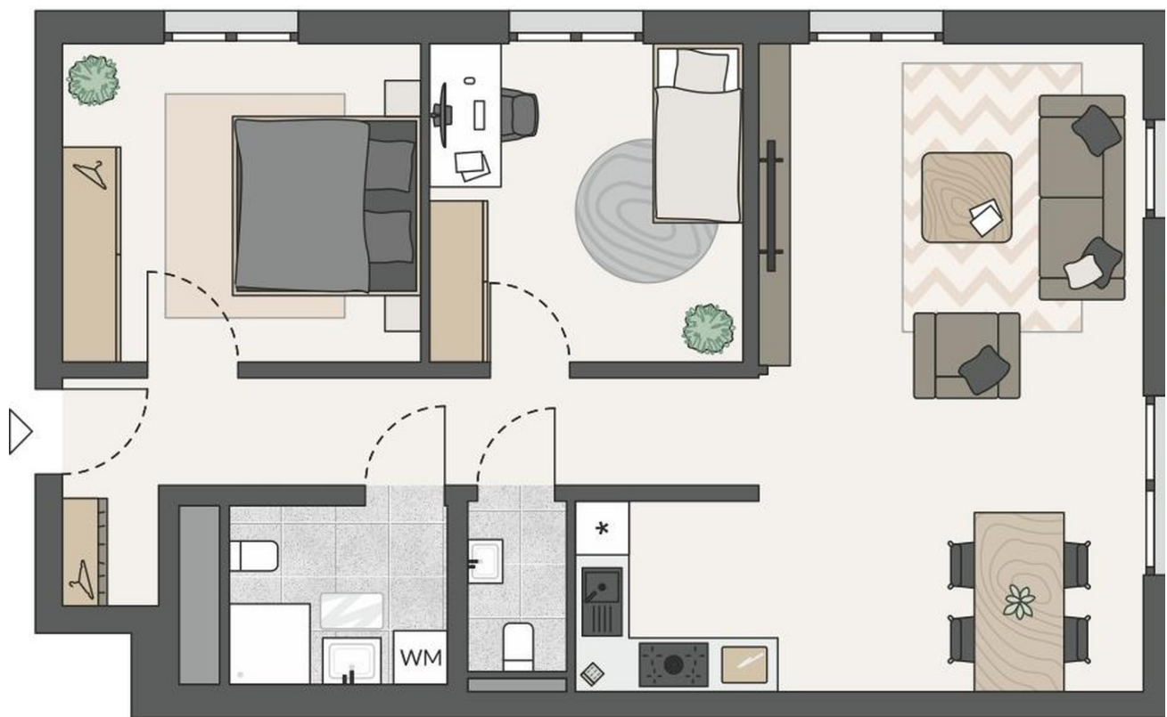
Grundriss Wohnung 02