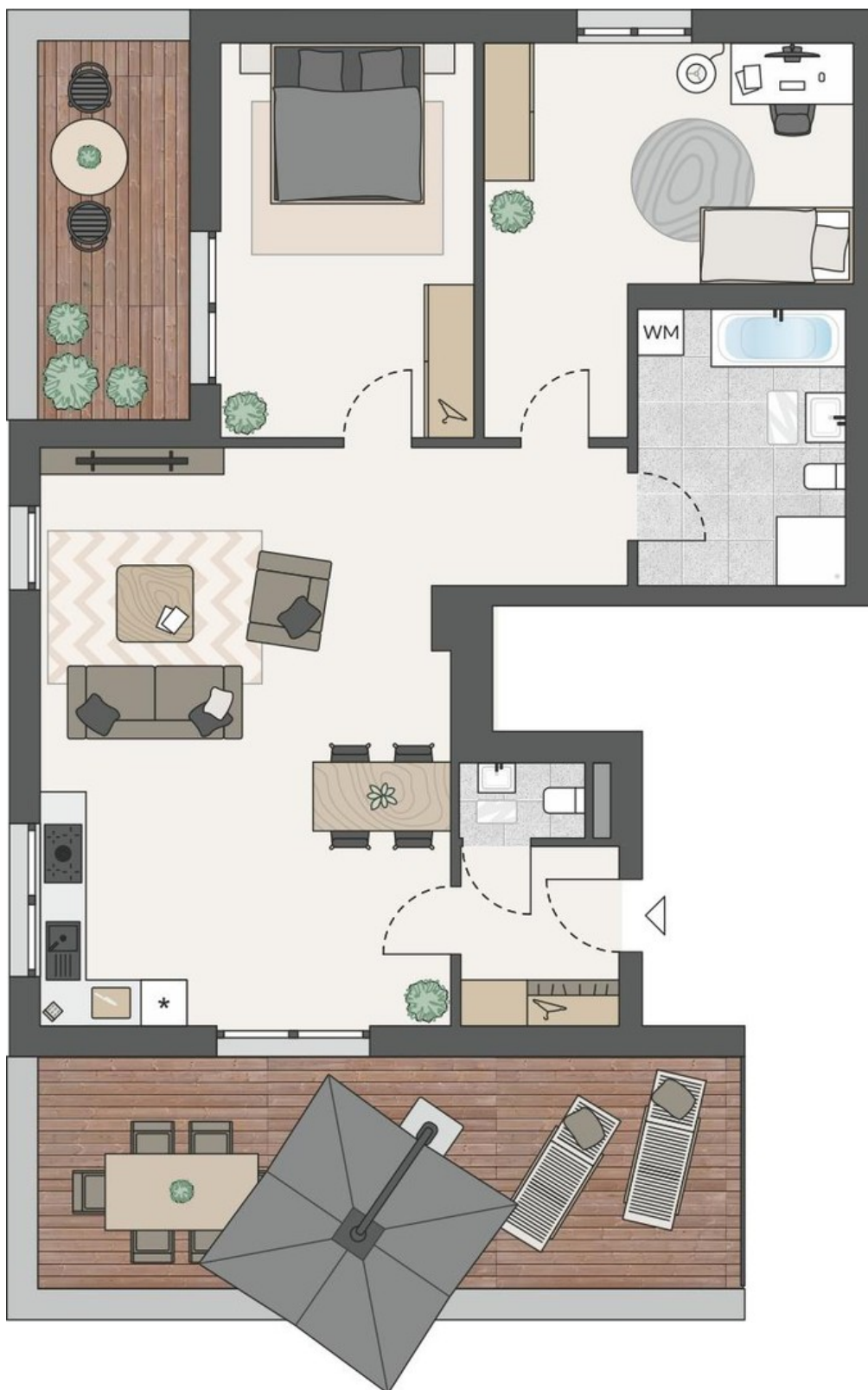
Grundriss Penthouse 01