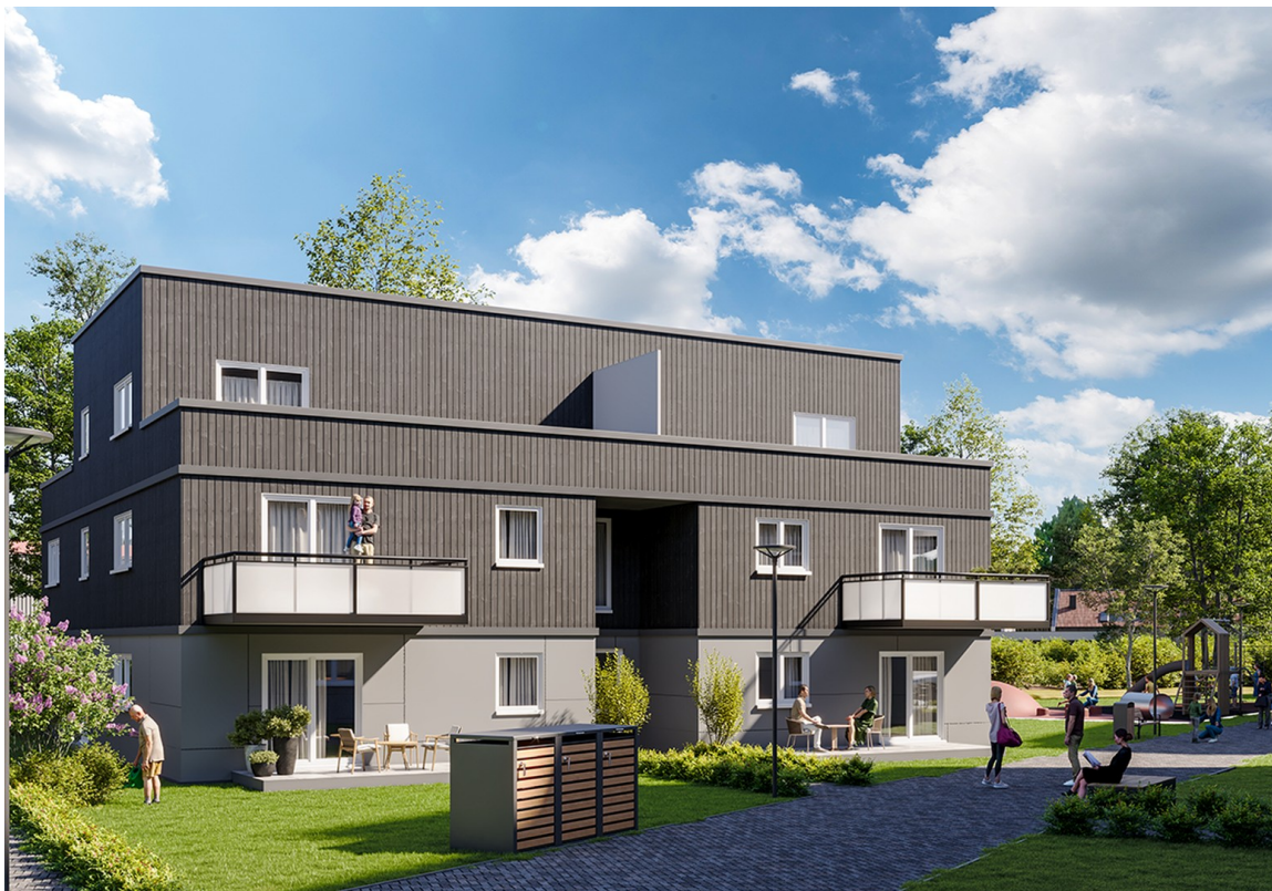
Haus 5 I 6