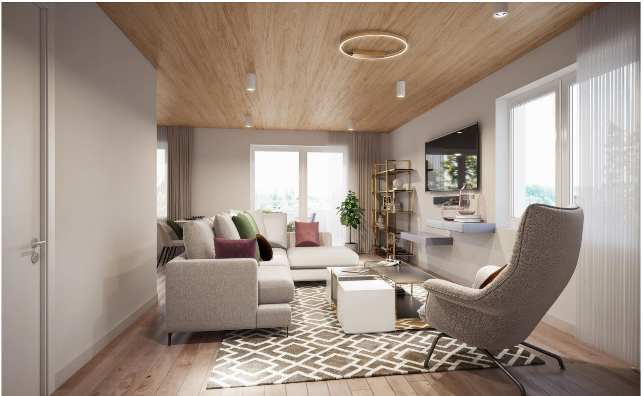
Penthouse 02 - Wohnraum