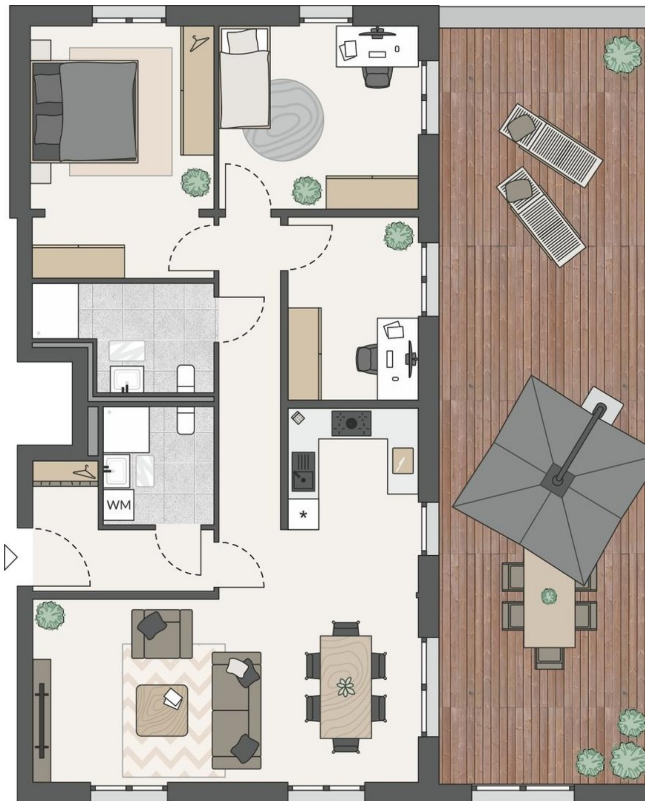
Grundriss Penthouse 02