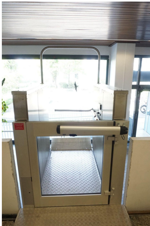
Behindertenaufzug zum EG