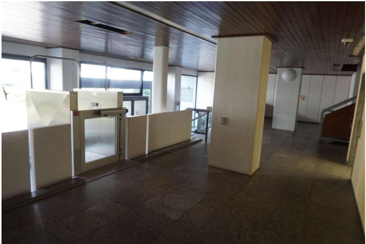
Aufzug für Rollstuhlfahrer