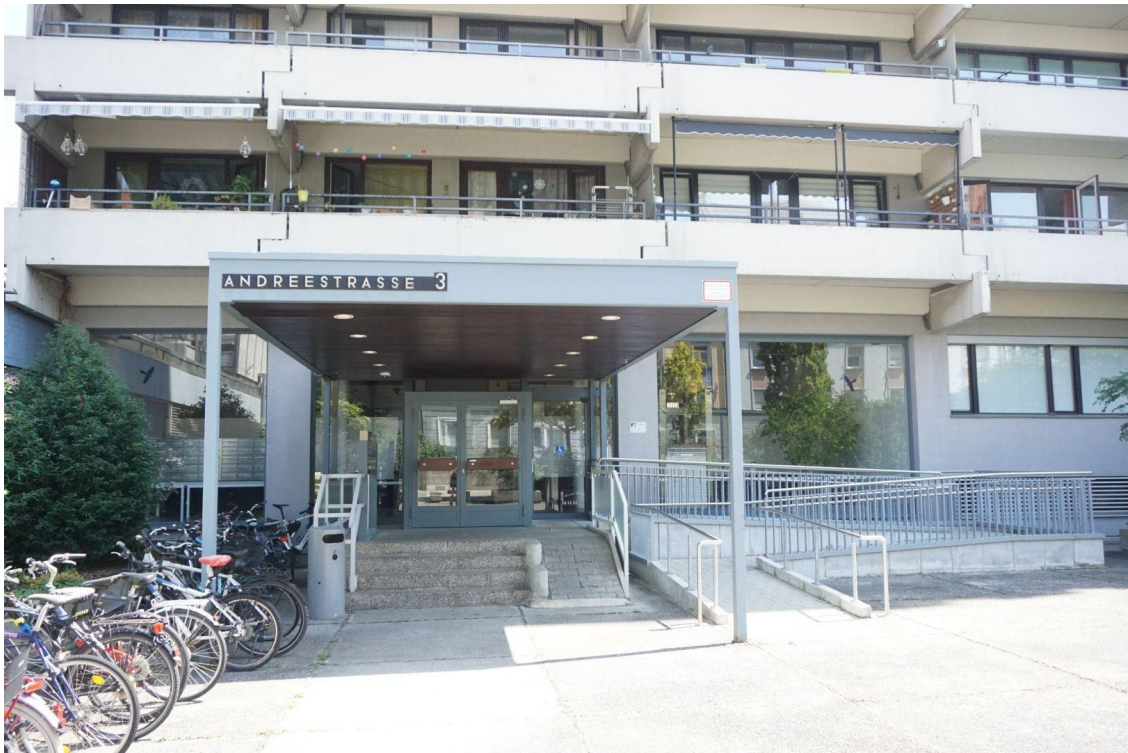
Haupteingang, re.für Rollstuhl