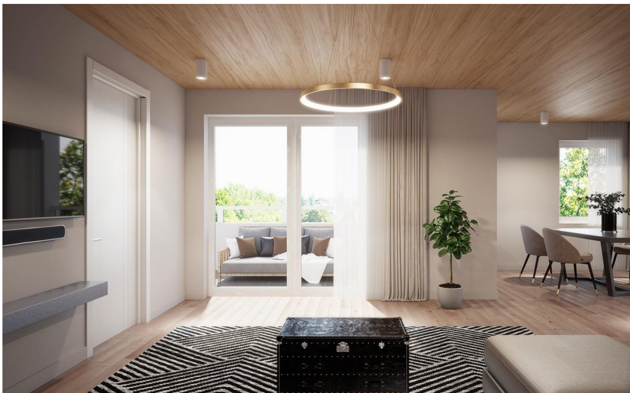
Penthouse 01 - Wohnbereich