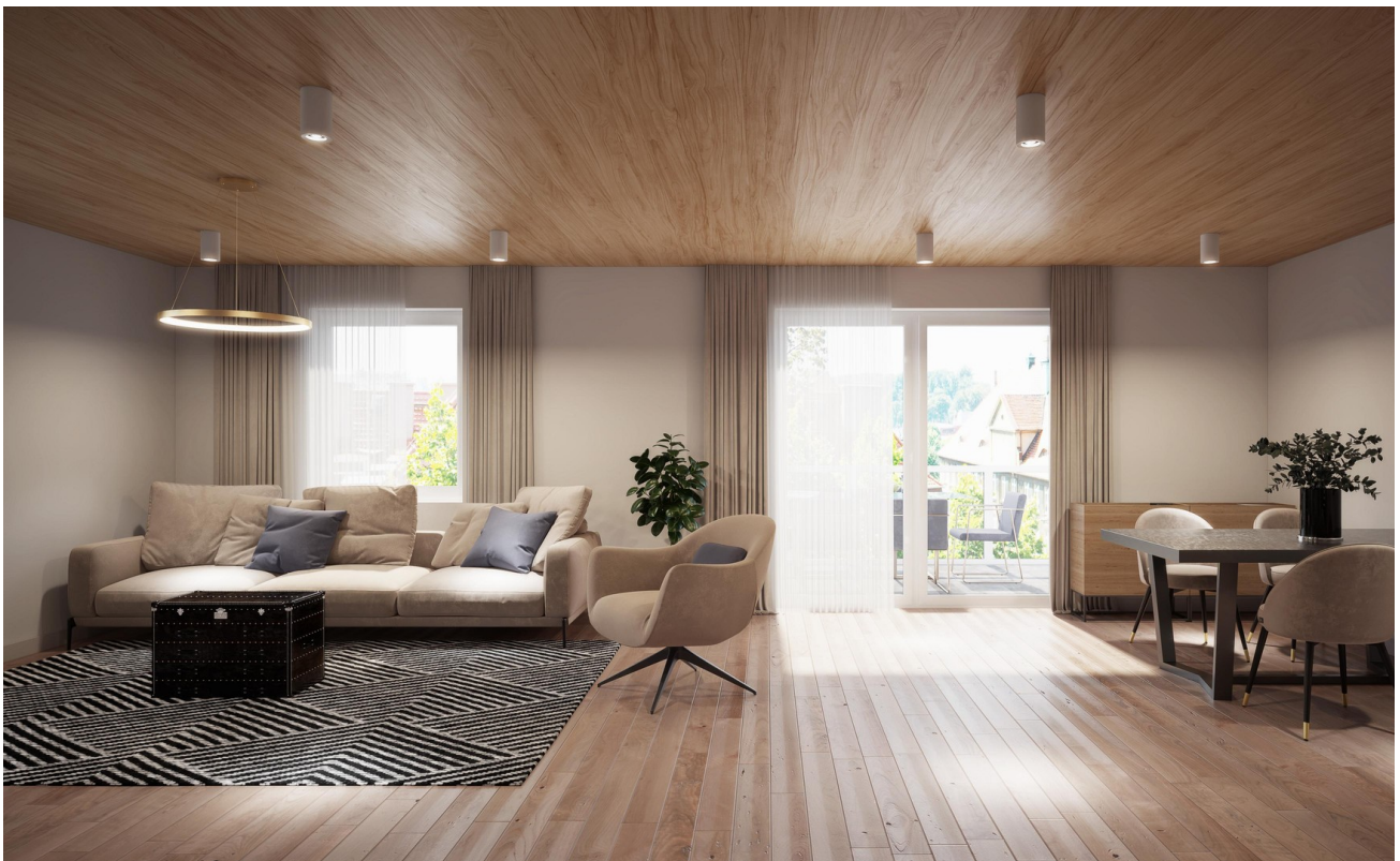
Wohnen Haus 1-4 Wohnung 8 I 12