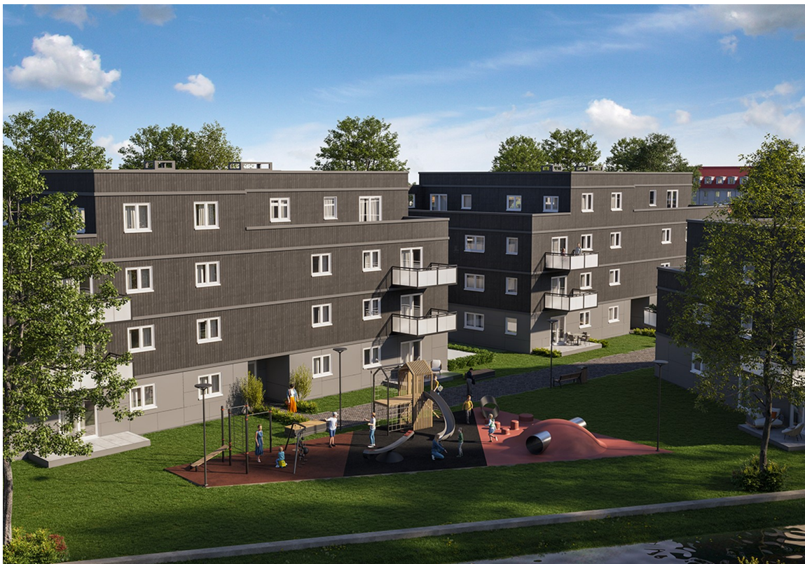
Haus 3 + 4 Innenhof