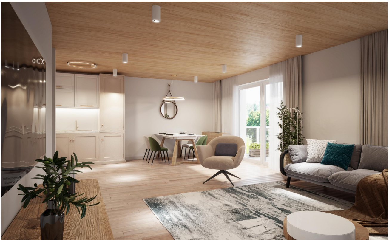
Wohnen Haus 1-4 Wohnung 5 I 9