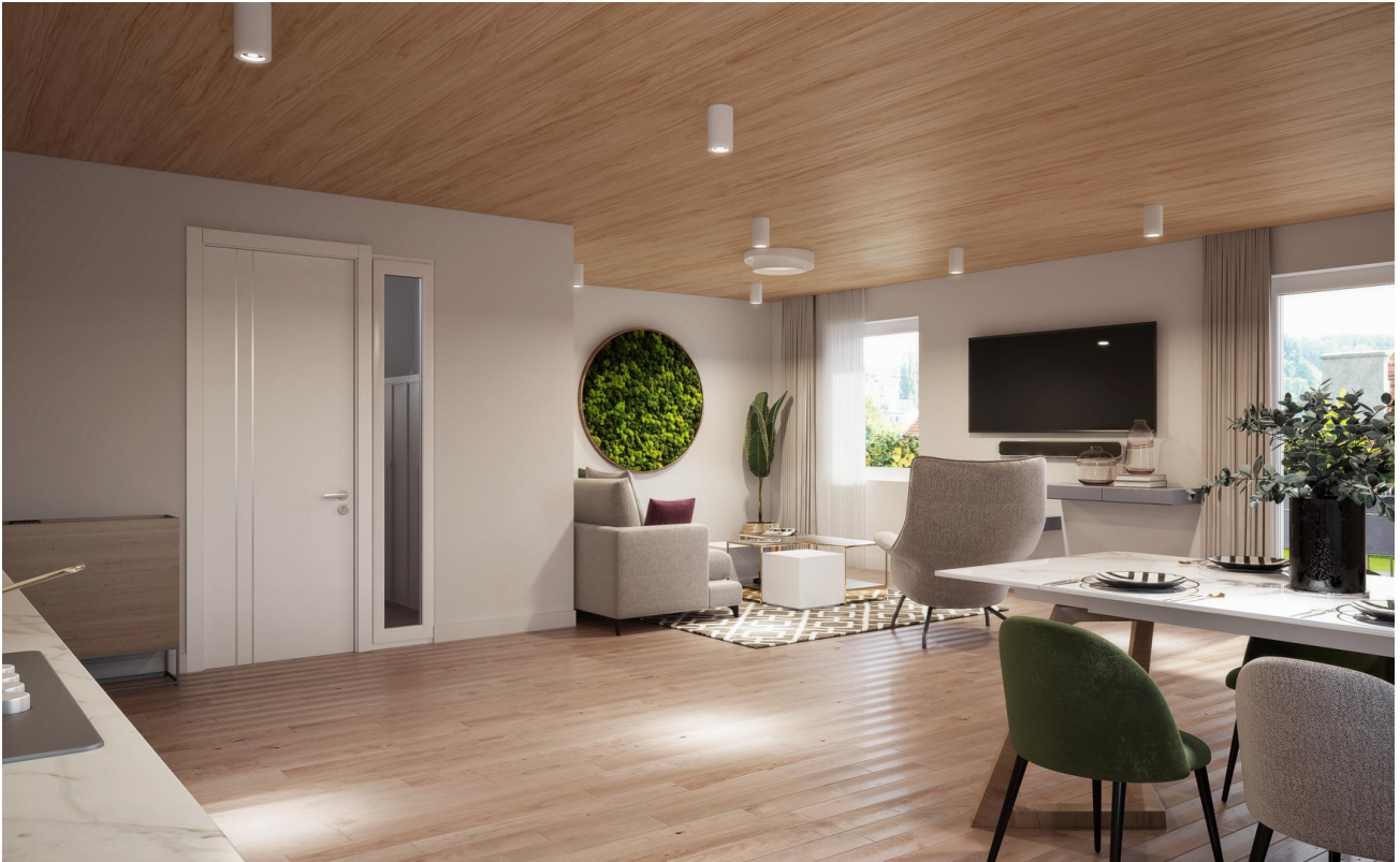
Wohnen Haus 5-6 Wohnung 1