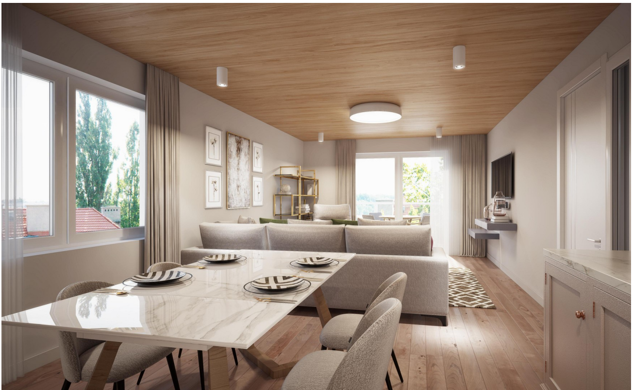
Wohnen Haus 5-6 Wohnung 3 I 6