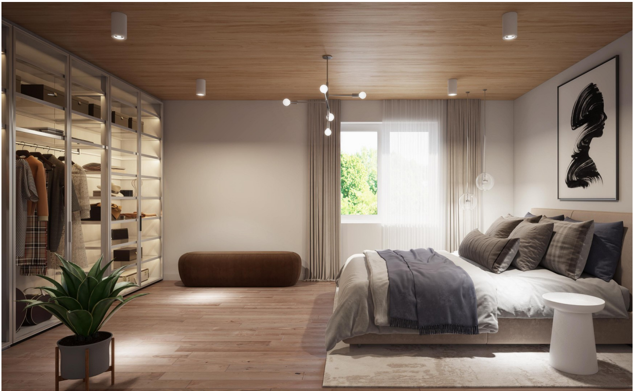
Schlafen Haus 1-4 Wohnung 6