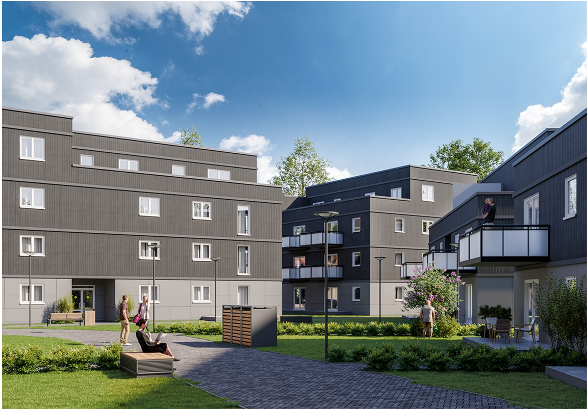
Haus 1 | 2 | 6 Innenhof