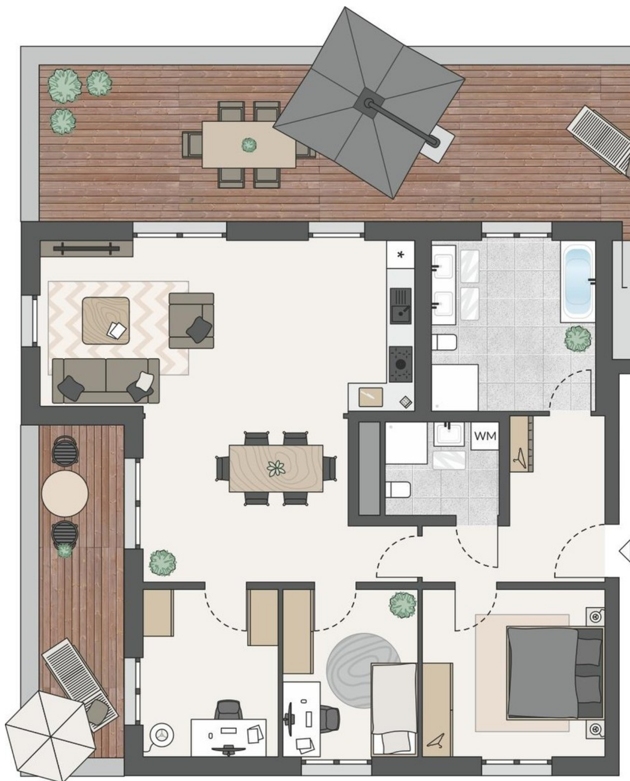
Grundriss Penthouse 01