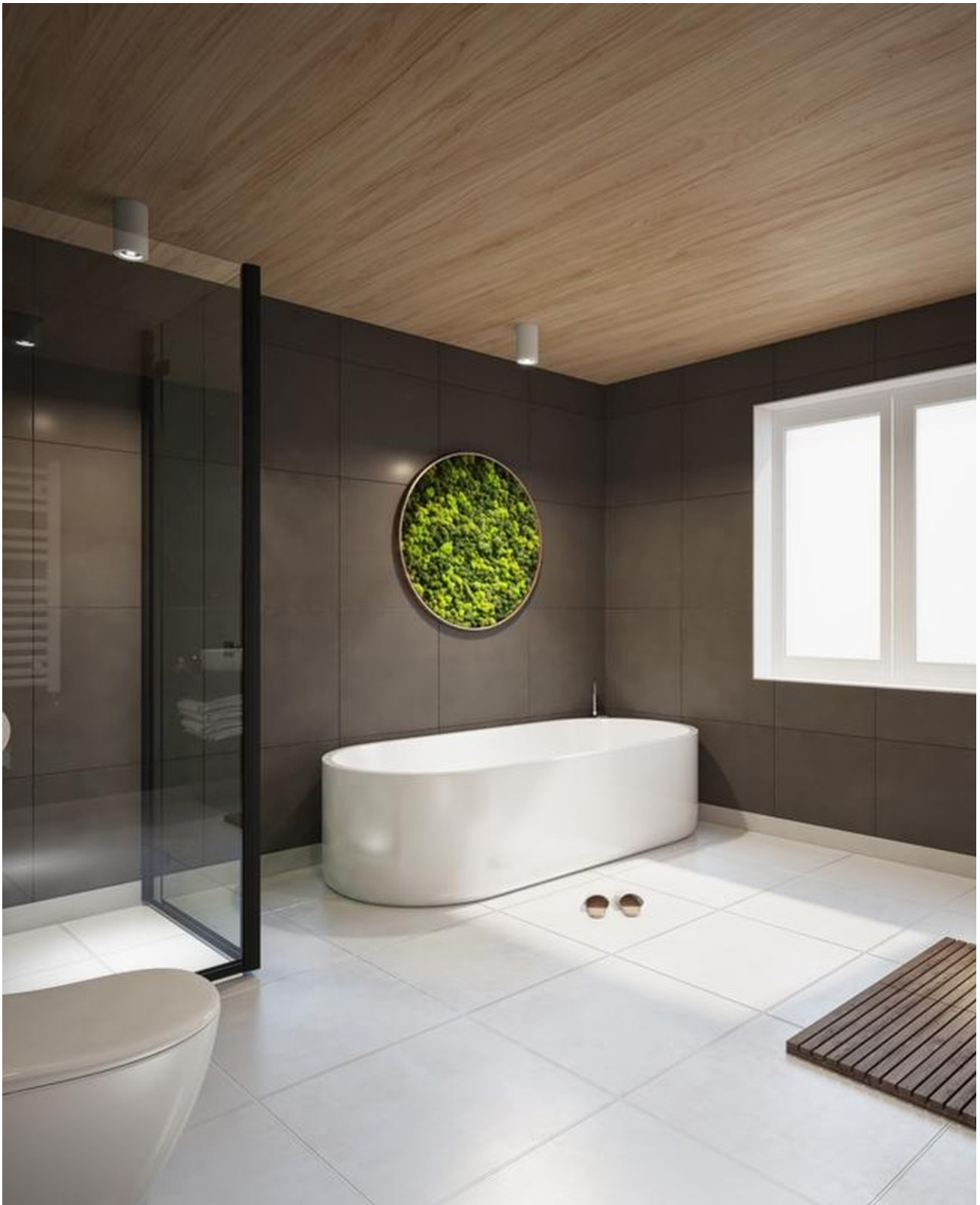
Penthouse 01 - Bad