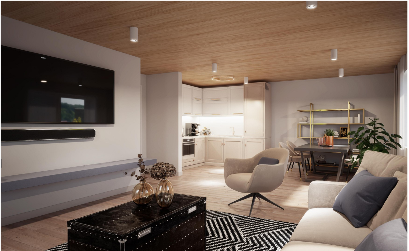
Wohnen Haus 1-4 Wohnung 1