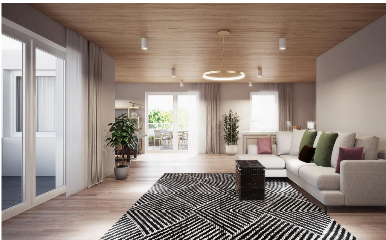
Penthouse 01 - Wohnbereich