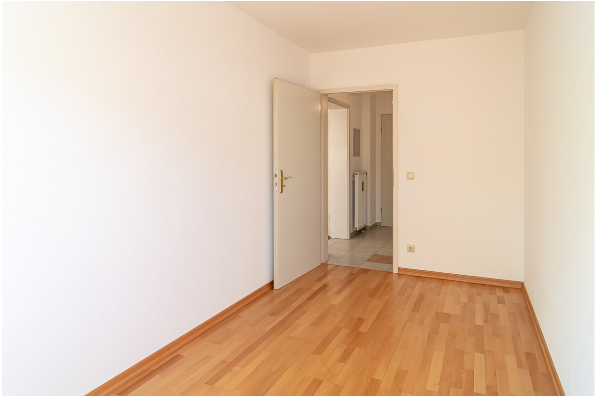
KiZi oder Homeoffice2