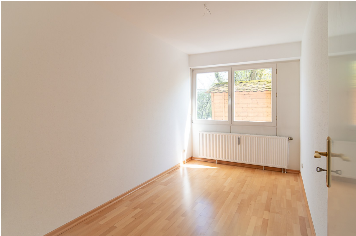
KiZi oder Homeoffice3