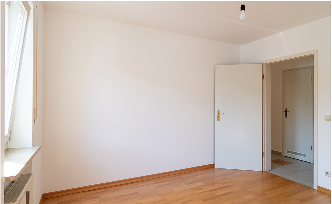
KiZi oder Homeoffice