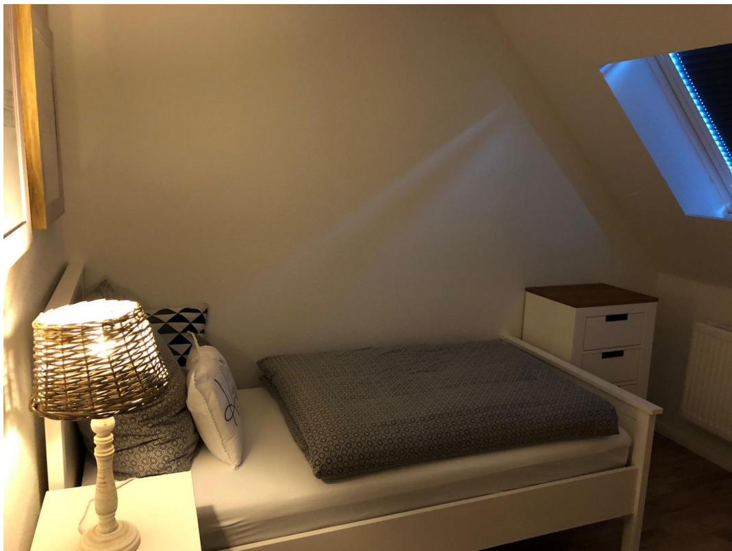
SZ mit zwei Einzelbetten