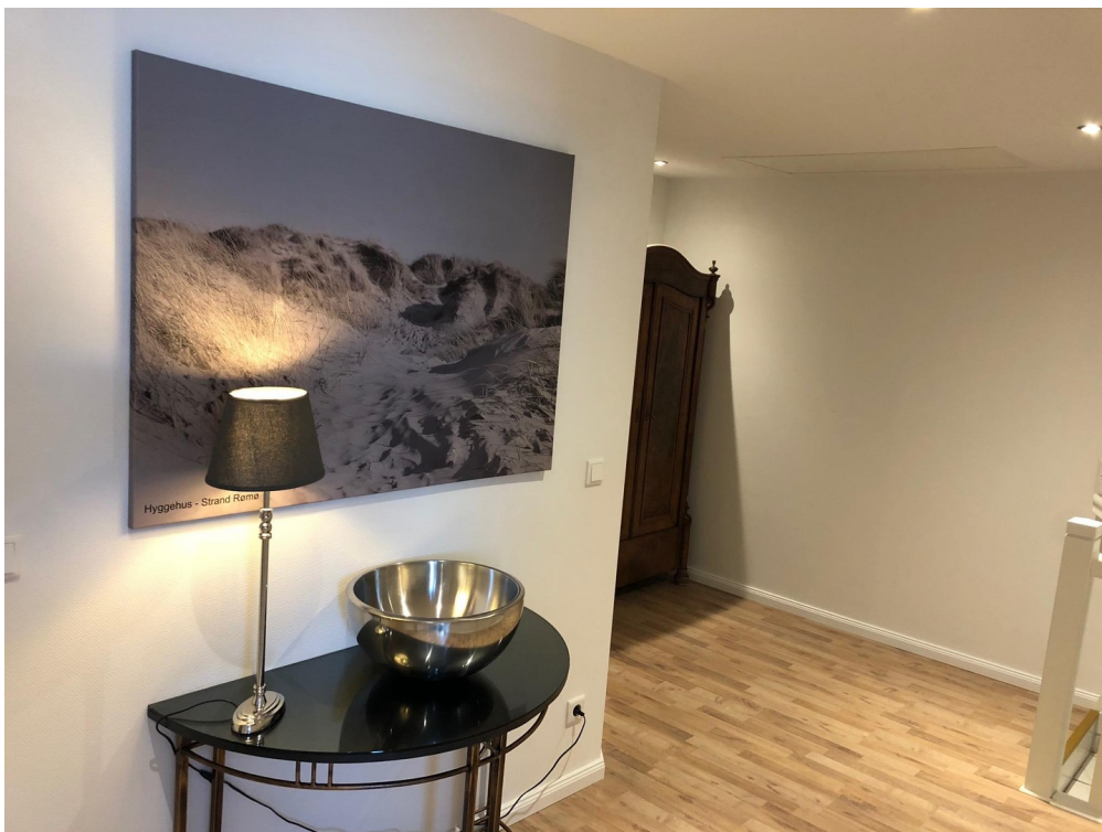
Flur im OG