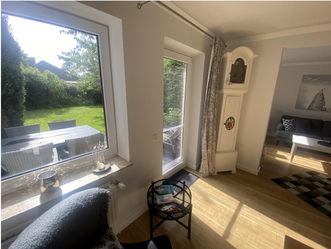
Essbereich Blick in den Garten