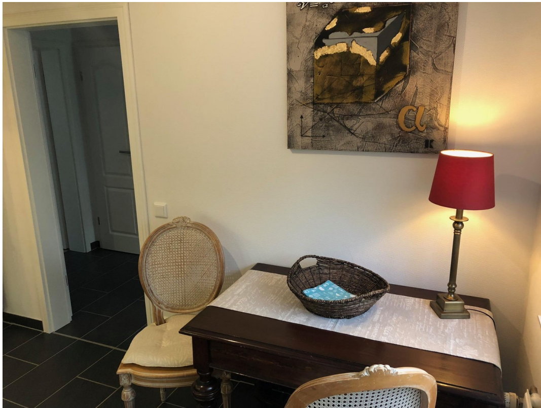
Gemütlicher Sitzplatz Küche