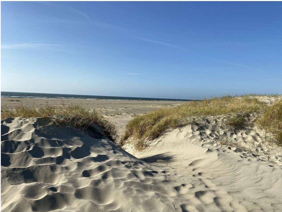
Dünen und Strand