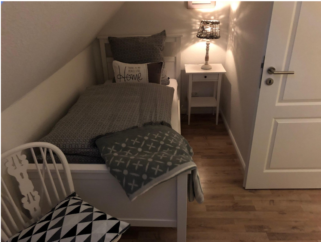
SZ mit zwei Einzelbetten