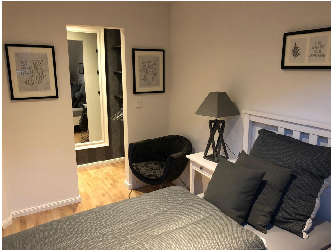
Schlafzimmer mit Ankleide