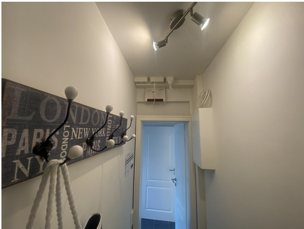
Technikraum im EG