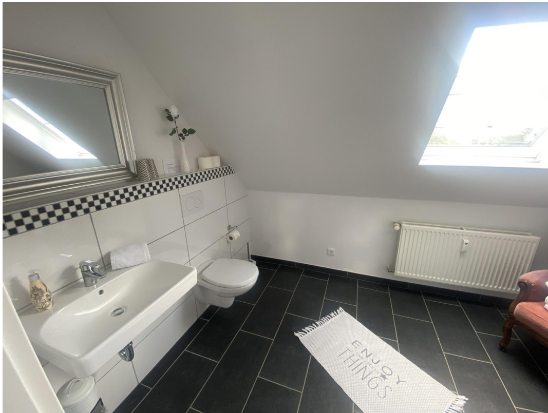
Bad im DG