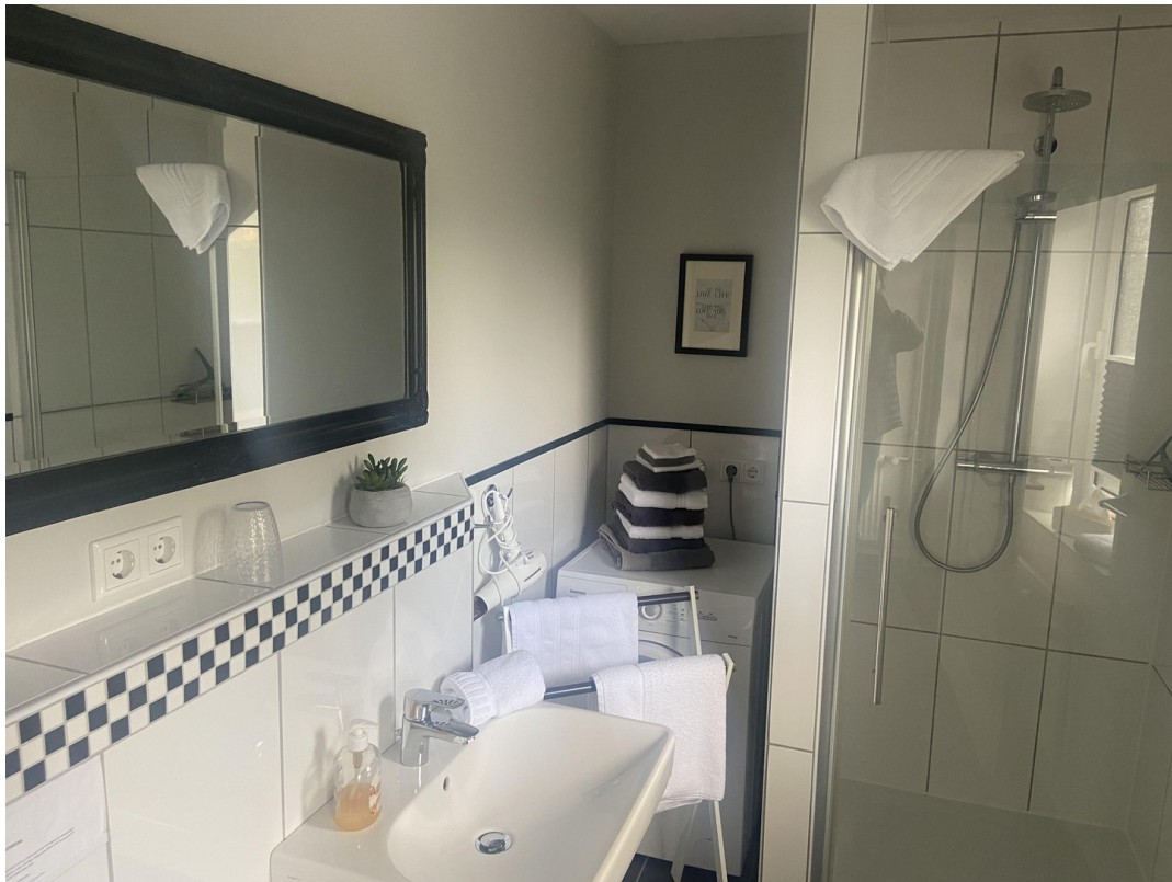
Bad DU EG