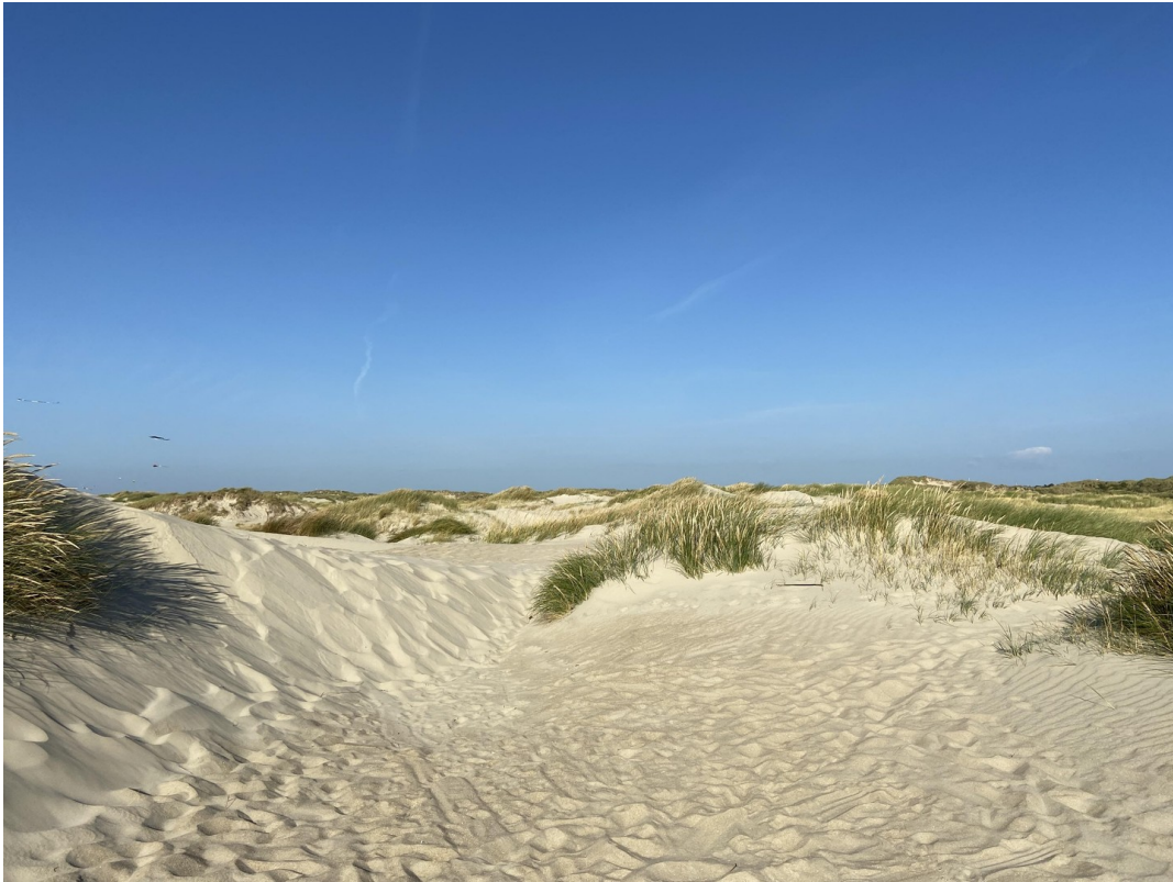
Dünen und Strand