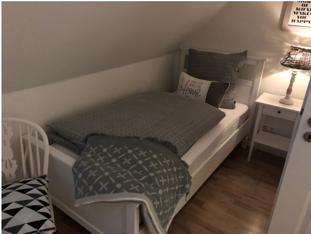
SZ mit zwei Einzelbetten