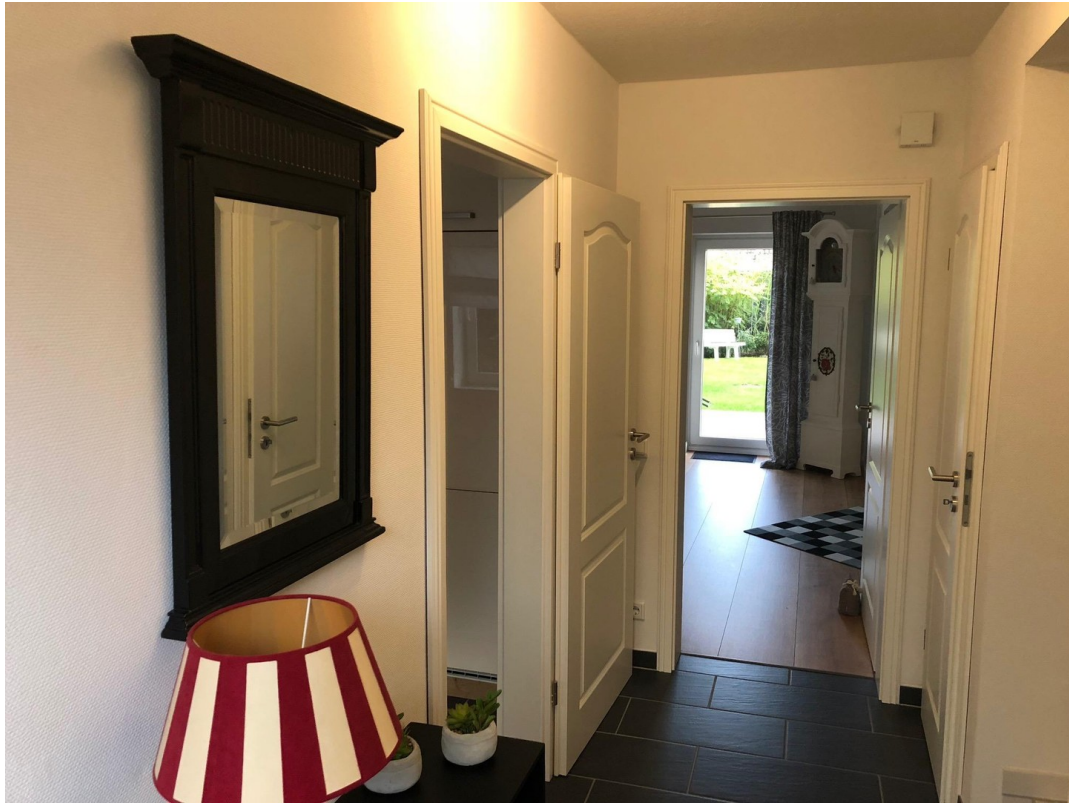
Flur im EG