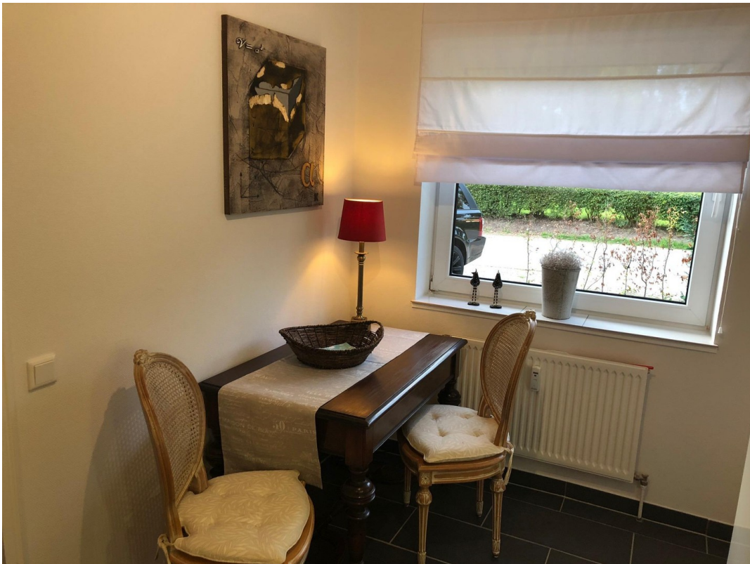
Sitzplatz Küche EG