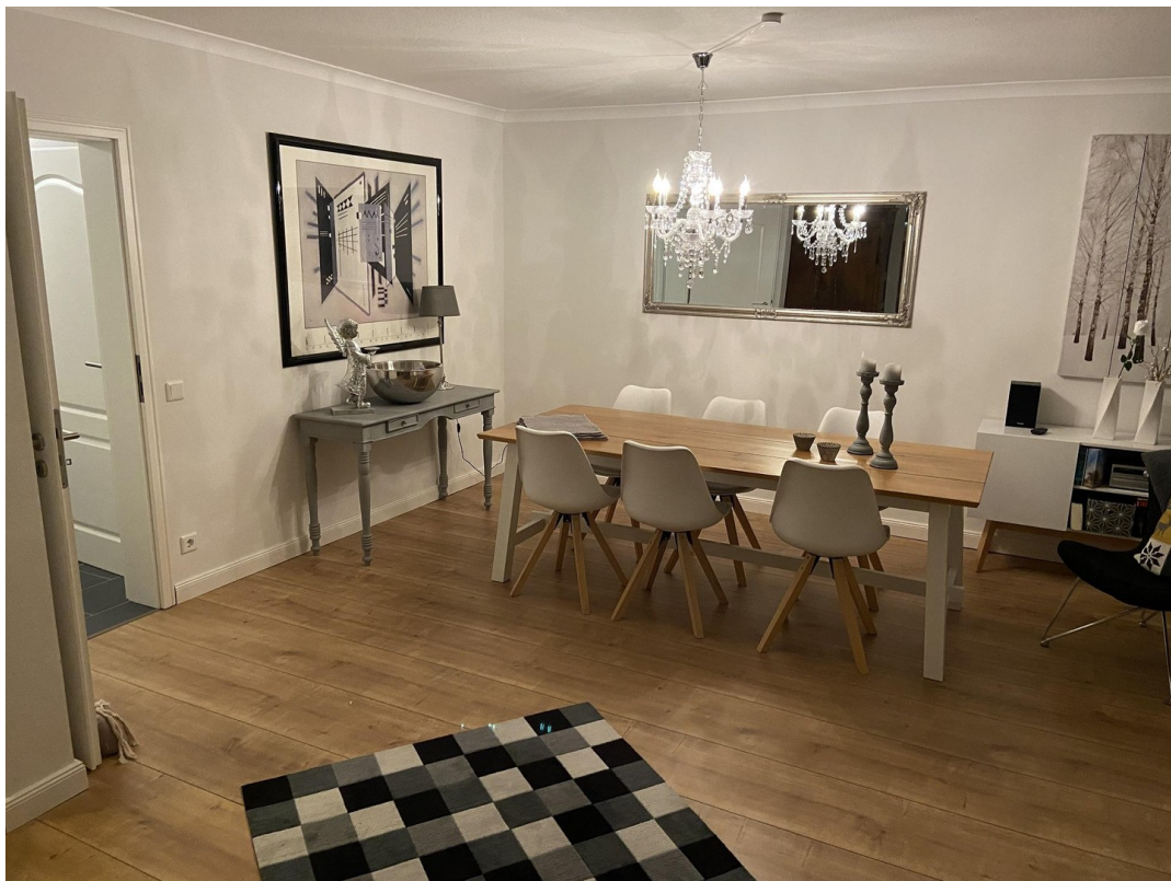
Wohnen mit Essbereich