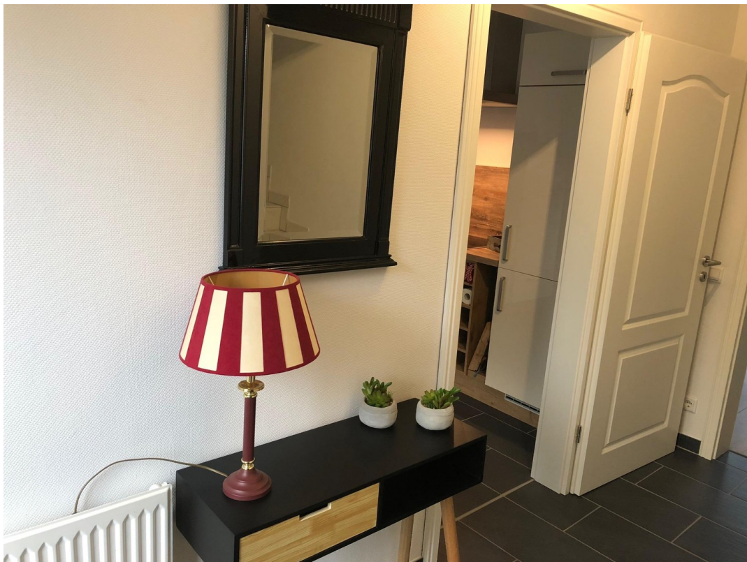
Flur Eingang Küche