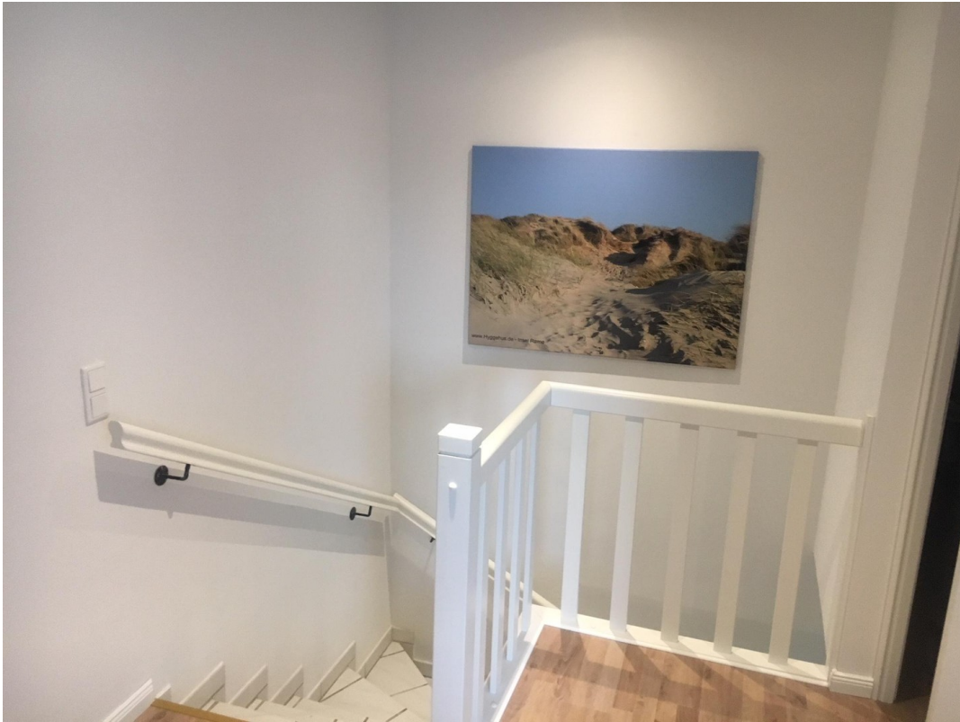
Treppe mit Galerie