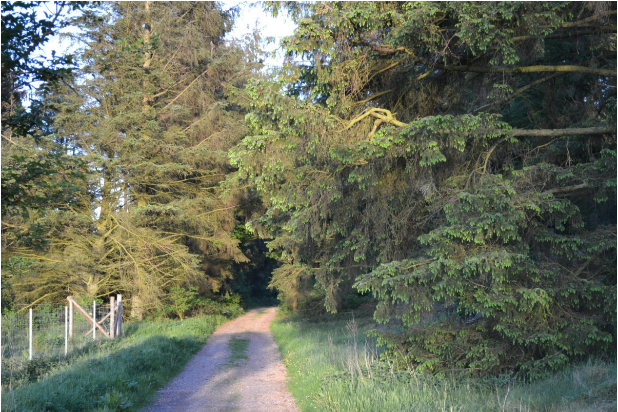
Waldweg vor der Tür