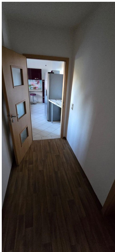
unterer Flur zur Küche