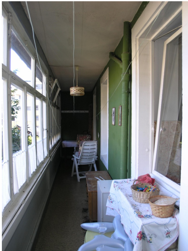
Laube / Balkon